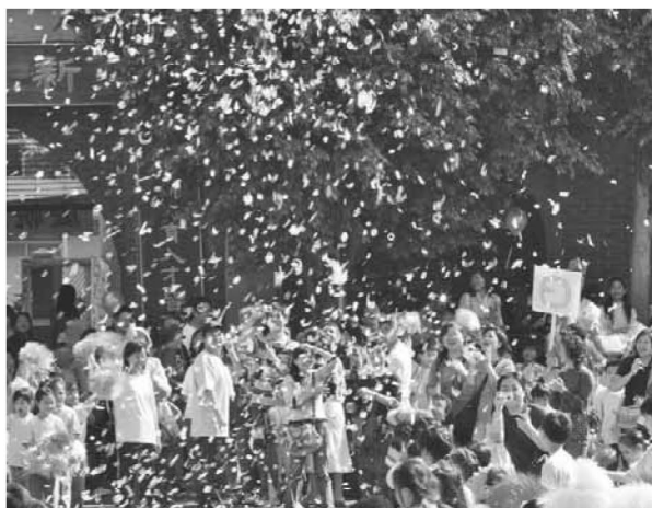
▲ 師生共慶90週年校慶