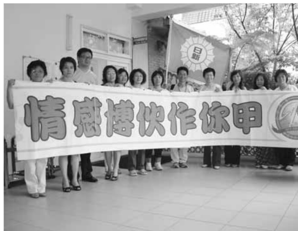
▲ 日新團隊參加決賽前的合影