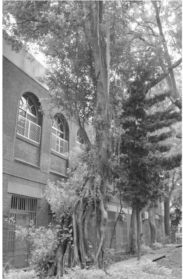
▲ 古樸典雅的校園·孕育溫馨的校園文化

本方案以「學生」為主體，經由共塑願景、全員參與、團隊合作、和諧溫馨、持續創新、永續發展的指標內涵，勾勒經營藍圖，期許開創「日新又新」的學校文化，邁向永續發展，讓日新成為優質學校。本方案