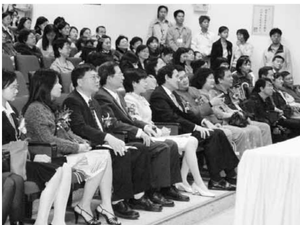
▲ 辦理閩南語教學觀摩會馬英九市長蒞校指導