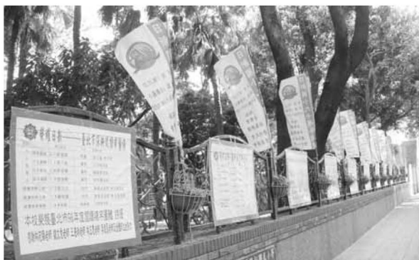
▲善用校園圍牆行銷學校發展特色

援：對於校園危機，攜手共渡；對於行政措施，講求理性溝通；對於學生學習，重視有效學習。