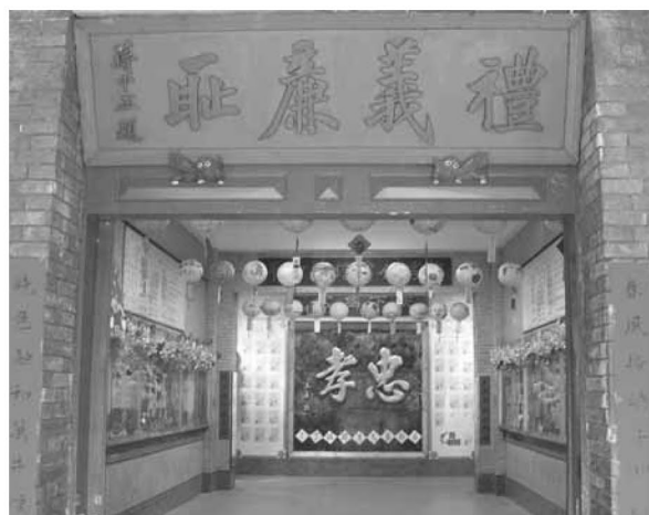
▲學生的民俗藝術作品，讓日新校園充滿著藝文氣息