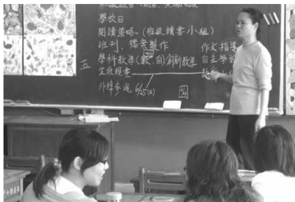
▲ 教學輔導教師與夥伴教師學期主題規劃