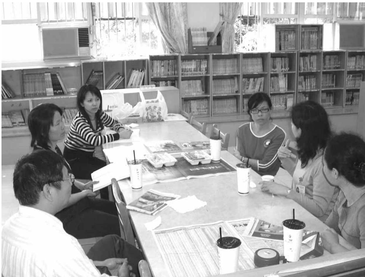
▲ 教學輔導教師制度訪視