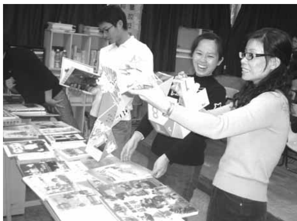
▲ 夥伴教師主題分享-歲末感恩主題教學與活動設計參觀情形

可見本校教師的研習時數逐年成長。本學年度研習時數下降，是因研習從聽講式的逐步轉向研究型或實作型的。