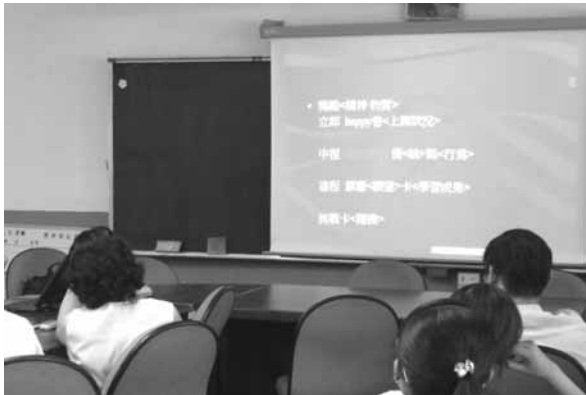
▲ 教師班級經營分享