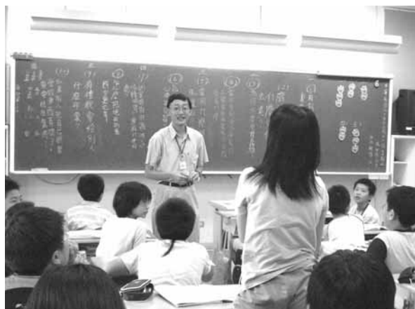
▲ 語文提問教學實景

以正式課程（學習領域）教學為X軸，以非正式課程（行事活動）教學為Y軸，加諸潛在課程（學校文化）為Z軸的薰陶，構築學校本位的教師教學鷹架，以精進教師教學能力。