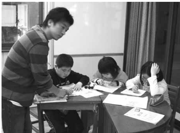
▲弱勢學生補救教學

教學的結果，有些學生100分，有些學生80分、70分，有些學生不及格，教師不會因為這樣而放棄教學，更應檢討反思，精進教