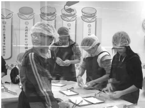
▲ 漢堡製作校外實地教學