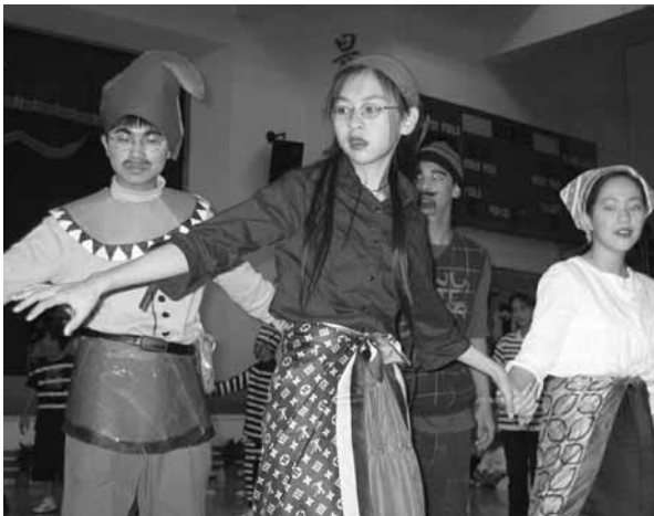
▲ 彩妝進行式讓學生發揮創意