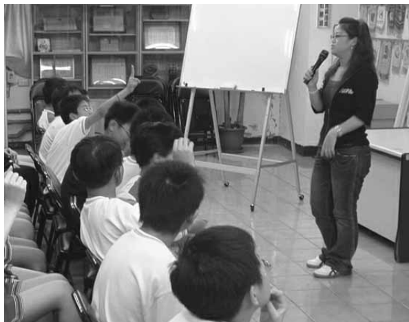
▲ 參訪創世植物人中心

執行，有效整合各處室既有力量，不只能共研出周密的計畫與相關配套措施，更能隨時透過垂直與水平的溝通解決相關問題，並充分發揮互助合作的能力，例如：教務處負責生態之美、水資源博物館、電影欣賞之一切責任；訓導處負責戶外體驗活動之一切安排，包括帶隊管理、聯繫、收費、交通與保險等；輔導室負責課程規劃、課程總表排定、職前訓練、參訪之帶隊與聯繫、教案教材之編寫製作、編印手冊、教師觀察記錄回收、會議聯繫、檢討、資料統計、行動研究及偶發事件處理等。有效提昇了學校整體的執行力。