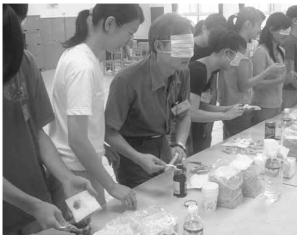
▲ 矇眼塗果醬吃麵包體驗盲人滋味