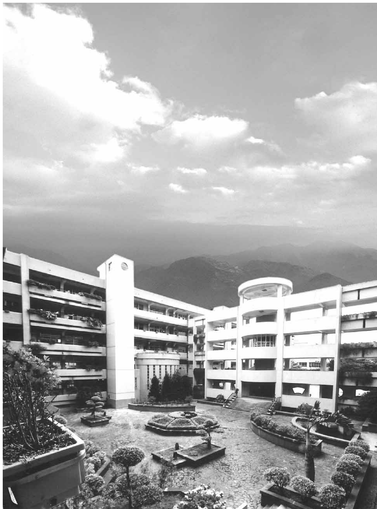
■ 臺北市立景興國民中學