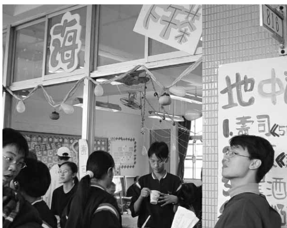
▲ 校園園遊會熱鬧非凡