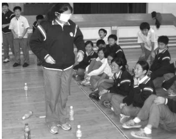
▲ 矇眼過地雷區體驗活動

能潛藏的問題、擬訂計畫、備妥教學情境、實施前測、全方位推動生命教育課程、蒐集資料、進行訪談、實施後測以及召開檢討會等步驟(如圖1)。