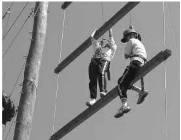
▲ 體驗課程挑戰自己的極限