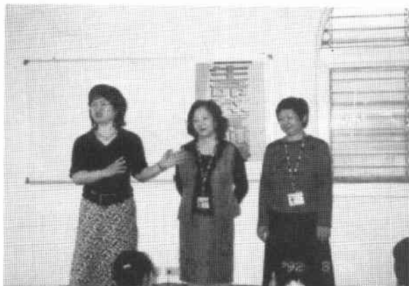
照顧獨居老人志工經驗分享