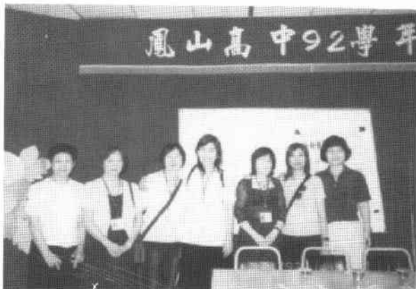
「活著真好」講座結束後大家留影