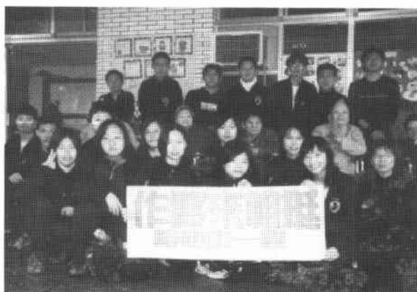
寒風中啦啦隊隊員與長者合影