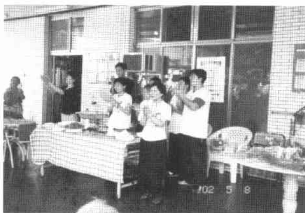
帶去茶點鮮花和長者同歡