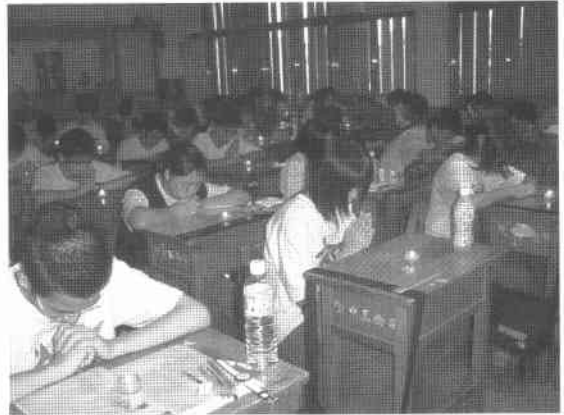
班級經營—將過記在手心上