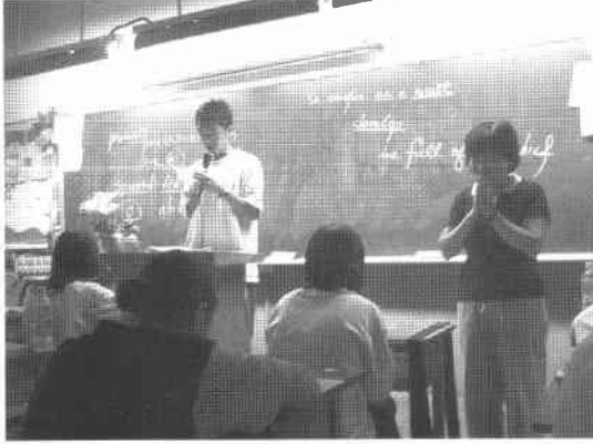
班級經營—點心燈祈福