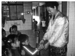
感謝石媽媽每天幫我們清洗茶杯、擦地板

孩子們帶著自製的卡片及一顆感恩的心，在老師的帶領下，到校園及社區中拜訪為我們服務的人。