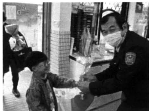
感謝警衛叔叔保護校園的安全

事情，經老師一再強調是為大多數的人服務的對象，才慢慢有了警察、里長...等的出現。