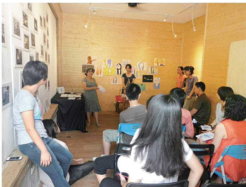
圖 4 全人畢業製作。