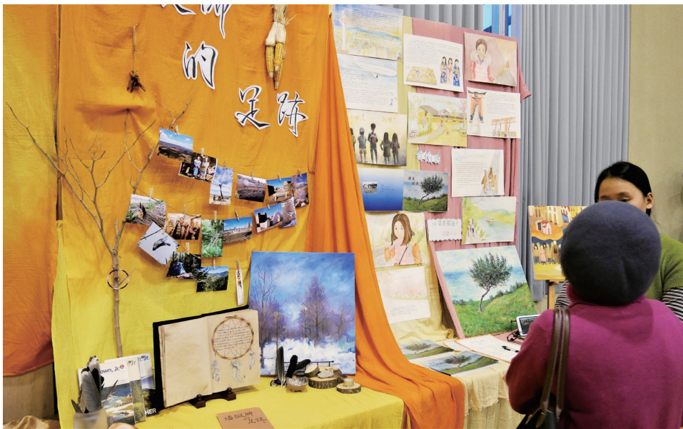
▼ 圖 2 專題展攤布置