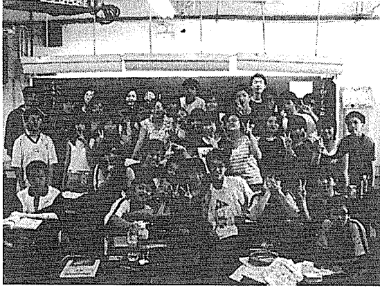
圖三 穿榮譽便服的感覺很好

(四) 在扭蛋內容中補充「勵志小語」，學生每次抽扭蛋，除了公佈自己的獎勵外（圖五、圖六），也要以勵志小語的內容為題，自由發揮說幾句簡單的心得（圖七、圖八）。