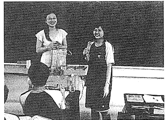
圖八 「要當好學生喔」