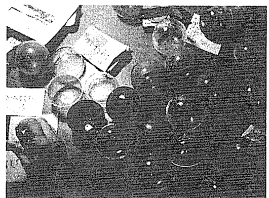
圖二 教師製作扭蛋