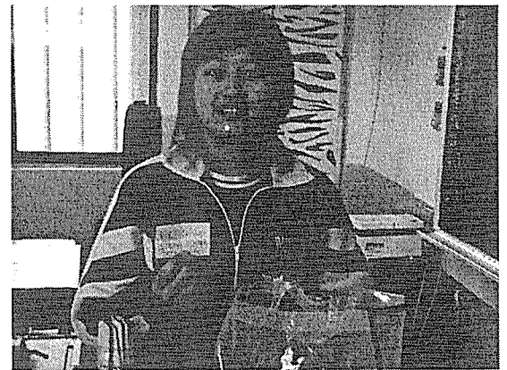
圖六 抽到校園網咖乙次