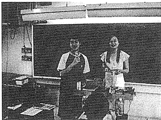
圖七 說一個冷笑話吧