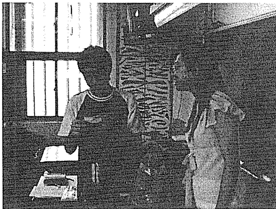
圖五 抽到早餐乙份