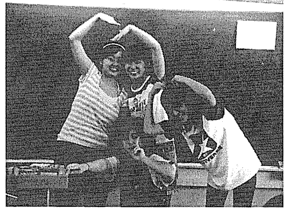
圖四 把握機會秀一下