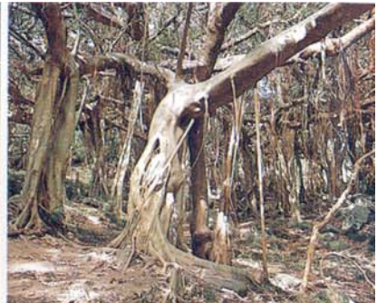
Racines fibreuses de la figue blanche (Kangkou)