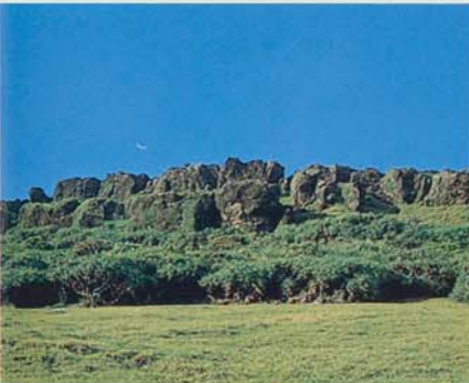
La falaise qui s'affaisse (LongPan)

La topographie complexe ainsi que les espèces florales procurent un environnement idéal pour la vie des animaux. La diversité s'étend des oiseaux (240 espèces) aux papillons (202 espèces), en passant par les reptiles et les amphibiens (60 espèces) et toutes sortes d'insectes. Les mammifères sont fréquemment aperçus dans les forêts naturelles et dans les réserves animales. En outre, chaque automne et chaque hiver, de nombreuses espèces d'oiseaux migrateurs s'arrêtent dans la région tel que pie-grièches brunes, buses à tête grise, éperviers chinois etc. C'est vraiment un émerveillement que de voir un ciel rempli d'oiseaux. Les Oies sauvages et les canards sont aussi très nombreux dans les lacs et les étangs. Tous ce trésor est de grande valeur à la fois pour les plaisirs et l'éducation. Il est de notre devoir de prêter plus d'attention à la protection de la faune et de la flore qui composent notre écosystème.