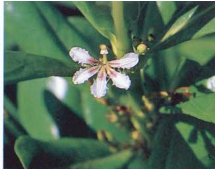
Affaïssement (Baie de la Banane)