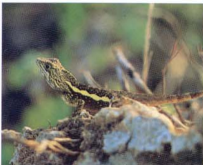
Japulura swinhonis mitsukurii