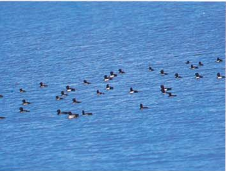
Canard huppé (Lac Longluan)