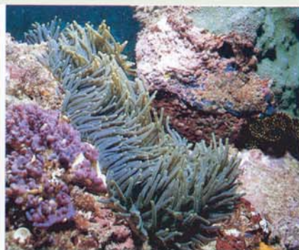
Les vies florissantes en eau peu profonde