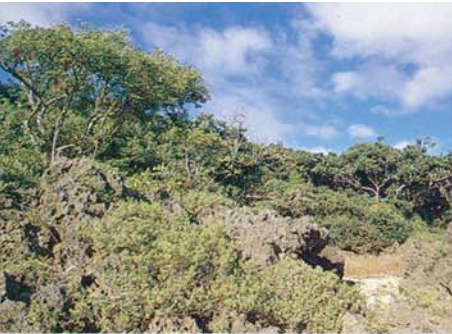
La forêt côtière tropicale (Baie de la Banane)