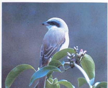
Arrêt sur les oiseaux migrants: pie-grièche Brune