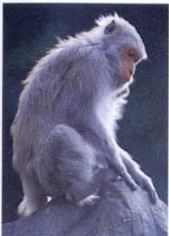
Singe de Taiwan