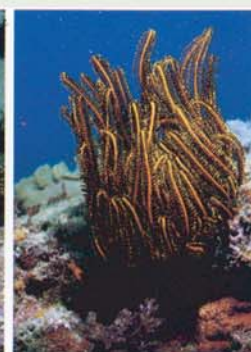
Le lis de mer