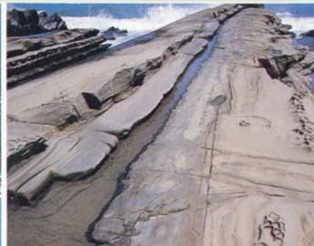
Le grès (Chialoshui)