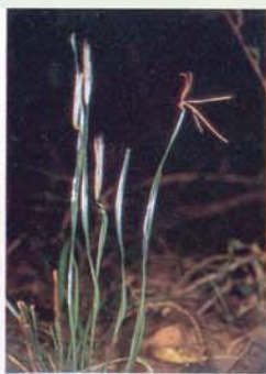
Espèce rare: Actinostichus digitata