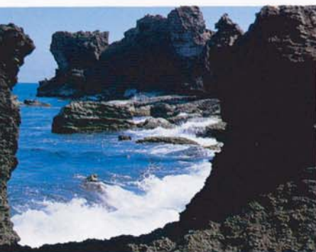
La côte du récif de corail (Maopitou)

Tel un musée naturel en plein air, le parc comprend tous les genres de décors naturels, traces de mouvement de la croûte terrestre, de l'évolution des animaux et des plantes à travers des millions d'années. Nous vous accueillons au parc avec joie, pour votre divertissement et pour participer à des explorations. Nous souhaitons que tout le monde puisse apprécier les précieuses ressources naturelles de Kenting afin que le parc puisse subsister à jamais pour les générations présentes et futures.