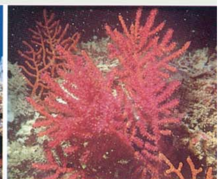
Le corail rocailleux