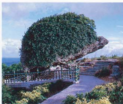
Le récif de corail érodé (Kuanshan)