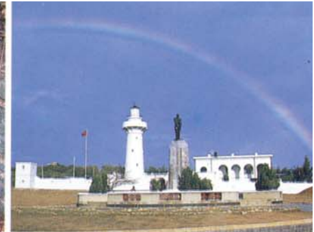
Le phare construit en 1882 (Oluanpi)