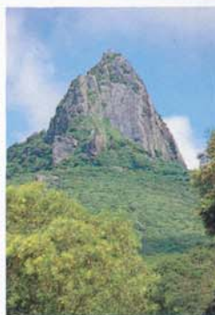
Le rocher du conglomérat (Mt. Peak)