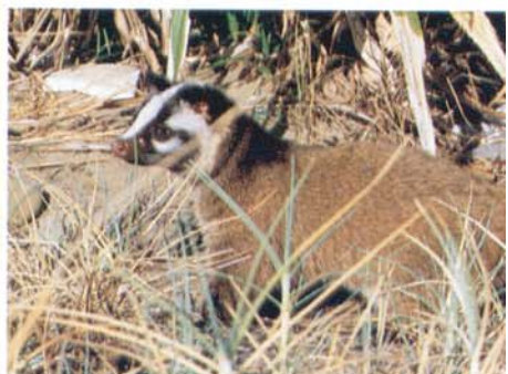
Paguma larvata taivana