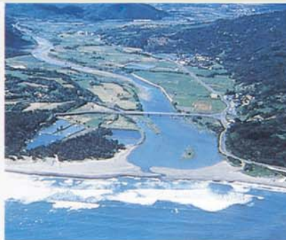
La bouche Priver (kangkou His)