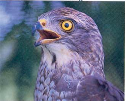
Arrêt sur un oiseau migrant: La buse à tête grise