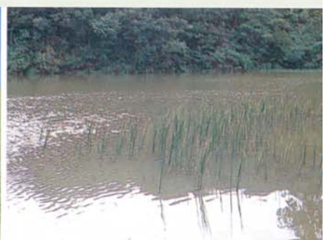
Plante de marais (Lac Nanjen)