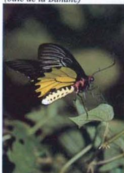
Espèce rare: Troides aeacus kaguya