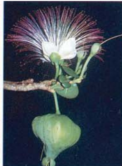
Barringtonia asiatica (baie de la Banane)