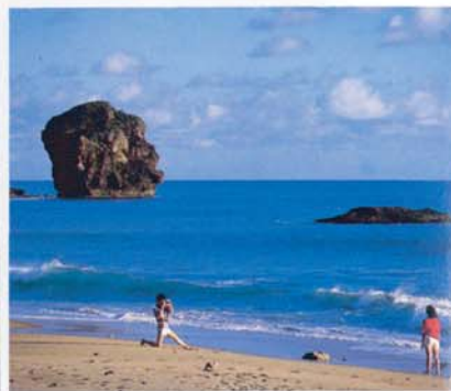
Le rocher du récif de corail (Rocher de la Voile)