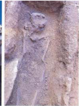
Le cercueil dallé, 4000 ans Av.Jc. (Oluanpi)