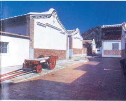
l'héritage culturel (Centre d'Activité de la Jeunesse)