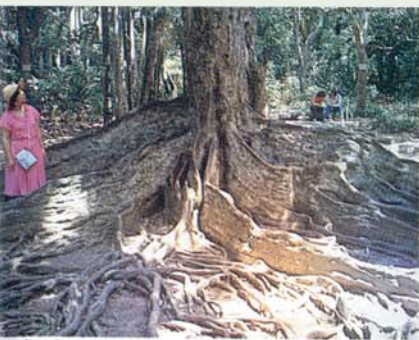
L'arbre à racines plates (Forêt de Loisir de la Forêt de Kenting)