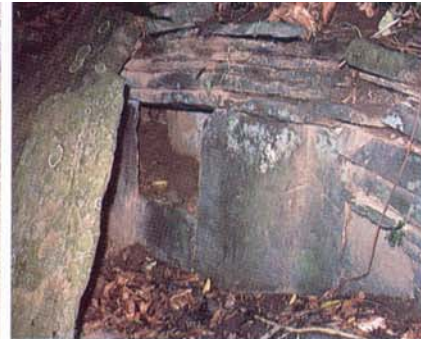
La maison dallée (Nanjen Shan)