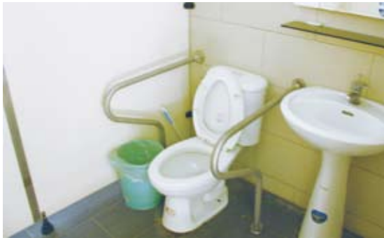
1.廁所：迴轉空間不足，開門方式造成無法自主進出；扶手裝置過高或錯置，鏡面過高不符需求。