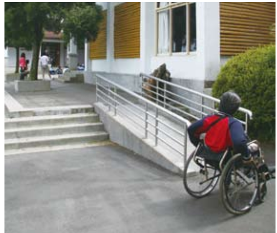
2.坡道：斜坡比例不足1:12導致過陡，扶手直徑過粗或未設置防護緣造成使用障礙。

森林遊樂區進行檢覈工作，一方面採用「建築物無障礙設施設計規範」的項目與標準檢覈屬於硬體設施設備的部分，例如：遊客中心、售票亭或自然教育中心的出入口、斜坡、無障礙廁所、停車場……等等項目，而另一方面針對戶外範圍則採取使用者的觀點進行實地檢覈，提供發現與建議，例如：園區地圖資訊、指標、解說牌的高度角度、休憩平台的動線、鋪面……等等。在進行18處國家森林遊樂區勘查的實例