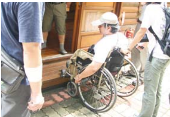
3.出入口：階梯對行動不便者形成入住阻礙。