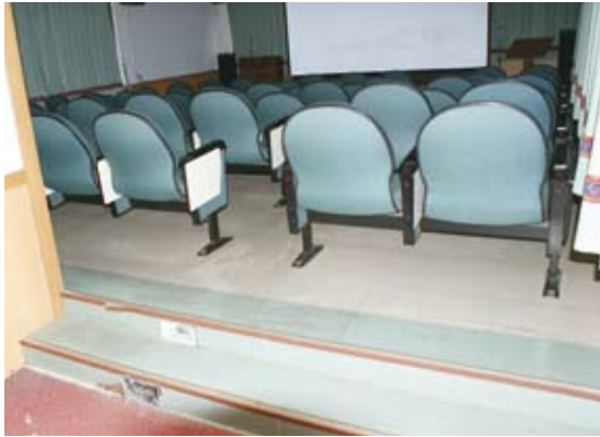
5.視聽室：門檻以及普遍缺乏輪椅席區。