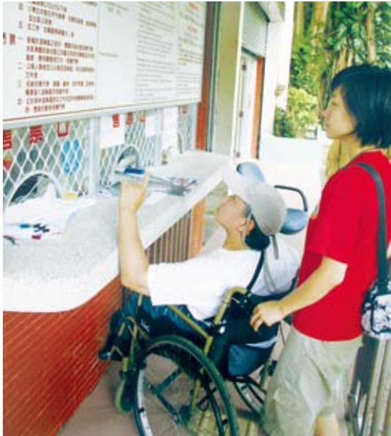
6.售票口或櫃檯：櫃檯過高難以親近。