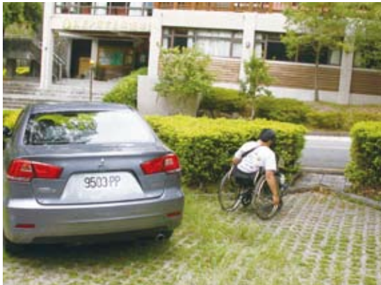
7.停車位：未劃設或下車區鋪面不利通行。