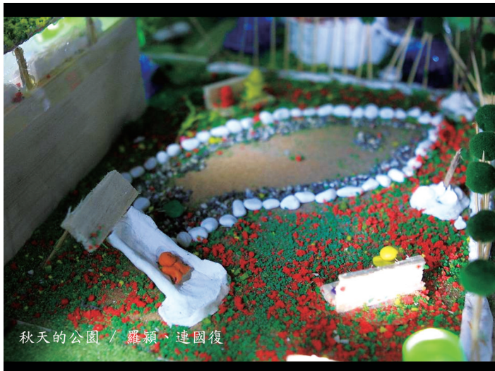
秋天的公園 / 羅穎、連國復

師生同樣面臨身體的自由與節制之間的衝突與平衡。課程係「框架」，將身體在不同時間內擺到適當位置，所以有了國語、英文、體育……；課程係「遊戲」在擺上與解開框架間，創造身體的張力。在自由與自制之間，「遊戲」場域持續衍生意義，引導學習者反觀自身，如學生的作品「秋天的公園」裡，演繹出活出自由的心靈場域。