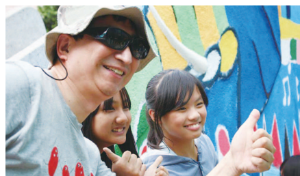
葛老師也和小朋友一起共同彩繪