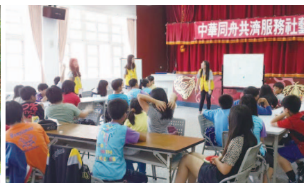
瑞濱藝文週末班上課情形