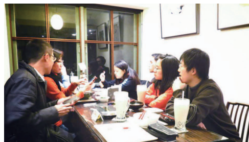
指導業師和部落居民

如果我們繼續冷漠對文化的重視，再不站出來做點什麼的話，這塊滋養我們長大的土地，很快地會像記憶一樣，隨著時間逐漸凋零。