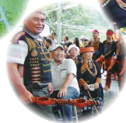
部落收穫祭時耆老們圍坐在舞圈中央，開心的看著青年及孩童們傳唱、舞蹈著古謠