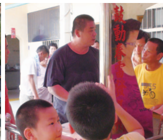
鼓動山城培訓「阿寶師鼓陣教學」