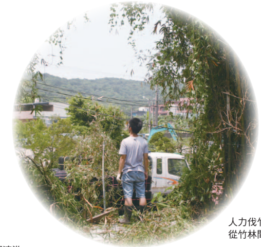
人力伐竹，終於可以從竹林間向外遠望