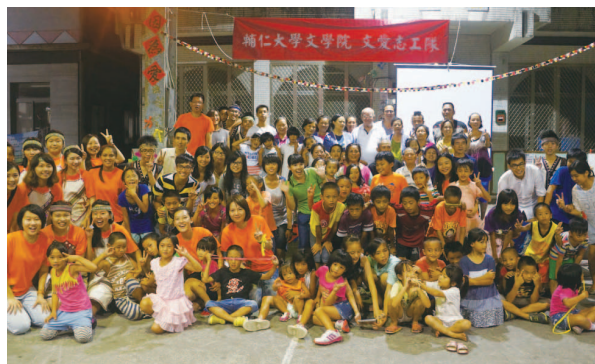
隊員和居民、小朋友大合照