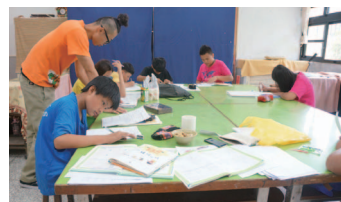
今年暑假增開六年級畢業班上課狀況