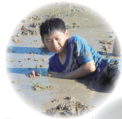
讓兒童透過活動親近鄉土