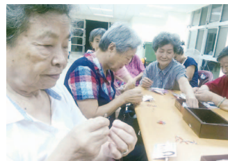
手工藝課程—國旗串珠

本次「戀眷村-光榮四海青年返航」計畫，主要是針對老、中、青三代推動一系列衛教課程、手工藝課程、照顧長輩不可不知系列講座及健康運動帶動課程等，讓老長輩們能從中重拾自信，也讓眷民二代學習到我們應正視家中長輩有一天也會年老，且將成為弱勢一群，面對高齡化社會的我們該如何照顧長輩們？而在青年團隊的帶領下，本次計畫在 11 月 30 日結合了社區里辦公室、社區大樓管委會、財團法人弘道老人基金會、大仁科技大學等結盟，共同辦理「戀眷村-光榮四海青年返航暨聯合成果展」，捲動當地居民、青年們共同參與、關懷在地議題。也藉此活動結合了財團法人弘道老人基金會建立區域聯盟體系相互支援，擴大青年行動的影響力，將此資源永續發展。