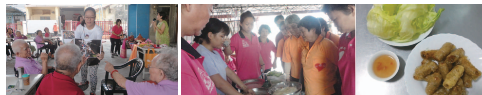
移民二代青年加入社區服務

本計畫實際執行效益已超越預期效益 360%。原本預期參與人數約 300-500 人，但實際參與人數已高達 1800 人。由此可知，在執行過程中團隊每人所被賦與的任務，團員們都非常努力及用心去完成，因此得到社區民眾的肯定及信用，所以每場活動民眾都踴躍參與。但最重要的是在執行期間我們捲動培訓了 12 位社區的新移民青年，加入我們的團隊，她們來自不同的國家，但她們有著和我們共同的目標，就是希望大家多認識她們母國文化、瞭解她們原母國生活習慣、並且得到大家尊重與認同。透過團員的分享使得社區長者更加瞭解越南、印尼、泰國、菲律賓、香港的文化，促進他們（社區民眾及青年）彼此互動及拉近距離，鬆動社區民眾對於新移民之刻板印象，藉以讓社區大眾也看見體認到青年熱心參與服務社會的一面，特別是 12 位青年新移民其中有 2 位是移民二代，雖然還在學，但他們利用暑假期間也很積極的參與社區服務，也成為一股新移民之子的「新」力量。