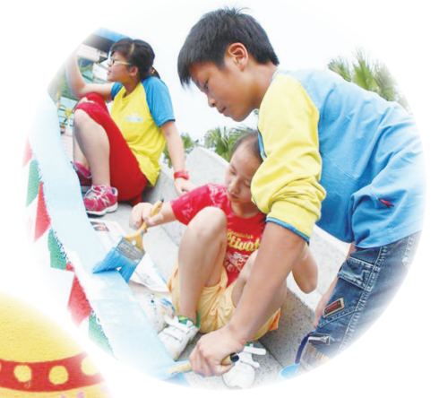
小朋友爬到大象身上彩繪象鼻