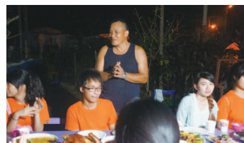
學生家長陸爸爸親自下廚感謝文愛於平日課輔的努力

因為兩年多來的持續深耕，當地居民、學校看見我們的努力後，也願意提供各種資源，今年有所改變的是：學生家長親自下廚製作美味的泰雅風味餐以感謝大家對於課輔的努力，共享歡樂時光。當地居民和文愛指導老師計畫一起成立部落發展協會、希望能帶動當地產業。而青年會除了以往教導文愛隊員傳統泰雅舞、共同籌備晚會以外，於暑假更加倍投入課輔努力回饋自身社區，這些都是之前所累積的成果。寒溪國小也指定文愛為未來唯一合作夥伴，和國華國中一同支持成立畢業生銜接課程班；寒暑假課輔時老師會分享教學經驗、給予指導。寒溪的居民不只一次稱讚文愛是上主派來的天使，帶動整體社區；而這一切鼓勵和支持都是給予我們肯定，目前正在興建四方林課輔中心，期望落成後能將課輔行動更深入推廣，幫助更多的孩童。