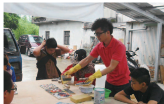
結合團隊青年專長設計創意課程