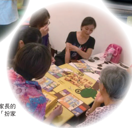
除了孩子，我們更期待家長的加入。圖為家長們參與「扮家家遊」活動