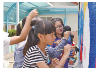
六年級學童細心用小筆勾勒線條

頂著豔陽，吹著海風，憑著一股衝勁與熱情，我們立下志願要在瑞濱國小及社區深耕十年。希望用最簡單的方式告訴孩子：任何事情都有改變的可能。以一枝筆刷、一桶油漆，為校園內的大象換上新衣，是我們美麗的開端。彩繪大象就像一場華麗的冒險，繽紛的色彩承載著孩子的希望和童年的記憶。海豚跳躍海面、彩虹掛滿天空、山巒綿延盡頭，美好的事物氤氳於孩子心中。這裡的孩子因家庭環境和社區困境，更需要給予溫暖。我們用藝術擁抱孩子，而他們的笑臉與回應，也同時填補了我們心靈的空缺。「學校變得好亮，充滿了生氣」，這是畢業學長姊給予我們的肯定。即使這趟改變與希望的旅程，才剛剛啟程，但我們深信這股正向力會逐漸擴散，扎根學童的心中，慢慢滋長。