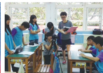
瑞濱國小教室拍攝大象短片實況