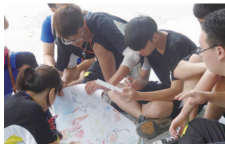
師生一同製作大溪印象地圖