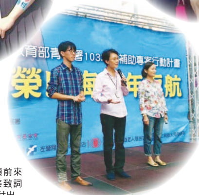
立法委員黃昭順前來戀眷村成果發表致詞肯定青年團隊的付出