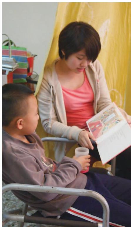
陪著孩子，一同探索故事的魔力世界！

光復小小生活共學平臺是讓孩子在自然裡生活學習，例如暑期營隊、「晴耕雨讀」的項目，接地氣的鄉村耕作，讓孩子在不同的景觀發現萬物的變化，雖然短短的五天，能發現孩子的創意與活力是無窮的。希望這樣的學習過程，能讓孩子產生自我與自信，培養未來的能力，走出人生的康莊大道，進而對社會有貢獻。