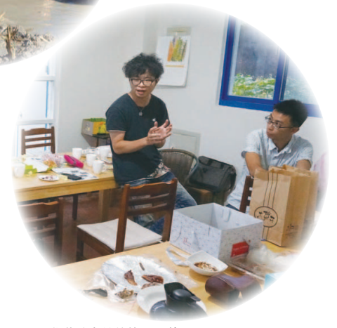
啟動計畫前的能量累積