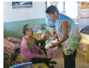
青葉部落青年訪視獨居長輩