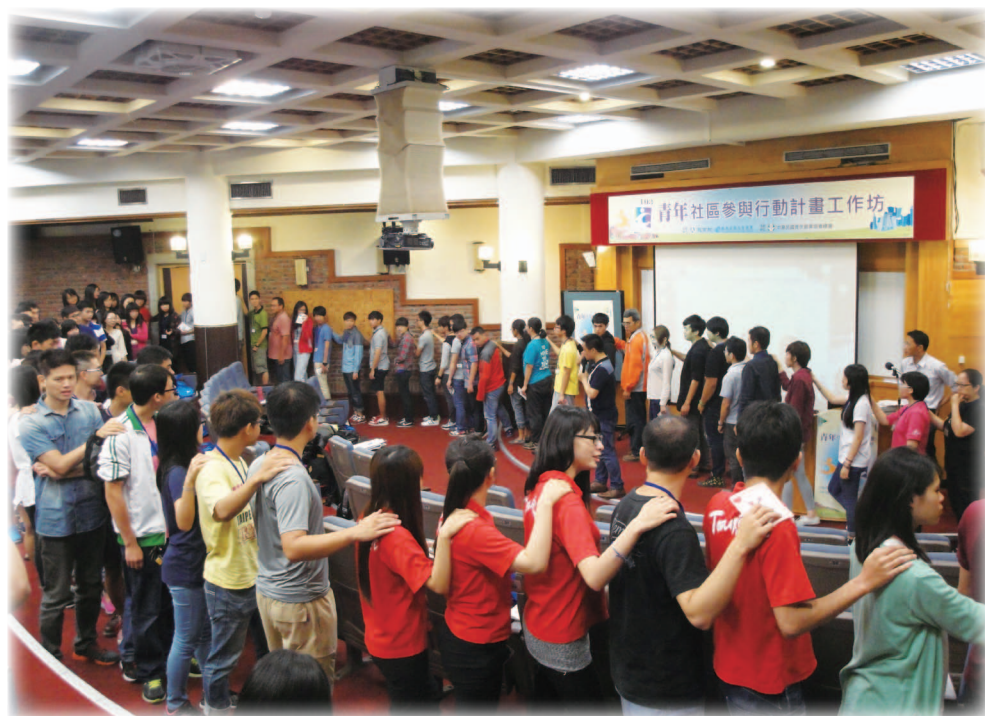
103年5月24日培力工作坊團體互動與破冰