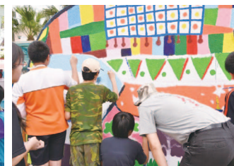
小朋友和老師大夥一起畫大象身體