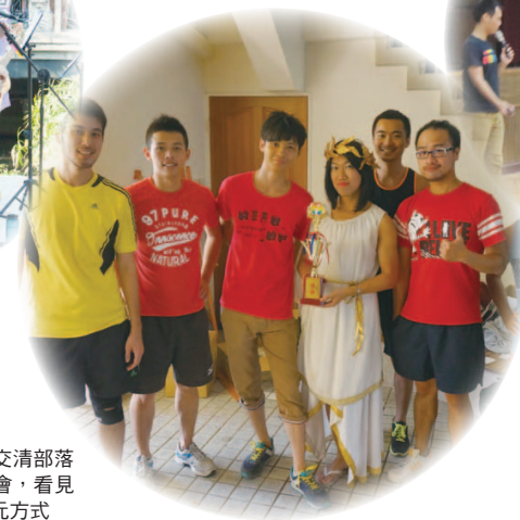
與校園同志社團交清部落革共同舉辦運動會，看見與社團合作的多元方式