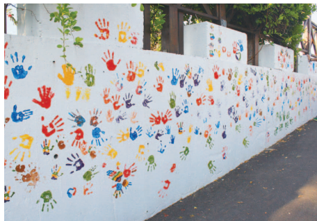
居民共同彩繪蓋手印