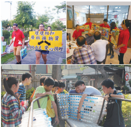
成員們沿街宣傳和社區民眾互動

在臺灣的源頭「安平」，我遇見了冷漠、挫折與無奈，也遇見了溫暖、熱忱與創意。過往與現今、殘酷與熱血、冷清與熱鬧，不斷地交織在整個青年行動計畫之中。從提案時，被委員問及：「你們沒有任何在地人，如何進行計畫？」即埋下震撼彈，而在第一場活動就爆炸了：沒有任何里民前往參加！被動的宣傳張貼方式，果然不適合這個社區。但不畏挫折的小螺絲們，轉個彎，馬上有熱血的作為，也是為師的想不到的作為：居然，製作活動看板，拿著大聲公，沿街叫賣宣傳、挨家挨戶地發送海報、熱情邀請里民，厚著臉皮、頂著大太陽、不分晝夜，把石門社區踏過一次又一次。悄悄跟在大家背後的我，非常的感動與敬佩，感動大家可以在面對問題時，馬上轉換心情，找出解決的方法；敬佩大家有說做就做的能力與相互扶持的信念。孩子們，透過這個行動計畫，我想我們得到的比付出的事物來得多更多，我們得到了居民的喜愛與笑容、得到了在問題中尋找解決的管道與態度、得到了在喜悅成功中共同分享的樂趣、得到了從冷漠無情中如何激發與誘導熱情的體驗與領悟、得到了安平舊運河與石門里的記憶與認同…，許許多多的事物，不是用文字可以一一描述出來的，但是，我想我們在日後，回頭看這一年的時光，我們應該會有彼此存在的回憶，追尋產生「安平常心」的歷程、以及那一份屬於「安平常心」的存在。