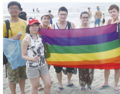
透過淨灘活動讓青年志工尊重生長的土地

持續招募桃竹苗在地青年同志志工，課程除了多元性別教育、疾病防治宣導外，透過案例模擬讓志工演練生活中會遭遇的歧視問題，並鼓勵思考要以何種方式在社區內推動多元性別教育。營隊結束後帶領青年志工實際參與各地的多元性別活動。接著與桃竹苗地區大學同志社團交流，協助辦理校園內多元性別文化活動，連結校園同志社團的力量，讓多元性別教育於校園內持續捲動。而在走出原生社區、橫向拓展的方面，透過能凝聚共同記憶的社區性活動來讓民眾看見多元性別族群的存在，加深社區居民對彼此的熟悉與土地認同感。我們延續「臺灣彩虹文化祭」的成功模型轉移至桃園舉辦，於9月27日在桃園多功能藝文園區廣場舉辦了桃園地區首次的多元性別主題大型活動。