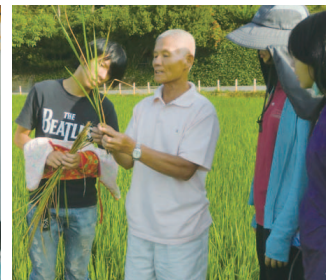
農民教導青年種稻的知識