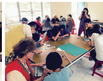
部落居民一起製作立體地圖