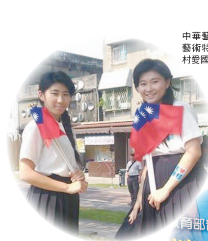
中華藝校同學在駁二藝術特區舉辦閃眷村愛國活動

回想當初申請本次社區行動參與計畫，選定眷村的初衷。其一是因為我是眷村的小孩，其二是因為我 2009 年因緣際會到了泰國北部看見了一群人，克勤克儉、努力不懈、精誠團結，就是為了傳承中華文化，他們愛國、更愛青天白日旗。在臺灣我曾經居住的地方也有一群人跟他們一樣，許多為國家賣命的軍人子弟及眷屬也跟著國民政府撤退來臺。眷村是臺灣特有文化，住在眷村裡的長輩是我們的重要資產，沒有他們當初保家衛國，不會造就現在的繁榮的社會。如今他們多數年事已高，身體早不如從前，加上在近年的眷村改建政策下，許多的眷村已拆除改建、走入歷史，眷村居民在軍方的安排下，集體住進高聳的國宅大樓，生活形態由平面轉變為立體的，舊有的人際關係也逐漸疏離，面臨前所未有的巨大衝擊。本次的計畫「陪伴」是我們的主軸，營造「精誠團結」是我們的目標。四個月的活動中，舉辦了許多活動，從爺爺奶奶的笑容裡看到他們活到老學到老的精神、看到他們永不放棄樂天的性格，尤其是那愛國情操，更是現在我們最缺乏的。我們學到了一個人的力量很小、一個團隊的力量也不大，若是能傳遞善的信念，保持正向思考，立定目標與志向，能為他人、土地、國家、世界多做一點，再多做一點。