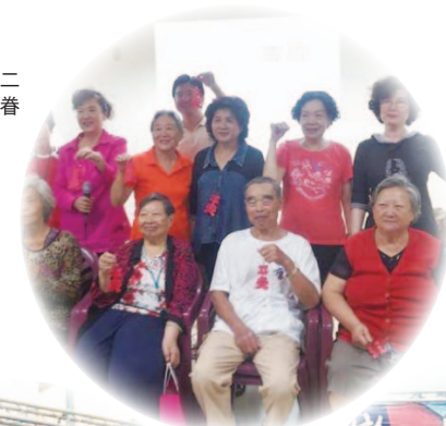
手工藝製作平安吊飾合影