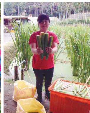
茭白筍取得綠保標章及有機認證