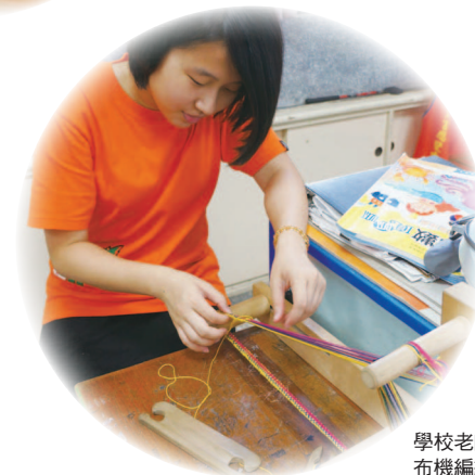
學校老師教導隊員使用織布機編織傳統泰雅頭帶