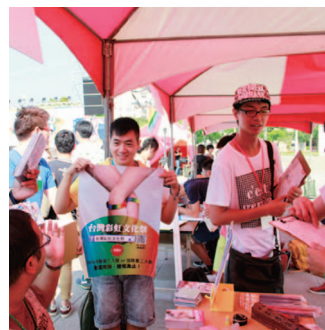
臺灣彩虹文化祭透過園遊會讓社區民眾直接接觸多元性別團體