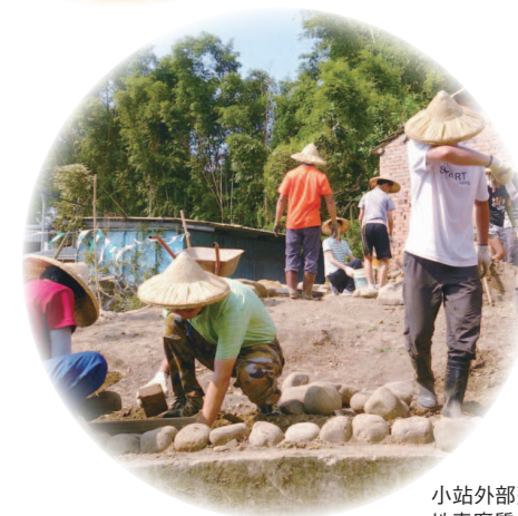
小站外部整地鋪平，蒐集地表腐質土和灰燼做肥料