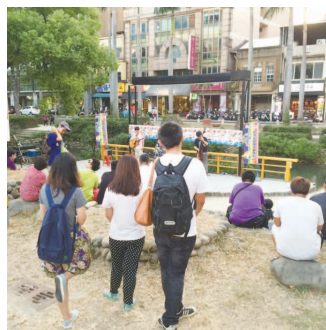
多元成家義唱行動用歌聲來傳遞對婚姻平權的支持

能參與志工行動，一切都是為了成長、練習照顧自己，為了異同公平和大家一同努力！因為不一樣，才能得到更高的眼界，所以我們選擇站出來改變社會、讓大家看見多元，為自己的青春鑲金。