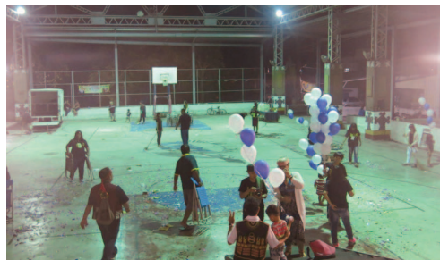
演唱會後大家齊力整理