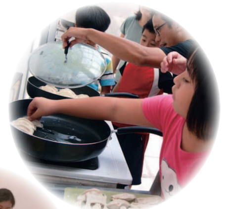
廚房成為孩子玩樂與工作的天堂，同時體認「食」的重要