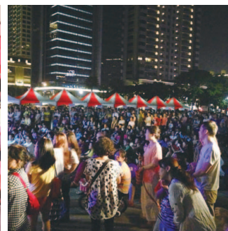
桃園地區的民眾能透過臺灣彩虹文化祭，接觸最真實的多元性別族群文化