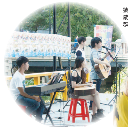
號召在地表演團體，用歌聲來感動民眾，讓大家聽見多元族群的聲音

每一個新的成果，都讓我們獲得滿滿的感謝與讚賞，因為這些鼓勵的聲音，讓我們感受到溫暖也更堅定要持續努力的心。