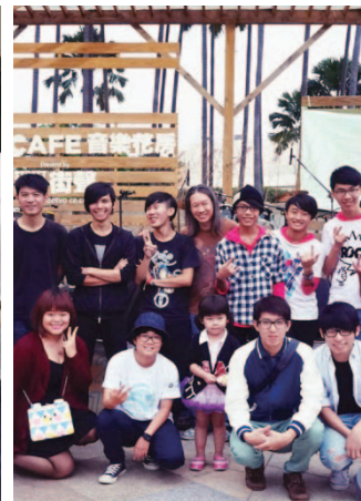
社企之歌成果音樂會大合照