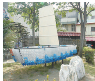
寶特瓶船裝置藝術