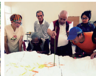
部落耆老指出地圖位置