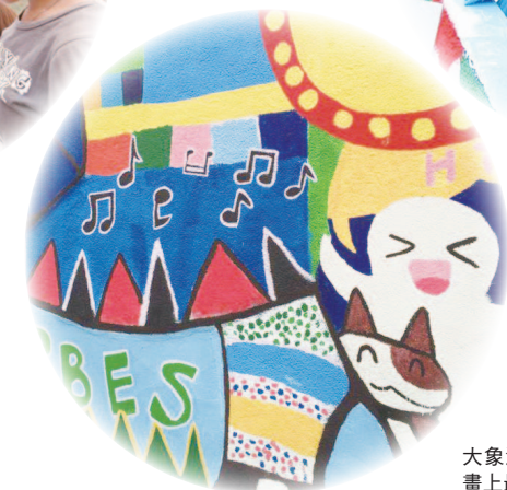
大象溜滑梯完成圖，小朋友畫上最喜歡的卡通圖案