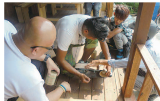
與地方組織合作規劃對地方學生的技藝學習與傳承

本團隊主軸在凝聚家鄉青年以課餘或業餘的時間，一同對家鄉文化的挖掘以及創意活動的腦力激盪。我們的特色在於成員的多元，有大學生、有老師、有創業家、也有公務員，共同的是我們有相同熱愛家鄉的心，經過這六個月一系列教育活動的執行，最有意義的是：一、地方產業創新能量：藉課程培力與創意激發，提升在地人力資本，並透過行銷空間的建置，轉為地方產業轉型之能量來源。二、在地人力資本的累積：透過捲動更多的在地青年，如提升青年大學生活動執行力與成就感，並透過容易參與的教育活動來傳承地方經驗。三、地方社會資源的串聯：與在地協會、學校或組織合作（計七個單位），透過教育活動所傳之正面回饋，促進長期合作的可能。感謝青年署對於本計畫的經費贊助與指導，讓我們有一個清楚的計畫向地方提案執行，並且有許多的回饋，擁有一個好的開始。