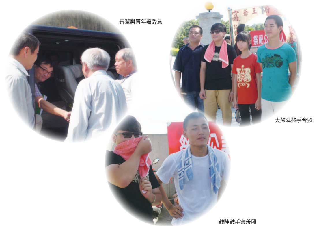
長輩與青年署委員

在計畫過程中除了認識了一位熱心的副校長，也認識了許多在過去曾見面卻不熟的老長輩，有這些師長及老長輩的支持，讓計畫的執行變的很順利，比如說我們原本所擔心的人次問題，在計畫執行期程到了中段，我們發現有不少參與者不斷的加入，表面上看起來好像是為了參與活動而來，但事實上在執行整個計畫過程，讓我覺得好像是這群人為了讓我的計畫更熱鬧更豐富，所以不約而同的加入我們所舉行的活動，看見這些鄉親父老及親朋好友這麼的支持我們的計畫，間接讓我們體會到所謂的「團結的客家族群」，讓我們很是感謝。整個過程從一開始的不確定一直走到柳暗花明，最後將計畫執行成功，都要歸功於大家的支持，除了感謝指導單位，也感謝這群協助本計畫執行成功的大家。