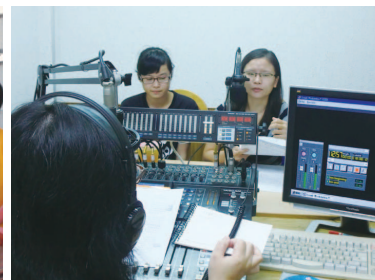
於建國電台受訪宣傳古山城風華再現活動