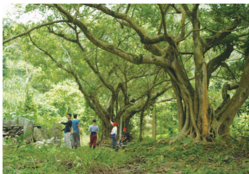
我們的文化就跟我們的人口一樣，是開枝散葉、遠遠流傳、互古不變的