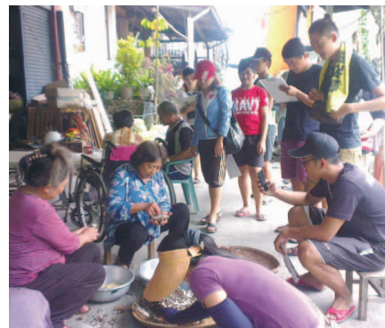
行腳部落，探訪家名拜訪族人，繪製部落地圖

今年四月底時，我們首次前往來義，跟部落內一位傳唱古謠的 vuvuSa' enge 學了第一首歌 atapitjusailijng；在傳唱與轉述的過程裡，vuvu 的思緒與目光已不在我們所處的當下，歌謠將她拉回遙遠…她在舊部落家裡的的味道，與情人夜晚濃濃的情愫。她右手托著腮手指不斷地在下眼瞼處摩擦，我沒多留意這舉動，vuvu 是性情中人，她是想抑制自己的眼淚，但情緒滿溢還是悄悄流了下來。她說她很想念，想念舊部落、想念父母親、想念自己的童年、也想念自己的舊情人。年輕人很難想像到底是有怎樣的感覺，讓他們輕易的就神遊在自己的想念裡！排灣族的神話與歌謠有內隱的抑鬱，但不是憂鬱…是一種愁思，對人、對事、乃至大自然。他們似乎不太著迷於歷久不衰的美，一閃即逝的永恆…常存在他們心裡，他們說這樣的美是 samiling！是超越美這樣世俗的字眼，是神話傳說裡才會出現的奇觀！我們一句一句的溯著歌謠，希望能順著煙…慢慢走進歌謠的生命裡。然後，感謝祖靈。我們的成果刊物真的出來了。這是最最困難的一件事…除了讓我們感到緊張更是興奮。耆老們的文化記憶太溫暖、太豐厚了，不該只是留在我們後代哀嘆的愁思之中。那樣太浪費了。