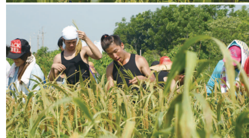
青年們偕同耆老一同參與部落的小米收割工作