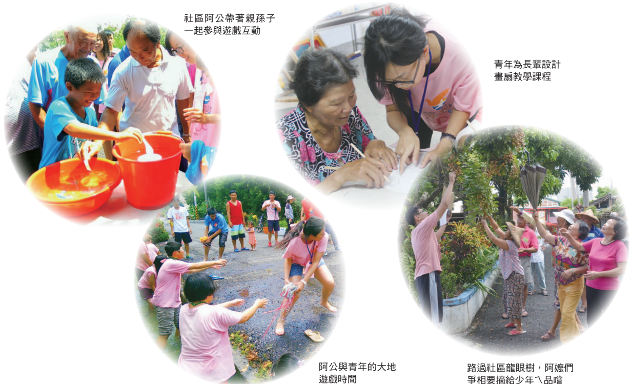
社區阿公帶著親孫子一起參與遊戲互動

身為一個活動的工作人員，有太多的感謝和回憶來不及重複思考，但這一切早已散落在咬仔竹的每一條巷中。來自故鄉的青年，用訪問和書寫，在對話中，嘗試拼湊出屬於上一個世代的生活，也體會早已遠去困苦記憶。五天的營隊，難比上每個經歷半世紀的酸甜苦辣，十二個傳家寶故事，復刻屬於咬在竹的在地故事，卻略顯得渺小。在這五天的生活中，跟咬仔竹的阿公阿嬤彼此教學。你畫扇子我上色，牽著阿嬤的手做功課；陪阿公阿嬤聊天，有獨特的人生課題學習；坐在路燈腳，阿公的囑咐是有閒來坐。當我們同在一起，電影總鋪師的主角都成配角，因為我們早已是彼此短暫回憶中的主角。有阿公阿嬤活到老學到老的精神撐著我們五天一起成長，疲憊頓時停歇。猶記得最後一天帶阿嬤去咬仔竹吃午餐，她端著米糕，與其他阿嬤夾同一碗菜。情景彷彿國小同學會一樣，分享同一個世紀下不同時空但卻同樣努力的自我，抱著屬於他們的時光膠囊，話不間歇，也熱心地介紹咬仔竹。看著併排上已畢業六十年的國小生，此刻當下，覺得自己五天的努力都是為了這一刻到來，特別有微笑和美食相伴。咬仔竹社區的美好生活，是每一位遊客遠道而來的風景，特別在那些當我們同在一起的日子。