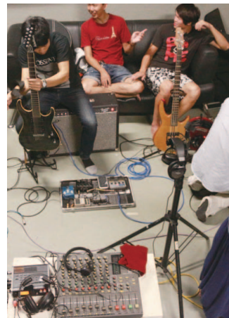
元美多影音公司協助錄音