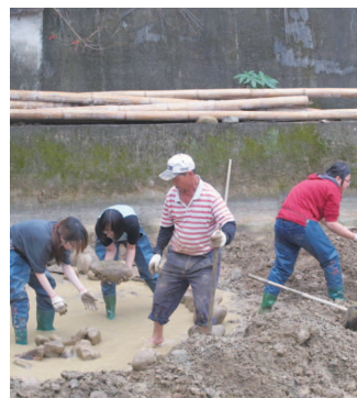
透過遊程帶領青年學子進入社區