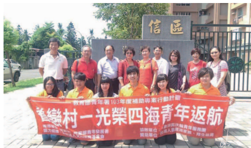
業師南下指導青年團隊參加委員訪視簡報

一個人的力量很小、一個團隊的力量也不大，若是能傳遞善的信念，保持正向思考，立定目標與志向，能為他人、土地、國家、世界多做一點，再多做一點。