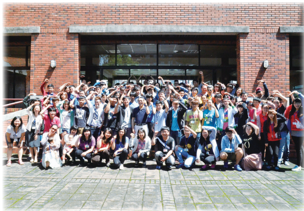
103年5月24日培力工作坊羅清水署長與青年團隊大合照