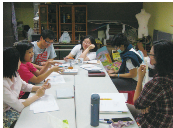
團員與業師討論活動方式