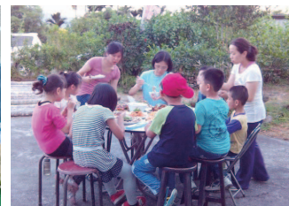
圍著圓桌共食，象徵活動的圓滿，亦代表陪伴彼此的概念