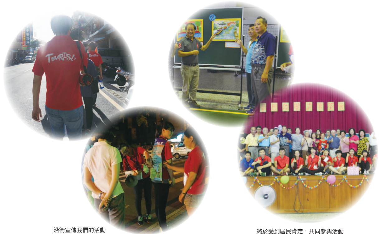
沿街宣傳我們的活動

做完這次的社區營造，讓我們團隊最感動的事—被石門社區接納。「陌生、努力、看見、相信」是我們在石門里的這段時間所經歷到的。一開始，我們懷抱著滿腔熱血來到安平石門里，我們擁有滿腹的想法，想一一呈現在這充滿文化歷史，卻被遺忘的石門里。但是，我們沒有安平人，我們是一群外地人，沒有人相信我們真的做得到。我們像是從天堂跌到谷底，但是我們卻沒有因此而打退堂鼓，我們開始另尋方法，早上頂著大太陽開始沿街宣傳，有一個熱血團隊「進擊小螺絲」來到了安平石門里。跟大家宣傳我們的第一個活動，並發放宣傳單。原先我們以為這樣就可以了，大家就會來了，但事情往往不會朝我們所想去發展，我們耐心期盼，但是最後還是沒有人。我們決定晚上也來做宣傳，往後，從下午約一、兩點開始沿街宣傳，吃個飯休息一下後，便繼續宣傳。漸漸我們的努力被里民看見，里民們也慢慢地相信我們做得到，並給予最大的支持。曾經有里民跟我們說：「你們好像瘋子，這種沒薪水又耗時間的事情你們怎麼會做，每天這樣來來回回你們不累嗎？」我們也謝謝有人這樣跟我們說：「你們雖沒有安平人，但有一顆安平心、作安平事。」我們自己也覺得像瘋子每天騎來回一小時的路程，但是我們的努力能讓大家看到，之前的辛苦都值得了。