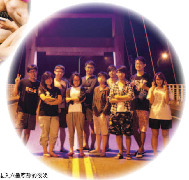
與青年走入六龜寧靜的夜晚