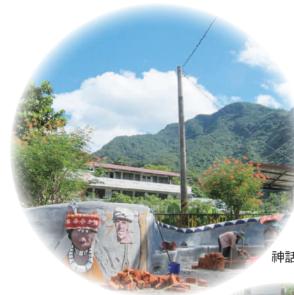
神話故事牆建設中