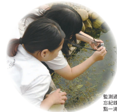
監測過程中時時不忘紀錄生態池的一點一滴