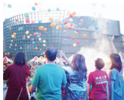
多元性別議題於桃園地區做首次對話