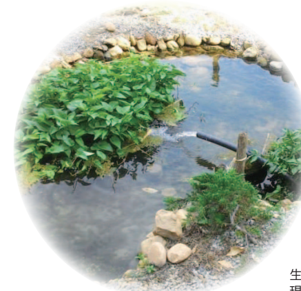
生態池從一片黃土到現在一片綠意盎然