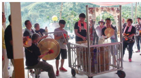
中秋節小型鼓陣發表會

曾幾何時，認為這些式微的文化與我們無關，也沒辦法做些什麼，感覺實在離太遠。但是遠，是因為覺得自己的綿薄之力不會促使任何改變，總覺得會有人去解決，我插不上手，或許我們不該這麼想，或許我們可以做些什麼？