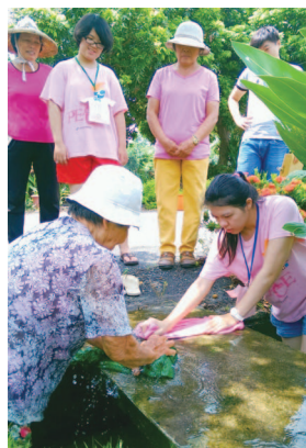
由阿嬤示範教導圳溝邊洗衣

一路看著行動計畫的執行，感觸良多，第一次執行行動計畫的青年們，依舊參與中，從原本只是懵懂聽令的青年，到現在已經可以帶領學弟妹們一同完成所有的計畫，不論是發想、規劃或執行，都井然有序。相對以往而言，本次行動更著重於銀髮族的生活故事，讓青年藉由採訪的方式陪著阿公阿嬤一同走過他們幾十年來生活的痕跡，也讓青年在阿公阿嬤身上挖寶，學習他們多年累積的生活智慧。當然，阿公阿嬤們傳統好手藝的學習，也一定不能錯過，因此透過本次活動的執行，有了幾點感悟：一、青年透過陪同阿公阿嬤一起回憶他們的生活經驗及故事，可以慢慢累積生活經驗，也能從中獲得積極正向的人生態度。二、學習阿公阿嬤的傳統好手藝，一個一個步驟都不能落下，否則味道就失真了。青年們透過這樣的學習過程，不僅學到了好吃食物的製作方法，也讓青年學到不能投機取巧，否則就會功虧一簣，就像做好吃的美食一樣，任何一個步驟都不能落下。三、阿公阿嬤們透過傳統好手藝的教學，不僅可以讓手藝不失傳，也讓他們在教學的過程中獲得自信，並且享受天倫之樂。四、看到了阿公阿嬤們如此認真的生活，青年們努力的美麗身影，不禁思考著：我們是否也像阿公阿嬤們一樣，認真的生活？是否也樣這些青年們一樣，不斷地在努力學習？透過這次的活動，看到了青年們大幅度的成長，相信未來你們一定更不可限量。