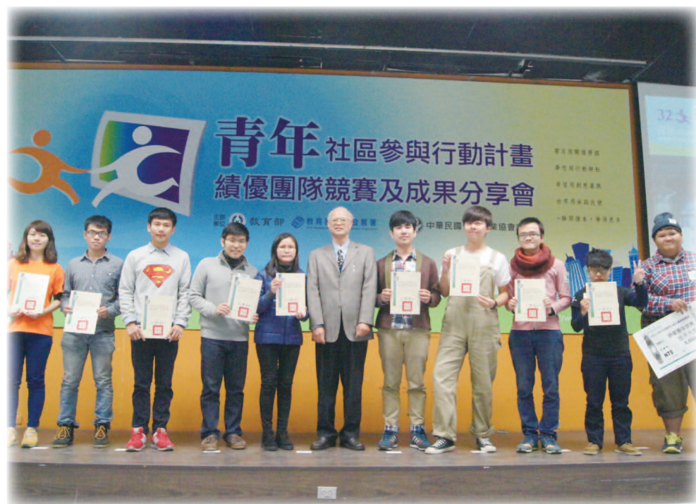
103年12月13日績優團隊競賽與成果分享會施建轟副署長與入圍團隊代表合照

藉由臺灣莛白筍推廣協會及南投縣埔里鎮一新社區發展協會與在地大學—國立暨南國際大學學生組成的團隊，共同進行社區相關資源調查、建立生態復育池、培訓在地導覽員、舉辦多場社區工作坊、邀請青年參與生態遊程與體驗農事活動等執行方案，冀望能提升社區居民對於生態的重視並維繫居民間的情感，建立屬於在地居民的共同回憶，並且成功復育臺灣白魚，進而與當地有機產業結合，農民申請相關有機認證與標章，例如：綠保田、慈心有機認證，為當地莛白筍的品質與價值更為加分，而消費者也將更為的安心食用此地出產的莛白筍。最後希望透過本計畫讓青年學子能實際參與社區事務及對地方產生認同感，進一步省思自身對原生社區的連結，藉此鼓勵青年回鄉貢獻己力。