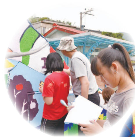
小朋友彩繪過程中不時對照草圖，確認色彩分布

平常頑皮的小朋友們，積極的拿起筆刷畫下生活趣事，彩繪時勤奮的詢問要求工作。因大象表面是小碎石，無法大筆大筆的刷，孩子必須一點一點的塗，才會呈現飽滿的色澤，常常畫完一個小區域，手就會很痠。而大學生即使揮汗如雨，拿著刷子教學，被小朋友牽著到處跑，衣服和臉都畫髒了，卻不畏艱難，共同完成了夢想大象。瑞濱校園是我們扎根社區的地方，承諾十年的耕耘，現已邁入第四年。故事不過才剛開始而已，以後我們的每段回憶，都會有這隻美麗的大象相伴。