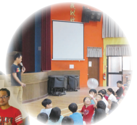
前往小學進行多元性別教育宣導