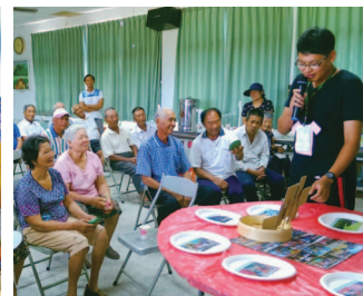
12 件傳家寶作品的成果