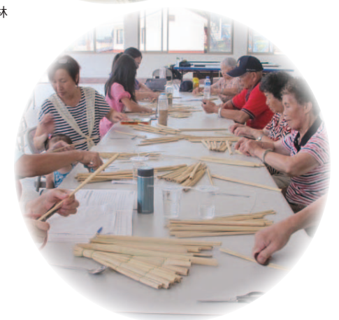
社區居民熱情參與 DIY 惜福扇的課程