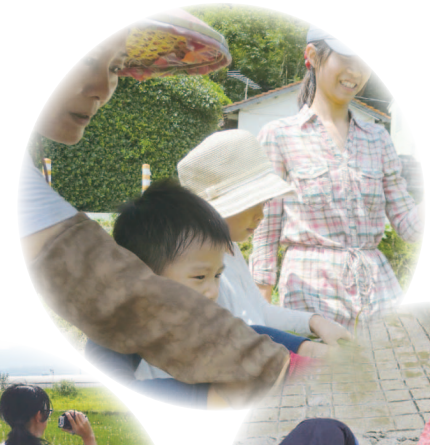
和在地孩童一起下田