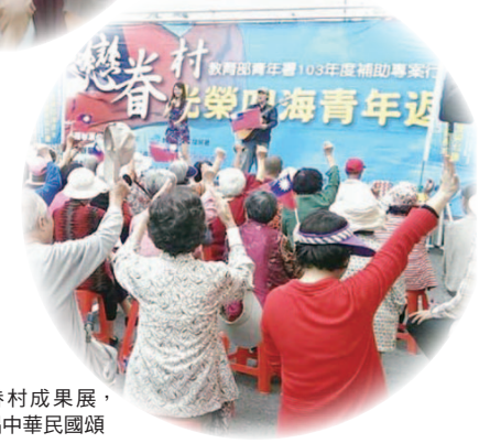
戀眷村成果展，高唱中華民國頌