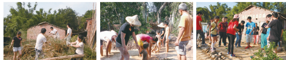
綠第景觀公司協助將外圍竹林的竹頭掘起後，整體範圍愈來愈明朗囉！ 以牛踏層的作法在泥水中踩踏，夯實土壤除縫！ 青年團隊辦理四健逐夢分享會

「社區文化驛站」的初登場，是在光輝的十月，一場由青年團隊籌辦的楓樹村單車行活動，期間由業師及在地青年介紹楓樹村的歷史文化及驛站的緣起與願景，並邀請參與者共同彩繪石頭，妝點驛站的夢想平臺。透過參與者給予回饋，我們獲得許多寶貴建議，以及持續前進的動力。