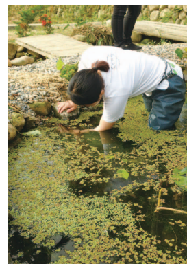
生態池完工後進行白魚監測

在社區內建造第一個白魚生態池，並成功復育臺灣特利物種「臺灣白魚」，在生態池完工後也進行監測，了解臺灣白魚的復育情形。此舉也吸引其他居民的效仿，目前社區內有兩處開始規劃興建生態池，透過自身動手建造生態池，讓每一位參與者更了解保護生態的重要性，我們也透過遊程的串聯及媒體的報導，讓更多人知道一新社區目前正在為復育臺灣白魚而努力，一新社區的農作物也因為復育臺灣白魚取得綠色保育標章、有機產品認證，不僅提升農作物的經濟價值，也能和大自然和諧共處。