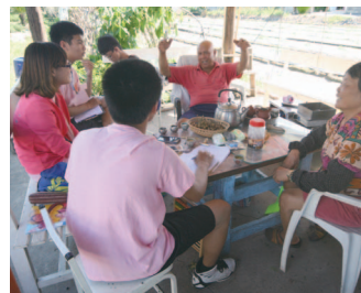
社區重要傳家寶「12 則」採訪紀錄

八月豔陽天，湛藍的天空映著微笑大道的綠樹、夏日的微風拂著三角公園的草地、屹立不搖的屋中樹伴著阿公阿嬤的談笑聲，2014 年的夏天，我們認識了擁有龍眼般甜蜜滋味的微笑社區—咬仔竹。此次計畫，有一項重要的任務：採訪咬仔竹社區的村落傳家寶。藉由這次的採訪，我們得到了寶貴的經驗，成長了不少。對我們來說，這並不是一場嚴肅又繃緊神經的採訪，反而就像在和自己的阿公阿嬤聊天般的輕鬆愉悅，使得我們更熟悉我們的家鄉，也更了解了她鮮為人知的在地故事。這時，我才發現：沒有任何東西比得上咬仔竹的美麗傳家寶—純真直率的人們及獨一無二的社區故事。活動相處中，處處可見阿公阿嬤的可愛以及他們對社區的真摯情感。阿公阿嬤們也視我們如自己的孫子般疼惜，雖說是陪伴他們，但實際上我們獲得的照顧及吸收的成長，比想像中的多更多。