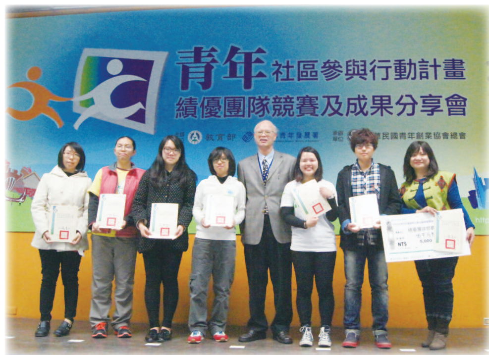
103年12月13日績優團隊競賽與成果分享會施建轟副署長與入圍團隊代表合照