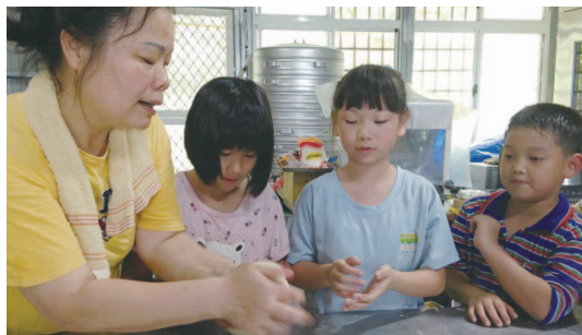
業師卓綉蓮女士教導孩子們製作西式點心