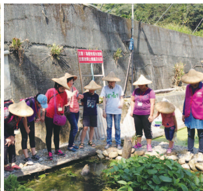
讓更多人知道一新社區為復育白魚付出的努力