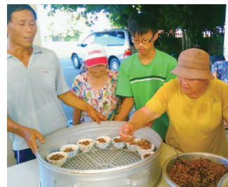
青年和阿嬤一起來學做糰