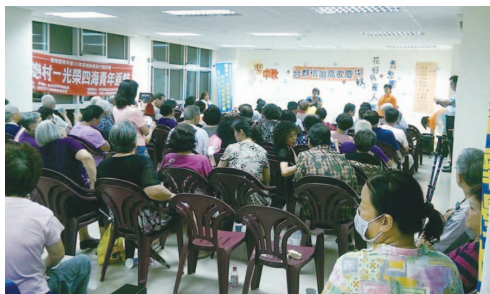
中秋節辦理晚會吸引合群新城的眷民參與