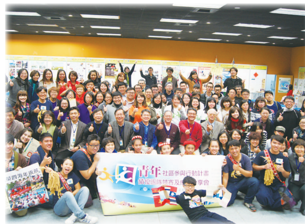
103年12月13日績優團隊競賽與成果分享會大合照