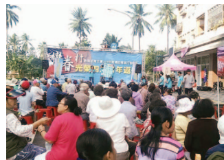
戀眷村—光榮四海青年返航暨聯合成果展