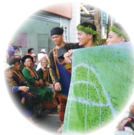
傳習班每天行腳部落，手繪出具部落情感，與土地溫度的部落地圖

大學畢業後，在自己的專業領域工作了一段時間；也許是因為大學所學，在學習表演的過程中，老師不斷的提醒我們認識自己的重要性，而我也漸漸察覺到自己對於原住民身份的排斥。在一次的機會，找到是劇場相關工作，又是跟原住民文化相關，毅然決然就接下了工作來到花蓮。之後就一直待在花蓮從事劇場工作，同時學習自己及其他原住民族群的文化。在來義曲文化傳習班的這段期間，一開始並不是很順利，參加的青年們雖然很多，但似乎都不太主動，歌唱不大聲、舞也跳不起勁，課程時間，也有時候來，有時候沒來。而我就我自身的經驗，我知道也許文化認同，每個人有個人的時間，我們的迫切，對這些青年來說，也許是一種干擾。但在一次跟部落同樣也參與工作坊的部落姐姐們聊天之後才發現，這些有些是她們孩子的弟弟妹妹們，在家的時候，已經開始喜歡聽、喜歡唱那些我們所教的歌，唱的這些姐姐都有點煩了，甚至還急著想學那些我們還沒教的歌。原來工作坊時的不主動，只是一種害羞表現。在部落收穫節的那一天，我們讓這些弟弟妹妹小朋友們，在老人家面前表演所學的歌曲。看到他們大聲驕傲唱著自己的歌，我高興的同時，也提醒自己，他們追上我了，他們已經會唱自己部落的歌了，而我還在唱別人族群、別人部落的歌，我也要加油，回自己的部落，學自己部落的歌。