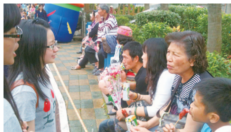
大學生在運動會時訪問居民