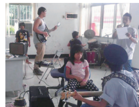
青葉部落音樂班練習

本計畫是部落有史以來由青年朋友自行來籌備以及執行的計畫，計畫分為社區服務以及音樂品格兩部分，在社區服務部分，我們捲動超過 80 人次的青年朋友參與，藉由關懷行動重新認識部落也重新塑造部落年輕人敬重長輩的心，能夠學習謙卑及熱心服務，重新找回部落傳統的美德，發揮部落青年在部落真正的使命及責任「敬重長輩、服務社區、傳承文化」；而在音樂品格部分，透過部落音樂專才青年的無私教導，使部落青少年有機會可以學習才藝，至於品格部分，我們與教會做連結，透過教會的幫助，讓青少年重新認識自己，找回生命的價值。在舉辦原夢演唱會時，原以為人數無法到達我們的預期 200 人，但是活動執行當天光是簽到人數就有 350 人，但透過現場算人數的工作人員表示真正參與活動的人數破 400 人，其中有許多是外村的朋友，這表是團隊的宣傳效果是不錯的，在活動結束時大家一起將場地收拾乾淨，很多長輩都跟我說他們很感動，看見這麼多年輕人一起來參與活動協助社區，真得看見部落正在改變，也盼望明年還有機會繼續為部落來付出，看見部落青年總動員，一起為部落加油！