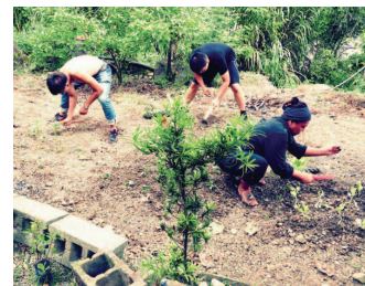
和部落族人一起農事勞動

我們團隊以參與式立體製圖法，作為製作立體部落地圖的方式，其所強調的不僅是技術，更應該注意部落族人與青年團隊間互信關係的建立。團隊成員除了將製作立體部落地圖的知識製成手冊，留在部落，也持續訪談部落耆老的傳統知識，請其他族人把這些祖語影音資料口譯成中文，而團隊也將把這些成果文字化留給部落，希望部落的下一代可以藉由這些資料，瞭解自己部落的歷史脈絡。立體部落地圖是傳承鄒族文化的平臺，耆老們可以藉由這個平臺將自己的記憶、經驗等知識，告訴年輕的族人，而使部落的歷史得以保存下來。不論花多少時間，中間有多少困難，部落族人都想努力地守護這個一代復一代，所留傳下來的記憶，因為這些無形的知識，是部落最珍貴的驕傲。