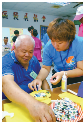
阿公帶自己與孫子親手製作裝飾相框