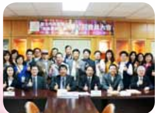
當選「臺北市高職學生家長會聯合會」第9、10、12屆總會長