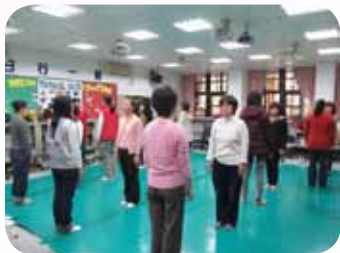
認輔培訓課程中的專注練習

臺北市立西松高中認輔志工團又稱西松逗陣團，自91年10月開始，由輔導室與家長會共同招生成立，參與成員包含學校高中部及國中部分家長、社區家長。褪去家長的外衣，雖有豐富的社會經驗和人生故事可供分享，但在專業的輔導知能上仍有所不足，故引進光寶文教基金會社區認輔資源，聘請學有專