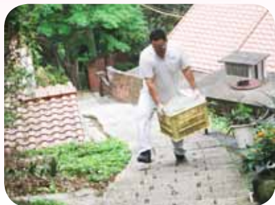
任重道遠責無旁貸

山區小學校，校園方圓數公里內沒有任何商家，更遑論餐飲業。學校聯外道路僅為一條不足8米的兩線道產業道路，沿路環山而上，路途遙遠、道路狹窄蜿蜒，學校的交通及物資運補上有一定的難度。