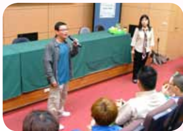
辦理各項專題講座

長歷程，分享自己的生命故事，鼓勵學生尊重生命的價值，相信每個人都是具有獨特性的個體，只要放對位子，每個人都是天才，只要積極為自己找到出口，就能創造無限的可能。