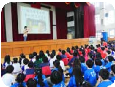
指導學生正確愛眼方法 延緩近視發生