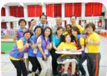
主動關懷弱勢學生，積極參與 臺北市特教學校各項活動