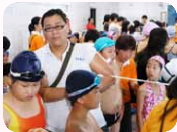
阿文師傅協助本校水上運動會活動