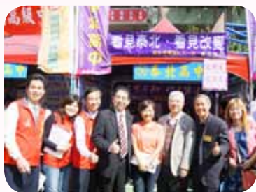
協助辦理臺北市公立私立高中職博覽會