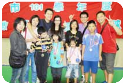
指導孩子榮獲地板滾球大賽冠軍

加了 2011 年臺北富邦馬拉松比賽，「阿湯哥，你可以的，我們一起加油！」、「加油！再撐一下，快到了！老師在你旁邊」，