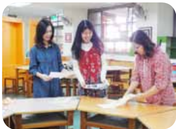
製作海報 - 排版

經過志工彼此多年的討論、實作和調整，淺移默化地培養了學生循規蹈矩的態度，更重要的是加深了閱讀和思考的關係，以及親手書寫的能力，能夠正確的認字和寫字，在現代鍵盤選字的時代，更顯彌足珍貴。每週小學究的題目提供了「探索」和「探險」知識的機會，學生說：「可以增長知識」、「題目有趣」、「順便到圖書館借書」，更有老師提到「小學究出題方向多元，降低學生閱讀偏食的情形」，不但如此，「參考書籍的設置」增加了學生回答問題的意願，更提高了到圖書館的動力，無形中讓學生更加親近圖書館，進而學習到搜尋資料的方法，老師也能從出題中帶領學生進行討論。