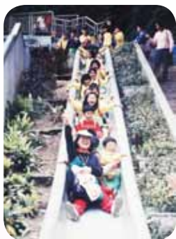
愛心無限在教育崗位