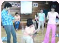
志工們為送畢業生 短劇排演