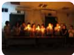
畢業祝福會上的秉燭祝福動人時刻