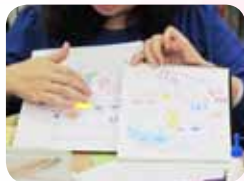
認輔研習分享運用圖畫與青少年對話

認輔志工配合學校輔導室開設多元能力開發班，針對 9 年級在學習及生活常規不適應的學生，規劃激發潛能的體制外課程，由資深志工帶領課程，其他志工協助課程分組運作。