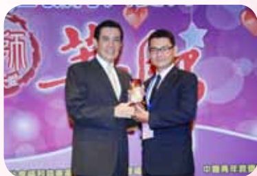
榮獲馬英九總統頒發教育 大愛菁師獎

自瑞老師也衷心的期盼，希望大家共同努力，將這份「愛」緊緊扣住孩子的心，成為學生求學過程中的貴人，並期許未來，他們也能成為別人生命中的貴人。