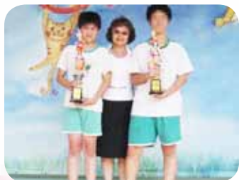
學生朝會 - 獻獎給校長