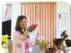
退休感言仍然親切而幽默，祝福親子及同事

願意多照顧這位學生，因老師家離學校不遠，後來還讓這位學生跟老師回家吃晚餐還洗澡，媽媽下班直接到老師家接孩子。校長得知，打趣說：「喔！去老師家吃晚餐還洗澡，這麼好！」。學生笑得很開心撒嬌的說：「是洗澡！」校長也笑得很開心說：「那是貴賓專屬。」