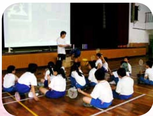
認真教授羽球課程