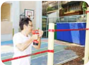
幫遊樂器具進行體檢及維修