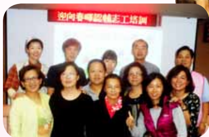
參加認輔志工培訓協助弱勢學生