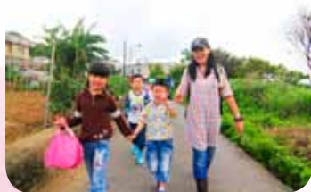
走訪社區步道清山淨水更愛家園

昂；一般上國語課時，孩子得正襟危坐，但透過感官體驗活動活絡孩子每一條神經，在實際的味覺、聽覺、視覺體驗後，引導孩子描述親身的感受，讓孩子印象深刻；闖關活遊戲充滿趣味，一關體驗完換一關，課程設計更貼近孩子的喜好，讓語文能力從遊