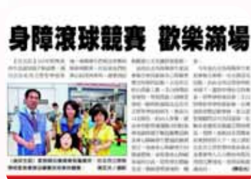
聯合主辦特殊奧林匹克滾球 親子聯誼賽