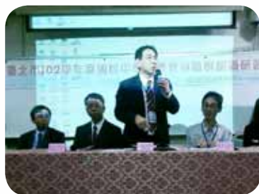
積極主辦臺北市國中教師及家長的 職業教育群認識研習