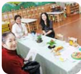
透過親師座談邀請家長共同關心孩子的學習與成長