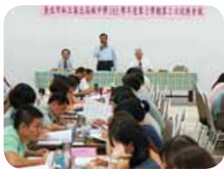
積極參與學校各項重要會議，協助校務推展

三年的家長會長期間，他帶領家長會成員參與本校各項重大會議，均能適時提出建言，協助學校順利推展校務。甚至每一年都會主動帶領本校一級主管及各科老師拜會新北市國中的校長、主任，積極推廣技職教育，期盼讓每一位學生都能找到自己的定位，適性揚才、終身學習，以成就每一位孩子。