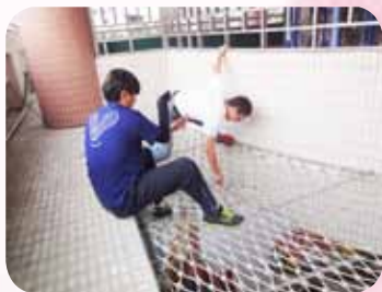
懸掛學生裝置藝術作品