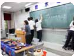
多元能力開發班的五感開學茶藝學習