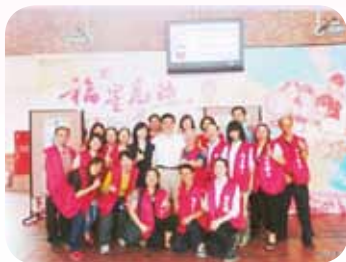
熱心支援協助學校活動

以實際的行動帶領學校的書香志工，透過多元豐富的資料蒐集、積極認真的參與培訓課程、縝密仔細的思考討論，以生動有趣的講述故事、創作俱佳的展演故事，帶領學生親近圖書館，善用圖書資源，並發展建立良好的道德觀念與品德教育，廣受校內親師生的肯定與讚許，也讓這一個感動人心、造福全校師生的閱讀教育支持者樂章，一天又一天在福星校園中持續傳唱。