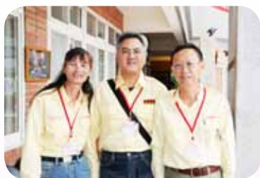
積極參與導護志工隊長進階研習