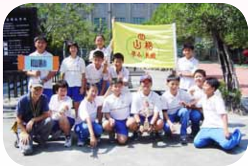
帶領學生囊括無數獎項