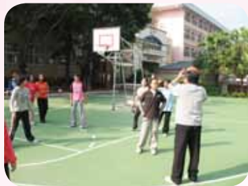
年復一年帶隊教戰