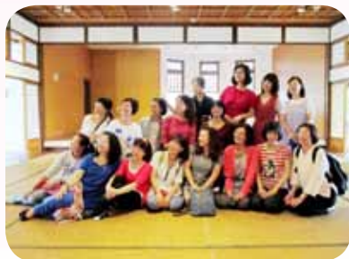
逗陣團北投溫泉博物館文化遊