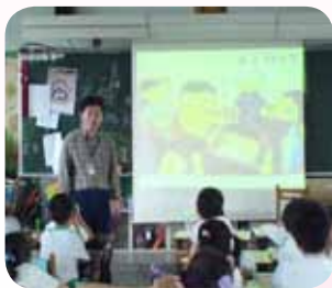
入班宣導課程： 我們該如何幫助他

習成就感，有更多勇氣勇敢站在人生的舞台，持續發光發熱。魏老師更常激發孩子的學習潛能與興趣，每位孩子來自不同成長環境，各有其潛能、性向和興趣，在發展過程中具有相當大的個別差異存在，必須透過有效的教育力量，考量孩子個別差異，引導孩子優勢能力，孩子潛能才能充分開展出來。