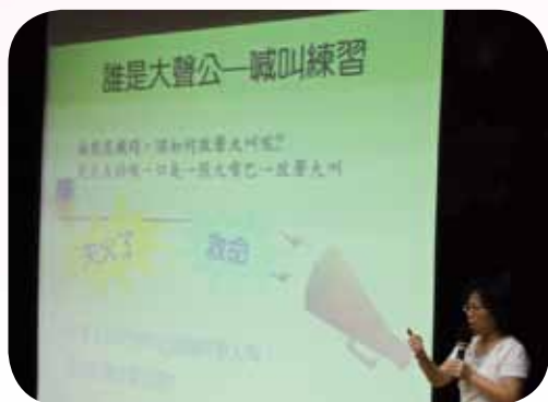
指導孩子如何危機處理