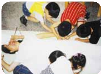
放下身段與孩子互動

回想燕玲老師的堅持，總是以如何照顧幼兒的身心健康為第一考量，經常在幼兒園忙碌之餘還會撥時間參與學校的活動，關