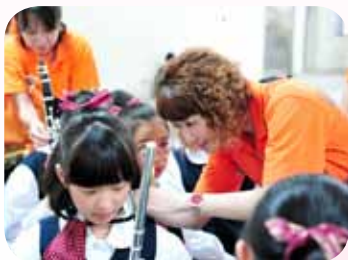
演出前幫孩子們整裝

生與家長的目光，提高了參與意願。其次，更拋磚引玉捐贈所費不貲的定音鼓、爵士鼓以充實原有不足的大型樂器，為樂團發展做了最好的準備。