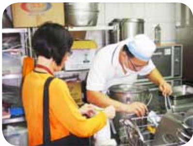
阿文師傅協助營養午餐檢驗