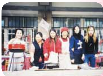
總是倍受家長的肯定