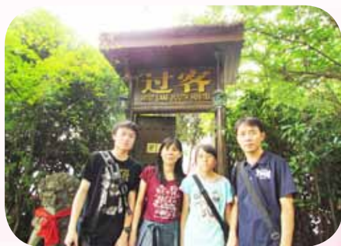
杭州出遊全家福照