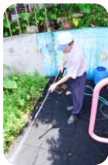
以校為家時常清洗 遊戲場青苔