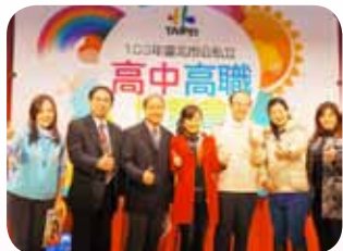
積極參與臺北市公私立高中職博覽會記者會