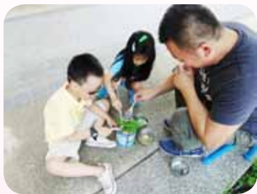
視多障生扮家家酒