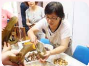
志工成長活動 - 包粽子