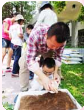
視多障生種菜體驗