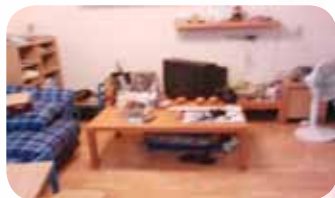
整理後 - 示範整理歸類要領， 訓練生活能力

魏老師與導師第一次進行家訪時，面對小華的居家環境髒亂不堪深感震撼，小華的居住環境滿布垃圾，許多破掉的杯碗、長黴菌裝著食物的餐具、用畢的食物料理包垃圾等散落四處，垃圾中又夾雜著在使用中的物品，生