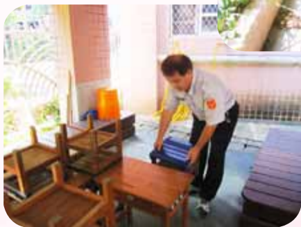
整理上放學留置區