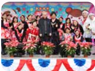
每年辦理全校性 「冬至大團圓活動」

動，為了是要拉近親師生間的互動關係，可說是不遺餘力。尤其在辦理一年一度全校性的「冬至大團圓活動」，邀請家長委員及顧問召開多次籌備會議，精心策劃、處處用心，甚至為求節目效果，更放下身段粉墨登場精采演出，贏得全校師生和來賓們的掌聲與喝采；更與家長委員及顧問們打成一片，對於家長會會務的推展與學校的互動，都會有許多的創意及貢獻。