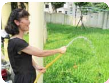
辛勤灌溉草坪綠草青蔥油綠

現在這雙提著菜籃的手，更在平日上下學導護之餘及在周休二日時間，拿起掃把、刷子、樹剪、水管、鋤頭、鏟子等各式工具，搖身一變為校園環境綠美化志工，不論晴雨如大地園丁將自己一人當作數人用——拿起掃把、刷子一畚畚將校園的落葉、垃圾、廁所髒污清潔，使得校園環境每天能有乾淨的面貌；拿起樹剪一枝枝將庭院過多過長的樹枝、竹子剪下，使得庭院樹木能扶桑錯落有致；拿起水管將庭院的樹木、花草早晚按時灑水灌溉，使得庭院草坪生意盎然青蔥油綠；拿起鋤頭、鏟子一鏟鏟將校園角落一隅隅荒蕪的草坪，