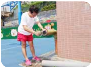
替消防栓套上新衣以維護學生安全