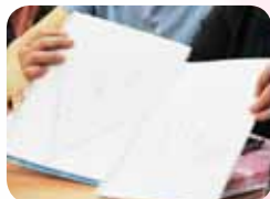
認輔研習分享如何與青少年對話