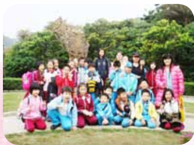
校外教學 - 野柳地質踏查

在學校裡常看到陳老師拿著一台相機，東拍拍西拍拍，鏡頭都是對焦孩子生動的表情及精彩的畫面。沒錯，不管是班上分組討論、學生上台分享、校外教學或學校辦理的活動，陳老師都會隨時幫每一位學生記錄。當一個年段快結束前，他就得花上好多天的時間坐在電腦前為孩子整理照片，並自費為孩子沖洗照片，然後再把它們放進精美的大相簿裡，為孩子的校