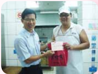
曾校長慰勞阿文師傅辛勞