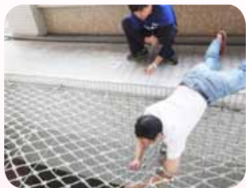
懸掛學生裝置藝術作品