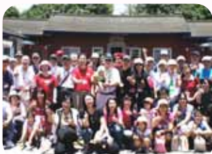
參與學校教職員工自強旅遊活動