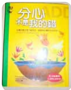
輔導 ADHD 參考手冊