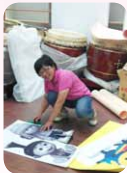
美工組設計 總監兼任裁剪工