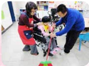
視多障生學習掃地