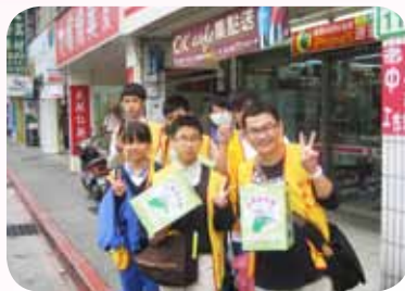
帶領學生街頭募發票

入服務學習與志願服務工作，將學習場所從教室擴展到社區，鼓勵學生「從做中學」，並透過不斷的引導與反思，促進學生的學習發展與啟發助人的情懷，更獲得 102 年度臺北市服務學習績優社團優等獎的殊榮。