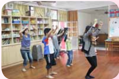
適應體育 韻律舞蹈課肢體伸展指導