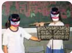
在校生歡送畢業生表演