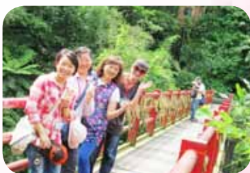
參與志工春季旅遊一同出遊郊遊去