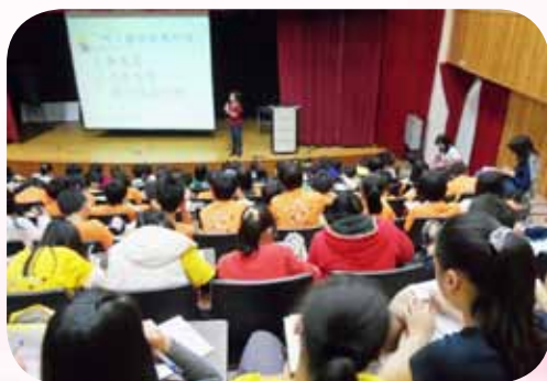
心肺復甦術讓孩子了解生命的重要