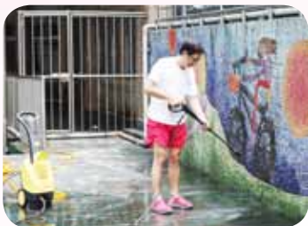
協助清除操場看台青苔

超能李叔叔每天都是景興國小最早上班的人，大約五點五十分就已在景興國小游泳池就位，展開一天的工作，巡視環境、檢查機電設備、檢驗水質、量測水溫等例行性作業，事前準備工作毫不馬虎，清澈的水質、清新的浴廁，讓一大早六點二十分訓練的游泳隊學生及上正式游泳課程的師生，能有安全無虞、舒適整潔的上課環境。學生在游泳池的大小事，就是李叔叔的事。「救生員叔叔，我泳鏡壞了！」、「救生員叔叔，我忘記帶泳帽！」、