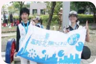
富邦臺北馬拉松 21K 路跑完賽

而突破先天的障礙與限制，重度自閉症的阿湯哥（化名）就是最好的例子，這個孩子擁有健壯的四肢與不錯的心肺耐力，吳老師看出他擁有的優勢潛能，訂定一套長期跑步的科學化訓練計畫，每天陪同阿湯哥在操場慢跑，累積實力後師徒倆還一起參