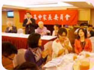
每年辦理家長委員會聯誼餐敘

除了帶領「臺北市高職學生家長會聯合會」會員學校成員積極參與教育局所主辦之各項活動外，其個人更積極參與教育部及教育局所