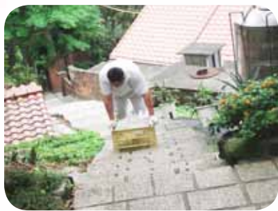
休息是為了走更長遠的路

一日，這條階梯步道如同一條食物補給線，這個年輕人就像輸送帶，不停運轉著，供應大屯國小百多位師生每日中午的膳食。