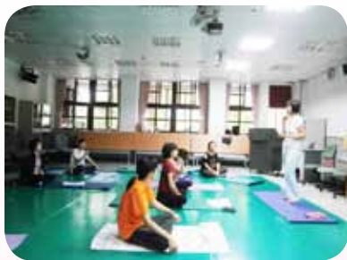
志工團體動力之瑜珈課程

認輔志工團鼓勵成員們終身學習，有志工目前仍就讀研究所，或至空大回流教育，或組成小團體自主進行讀書會、瑜珈班等，在多年的參與共學中，培養出姐妹情誼，相互關懷，並且不吝於團體互動中分享所學，因而除了團員們漸進的學習成