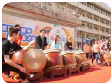
與教育局林局長共同主持 臺北市公立私立高中職博覽會開幕儀式