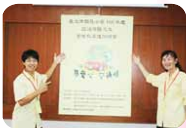
擔任導護志工進階研習講師