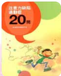
輔導 ADHD 參考書籍

魏老師秉持堅定的信念是：「教育工作者沒有放棄孩子的權利，只有共同承擔孩子成長的責任」。從他輔導小華的過程中可以看到魏老師不放棄任何一個孩子，每個孩子無論資質優劣，都有無限發展的空間，切切不可否定、放棄孩子，只要正向面對生命的態度，每位孩子未來的發展都將擁有自己的一片天。此外魏老師充分的提供舞台以建立孩子的學習信心與成就感，學習信心是促進學習效果的動力，學生有學習信心，會更加努力學習，老師若能提供給孩子適合的舞台，孩子舞台上的表現獲得正向的肯定，能夠建立更多的信心，也更容易產生學