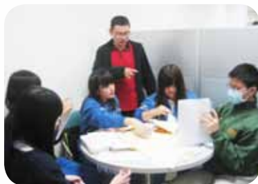
帶領學生前往伊甸基金會服務

入服務學習與志願服務工作，將學習場所從教室擴展到社區，鼓勵學生「從做中學」，並透過不斷的引導與反思，促進學生的學習發展與啟發助人的情懷，更獲得 102 年度臺北市服務學習績優社團優等獎的殊榮。