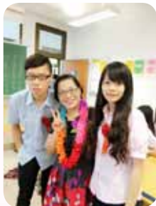
祝福畢業同學 鵬程萬里

一個人經常埋怨，那麼這個人什麼也做不來。」「如果一個人只想著欠缺的東西，而不去珍惜所擁有的，那根本改變不了問題，問題仍然存在，問題仍然不會解決。」「真正能改變命運的，並不是我們的機遇，而是我們的態度。」