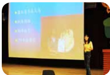
中山中正萬華區導護志工訓講師

介紹臺北市愛心導護志工隊組織架構……等，不吝將個人習得的導護知識、經驗和志工們分享；同時積極參與各式自我成長研習（導護志工隊進階研習、靜思語教師成長研習、攝影／照相／紀錄三合一研習……等），坐在台下重溫擔任學子時光，目不轉睛將臺上講師的重點一筆一筆紀錄，並和現場學員一同分享學習心得，回到學校也將學習成果和同仁分享；站在志工春季旅遊遊覽車上，滔滔不絕和志工分享生活新鮮趣事，水果點心一盤一盤餵飽大家五臟廟，歌曲獨唱、合唱一首接一首熱絡車上氣氛，在在拉近志工們間彼此情感。