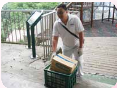
食材運抵廚房已是汗流浹背氣喘吁吁

這些年來，學校的營養午餐好不容易辦理委外經營後，卻衍生出另外一個問題，那就是駐校廚師的穩定性，由於本校特殊的環境，駐校的廚師既要有精湛的廚藝，還要有強健的體魄，能扛重物爬上石階，更重要的是要能吃苦耐勞、意志堅定，因為吃重的工作是整年度的，每天如此的操練，不是每個人都受得了的。