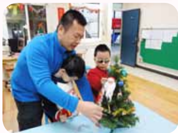
視多障生耶誕樹裝飾