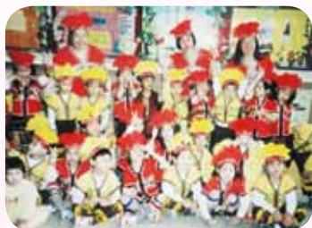
視如己出的關愛孩子