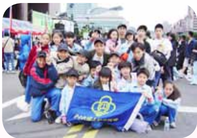
帶領學生參加路跑比賽