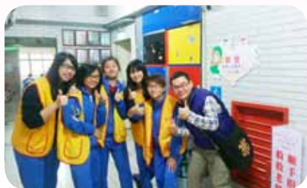
帶領學生到創世基金會服務

的社團指導老師，每週三下午帶領學生從事社區志願服務，分別前往「伊甸社會福利基金會」、「創世社會福利基金會」及「萬芳啟智中心」從事社區服務與街頭募發票活動，激勵學生體認生命的意義，培養多元價值觀，發揮「助人最樂，服務最榮」的精神。其熱衷投