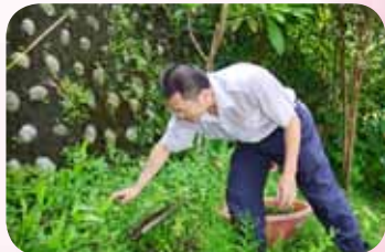
為學校省經費自行爬上爬下替生態池接水源