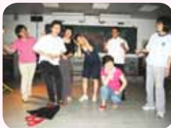
志工演出孩子 國中三年心情做獻禮