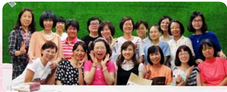
豐厚彼此的敘事治療課程後與講師合影