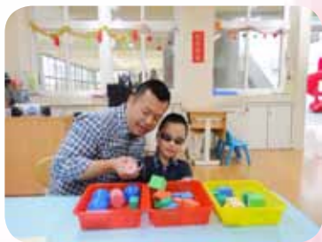
視多障生數學分類