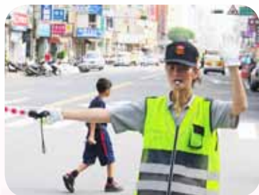
導護執勤協助學生上下學行的安全 辛勤擔任導護工作廿餘載從不間斷