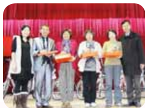
積極關懷與表揚志工團隊

洛瑜會長每天早上都會陪同校長到各個導護崗關心導護志工，為志工夥伴們加油打氣，遇有導護志工生病時，她總是設法親自關懷並致贈慰問；為了增進導護志工的執勤知能，她也邀請劍潭國小導護志工到雙園來進行導護值勤知能分享與交流；為了增進導護志工隊的情誼，她用心辦理歲末餐會、志工旅遊與資深志工表揚等活動，有效凝聚大家的情誼；她也為志工們辦理親職教育和電腦網路研習與親子閱讀和瑜珈工作坊等，讓志工們在學習成長中愈發有行動力與教育力。