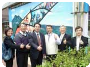
積極拜會新北市各國中學校

由於他的主動、積極、愛心與服務熱忱，不但深獲歷屆家長會長和委員們推崇外，也獲得臺北市各公私立高職學校家長會長及各校家長代表的一致肯定，遂當選「臺北市高職學生家長會聯合會」第9、10、12屆的總會長，使其更能充分發揮「愛屋及屋」的教育熱忱。