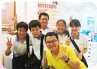
帶領學生到萬芳啟能中心服務

宜蘭家扶中心等社福單位的志工，且於民國 88 年起，開始擔任宜蘭家庭扶助中心的認養人，資助經濟弱勢的學子。除此之外，於任教後迄今，積極推動「服務學習」，擔任學校輔導義工社