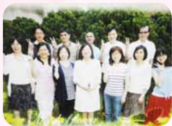
一直獲得同仁的喜愛