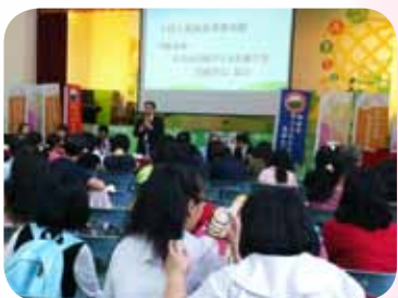
與新北市中小學家長協會合辦國中家 長技職教育職群認識研習