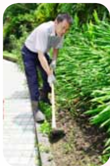
揮汗鏟土維護菜園

雙溪國小生態池的水源最早是引用自來水，再利用抽水馬達及水循環的方式，才讓生態池能長久運作，但這樣的維護方式，耗費了不少的水電費用，畢竟不是天然的運作方式。於是教導主任與陳先生決定引用大自然的水資源，建造一個自然的生態池，他們自行購買水管，利用簡陋的設備器材，一段一段辛苦的埋管接管，克服地形地貌的障礙，終於形成一條水道，可以源源不絕的送水到生態池，讓生態池永保生機，如此大費周章的利用大自然資源，為學校省下不少經費。