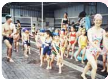
活力十足在教學舞臺