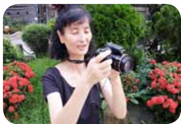
協助學校拍攝學生生活動紀錄

現在這雙提著菜籃的手，常在導護、校園環境綠美化之餘，在校內同仁尋求協助聲下，藉由本身過去學習攝影的技術，拾起相機化身為行動攝影師，為校園活動留下一張張動人的歷史足跡——體育組運動競賽：看一年級學生盡情搖轉呼拉圈、二年級學生一上一下賣力跳繩、三年級學生足球神童射門競賽、四年級學生樂樂棒球擲準賽、五年級學生樂樂棒球班級對抗賽、六年級學生三對三籃球鬥牛競賽、親師棒球賽、中山區群組馬拉松、臺北市青年盃田徑賽、市長盃游泳接力賽……等，拚擦拚擦張張為學生汗水留下青春印記；校園工程的紀錄，藉由本身家族工程的背景經驗，透過相機寫下監工日誌——施工前、施工中的照片分別紀錄著無法再回去的過去，留下曾經陪伴師生的共同記憶／竣工後的照片則印證了工程期間的一磚一瓦、眾志成城的努力，迎接師生未來生活的建築成果。張張照片抵上千言萬語，留待後人付諸笑談中。