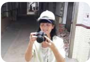
協助學校拍攝校園工程紀錄