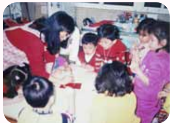
用心付出於各項領域

心從附幼畢業直升小學部的小朋友，愛心澤披於全校，即將退休還念念不忘學校的事。她說：「聽說許多的前輩，退休金用來出國旅遊或投資置產，我想做一些更有意義的事。」常懷感恩心的燕玲老師還說：「感恩政府德政，政令未改，仍有退休金可領；也感恩當年教育局陳局長任內普設公幼，嘉惠幼兒及我們；更感恩長年服務的大橋國小關心與照顧我。」她也打趣的說：「如果有一千萬的退休金就太好了呀！」