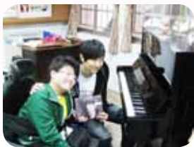
認輔學生努力事蹟 感動歌手

方老師有感於孩子對自己生命缺口的遺憾，更是主動幫孩子報名參加局長教育關懷獎及總統教育獎，希望透過公開獎項的肯定讓孩子再次有機會看見自己生命中的不完美其實是生命珍貴的禮物。其中總統教育獎提報的過程中，各項書面資料的撰寫及準備非常繁瑣，但方老師總是默默的一點一滴累積成冊，希望孩子透過獎項的肯定看見自己的無限可能。上天總是眷顧，因為局長教育關懷獎的報導，小恩圓了一個美夢。記者採訪時，小恩表示自己有一個心願：和自己最喜歡的歌手林俊傑合唱。記者主動聯絡了華視圓夢計畫，圓夢計畫安排了林俊傑歌手到校與小恩班上共同上了一堂令民族師生永生難忘的音樂課。