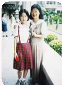
持續關心畢業的孩子