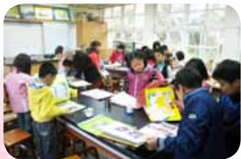
語文聯課～成長相簿主題 以介紹孩子的成長歷程為主軸

日夜苦思，到底該怎麼做才能帶領平等孩子突破困境呢？若老師們單單只是在自己班上努力教拼命教，十個孩子