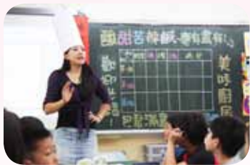
因應學校人數不足 設計跨班級語文聯課～美味廚房

平等國小，位於風光明媚的陽明山平等里，一個學年僅一班級，學生人數從一個班二十多人，銳減至今日一班僅十人左右，少子化的影響衝擊全台灣，平等也難倖免。大環境的轉變，