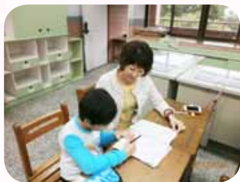
發揮大愛參與學習輔導志工

學音樂的孩子不會變壞，這是大湖國小許多家長共有的想法。因此，大湖國小管樂團於民國 86 年成立了。要發展管樂團並不容易，因為每次樂團的練習、表演、發表和比賽，幕後總是有繁雜的準備工作，若沒有堅強的家長後援會，學校即使有心，亦難全面關照。