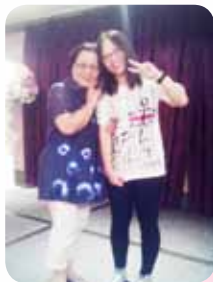
感謝同學精心策劃 準備的謝師宴