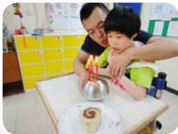
視多障生認識過生日