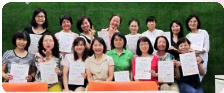
每期培訓課最重要的校長頒發證書

一路走來多年，之所以能夠如此持續投入付出，為的是把心中那份愛送出去。因為在我最困苦時得到別人的關愛，才得以成長，收獲比付出還多，那幸福的感覺是我要珍惜的，不管種子何時發芽和茁壯，只要記得把那愛的種子散播出去，在任何的角落裡，它一定有機會被接收到，在認輔這條路上，充滿著感恩與喜悅而繼續下去。