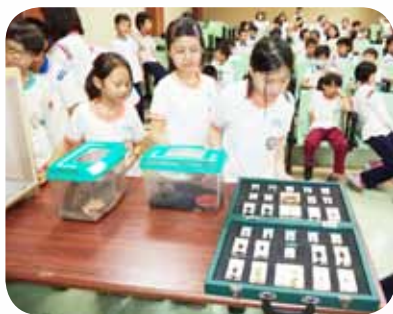
多元教學活動 - 學生觀察昆蟲