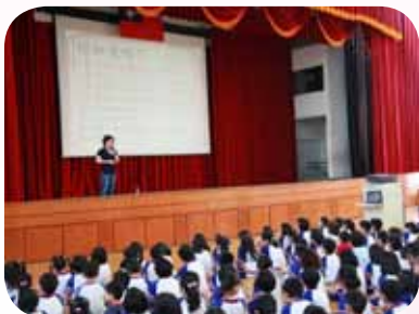
介紹世界視覺日讓孩子能夠珍惜自己的眼睛