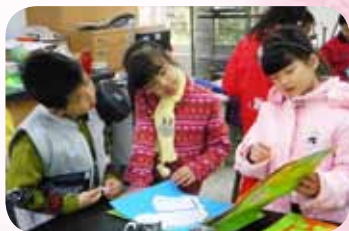
課程結束後舉辦小書分享茶會 讓孩子互相觀摩作品

同事們在瑋筠老師的號召之下，紛紛加入了這個語文聯課活動的計畫，一個學期十多次的研討，從設立課程目標、規劃課程內容、協調上課的時段地點，老師們無不絞盡腦汁貢獻想法，既然是聯課，就是打破班級和年級之間的界線，利用混齡分組的方式，讓孩子有機會能接觸更多不同的孩子，產生不同的火花，在原班級中的佼佼者可藉由混齡分組，學習學長學姐的優點、進而提升其語文層次；原班級中的低成就孩子可藉由混齡分組，嘗試展現自己的潛能而不受