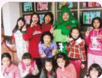
以可愛角色為學校帶來歡樂與希望