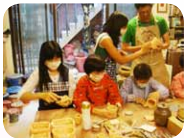
藝術治療 陶藝課程捏塑體驗

孩子學習成果的表現舞台，也是校園融合教育最佳的平台。除了動態的表演之外，吳老師也將「陶藝」與「手工藝」融入班級特色課程中，充滿細心、耐心地指導，讓每個孩子發揮創意，並規劃教室外的「特教藝廊」展示空間，讓學生的作品獲得獨立展示的機會。