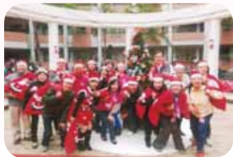
愛與關懷的聖誕隊伍