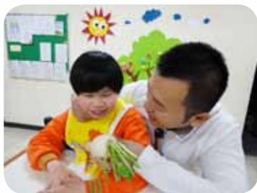
視多障生認識新年年菜