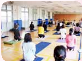
開辦各類家長志工 成長團體

洛瑜會長每天早上都會陪同校長到各個導護崗關心導護志工，為志工夥伴們加油打氣，遇有導護志工生病時，她總是設法親自關懷並致贈慰問；為了增進導護志工的執勤知能，她也邀請劍潭國小導護志工到雙園來進行導護值勤知能分享與交流；為了增進導護志工隊的情誼，她用心辦理歲末餐會、志工旅遊與資深志工表揚等活動，有效凝聚大家的情誼；她也為志工們辦理親職教育和電腦網路研習與親子閱讀和瑜珈工作坊等，讓志工們在學習成長中愈發有行動力與教育力。