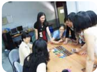
運用心理圖卡和孩子對話前的體驗活動