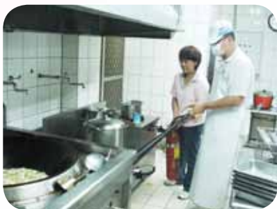
阿文師傅廚藝精湛更注重衛生