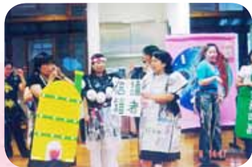
環保愛護地球資源戲劇展演

101 學年度，福星國小新圖書館「Book 思議屋」搬遷落成，與「福氣滿屋」二手智慧書屋的正式啟用；為使圖書館與閱讀教育，在福星更向下扎根，更具體落實，在 102 學年度，杜女士