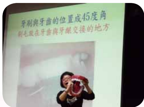
指導學生正確的潔牙方法