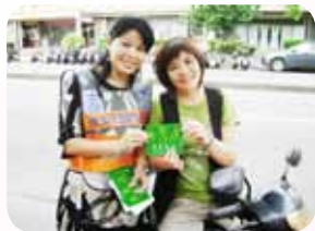
熱心協助交通安全宣導

化解社區居民的疑慮，最後終於成功地擴大健全了家長接送區。不但如此，她還天天到現場協助發給家長宣導貼紙，幫忙向不清楚的家長以及安親班宣導接送學童的注意事項呢！現在，不但家長接送學生安全多了，社區往來車輛也不再塞車，同時，社區民眾的停車費負擔也減輕不少。