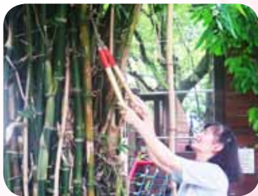
修剪繁茂綠竹使得綠竹有序生長

活化耕種作為教學綠地園區；拿起其他想像不到窮則變的工具，有時一個人、有時和總務處同仁共同完成許多不可能的清潔任務等。這些點點不計辛勞地付出，將校園有如哈利波特魔法般，動動巧手瞬間將惱人事物化為妙有情境，只願校園能有乾淨、清爽的環境供教師無慮教學、學子專心學習、盡情嬉戲。