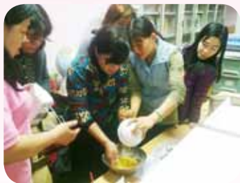
志工成長活動 - 做蛋糕

例如泰國舞蹈，在學校節慶活動上表演，讓親師生目不暇給地體驗多元文化之美，並涵養多元與跨國際思維；甚至在學生期末餐會上，分享泰式奶茶、月亮蝦餅、越南菜等。