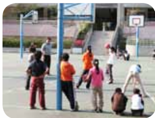
假日晨起砥礪苦練

烈日，一點一滴地投入，逐漸孕育出劍潭國小籃球隊得以發展的運動土壤。至此之後，不只一次我們看見了球隊的表現，民國88、89、90年臺北市師生盃籃球競賽冠軍，劍潭國小被看見了，民國92至96年更得五連霸殊榮，球隊也變成了一個品牌豎立在學校前面，為學校打