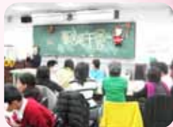
歲末感恩會上，校長勉勵與志工及學生