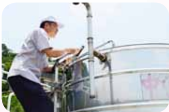
爬上爬下查看水塔