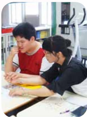
耐心陪伴 找到每個孩子溝通的方式

吳老師具備非常溫暖的「母性光輝」！總是將身心障礙的孩子視如己出，生活照顧更是無微不至。即使面對有著身高180公分，體重直逼100公斤的小巨人翔翔（化名），身材纖細的吳老師卻毫無懼色，運用溫柔的堅持感化了這位重度自閉症的孩子，雖然磨合過程中曾經被孩子扯斷頭髮、咬傷流血甚至撞傷骨折，充滿教育愛的她還是勇於要求生活常規，例如當翔翔無法以言語表達自己的需求、意見或委屈而引發情緒激烈的反應時，吳老師會耐心的