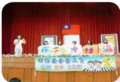
正確洗手以杜絕腸病毒