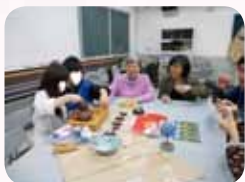
多元能力開發班 成果展上為師長們泡茶