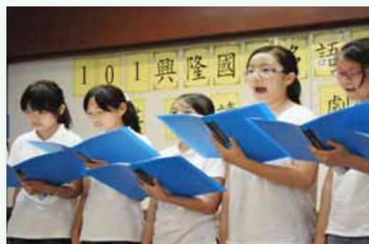
多語文學藝競賽－英語讀者劇場

興隆教師團隊發揮教學專業，以孩子學習為本位，配合學校特色發展，設計及規劃以下的學習方案：