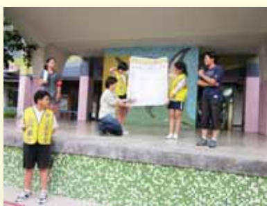
每週公布跳繩次數成績