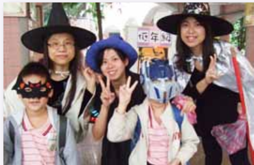
英語日變裝，教師教學活潑有朝氣

講求效率的行政團隊，為教師教學提供最佳的服務品質。親師生凝聚力強，遇有問題皆能理性溝通，促使校務發展圓滿順暢。2008 年獲得臺北市優質學校「校長領導」獎項，2011 年獲得臺北市優質學校「行政管理」獎項，行政團隊成為學生學習之後盾。