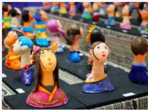
每年辦理畢業美展，主題多樣豐富