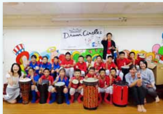
非洲鼓的實作體驗