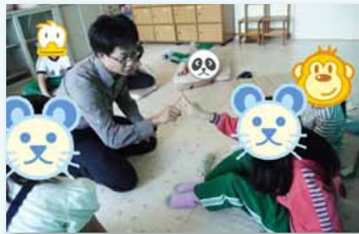
輔導室學生小型團體輔導