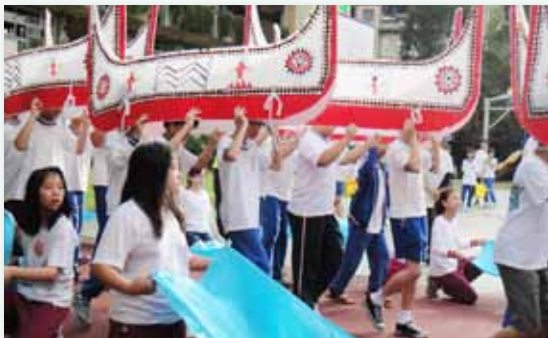
藝文學習成果 - 達悟族拼板舟