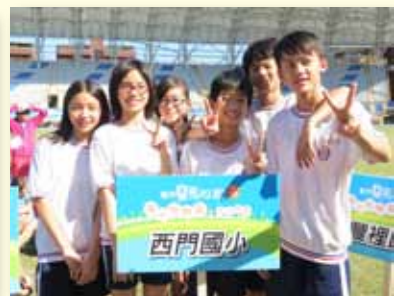
參加各項馬拉松賽