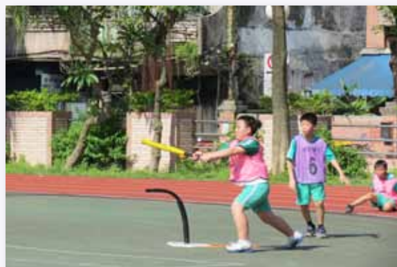
辦理樂樂棒球比賽