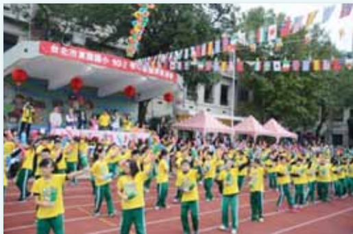
體育表演會熱力四射

透過棒球特色的鮮明品牌，我們延伸多項教學活動，搭配課程深化孩子的學習廣度與深度，實踐本校「健康活潑、主動積極、知書達禮、關心互助」的願景。為了我們的孩子，鞏固現有的成果，開展未來的契機，是我們仍將努力的方向，讓「優質教育愛 東園紅不讓」永續發展。