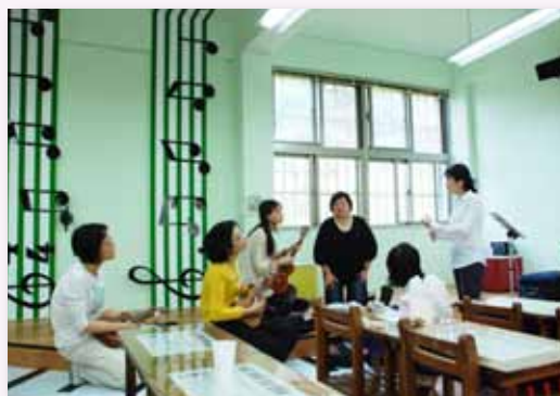
烏克麗麗社群研討