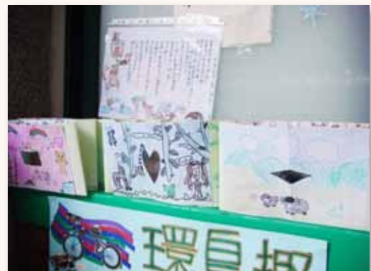
教學博覽會作品展示