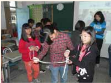
生命教育課程建構學生生活目標