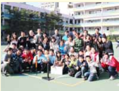
體育課程～師生聯誼球賽