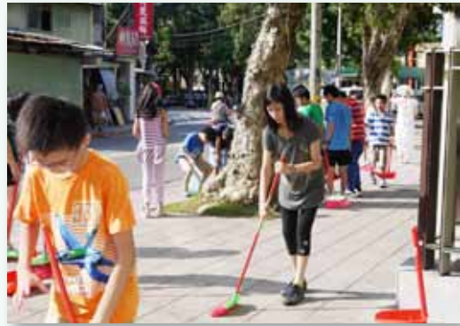
社區清掃友善校園