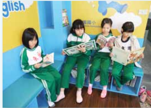
在東園轉角遇到書