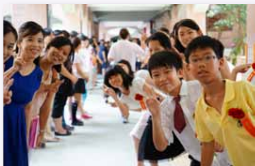
師生們的微笑，是我們最珍貴的寶物