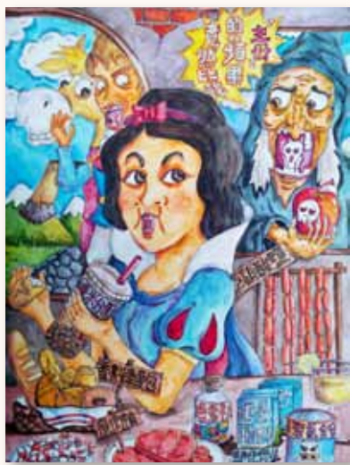
五項藝術競賽高年級漫畫第一名