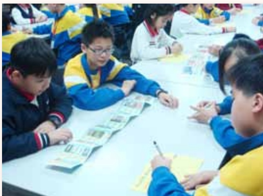
香港小學來訪學生共同學習