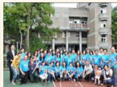
志工群提供課業輔導與身心關懷