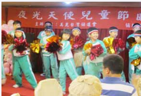
夜光天使班感恩會

各類資源有效運用統整，從硬體的設備、設施，到軟體的心理輔導、關照服務，學生的需要在哪裡，資源投入就跟著來。舉凡空間