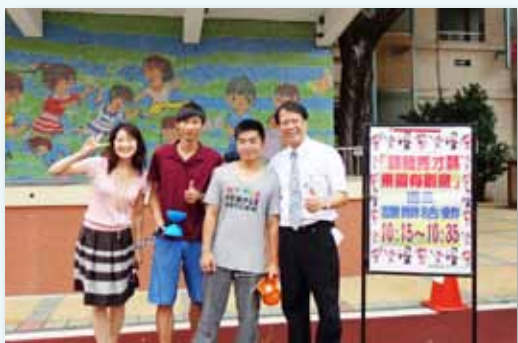
老師也參加課間秀扯鈴