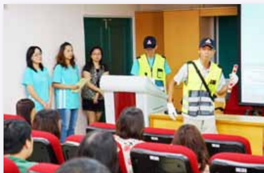
愛心志工守護每個學童的安全

家長會正向積極參與校務，豐富學生活動，增進學生學習效果，每年協助舉辦兒童節闖關、五子棋大賽等活動，充分展現家庭教育與學校教育攜手共進的信念。2009 年獲臺北市優質學校「資源統整」獎項。2010 年榮獲教育部全國教育創新獎 Inno school 社區資源優等獎。2005 年、2011 年度兩度榮獲臺北市優良志工團體金鑽獎。