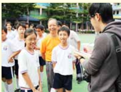
「跑跳好心情」媒體採訪