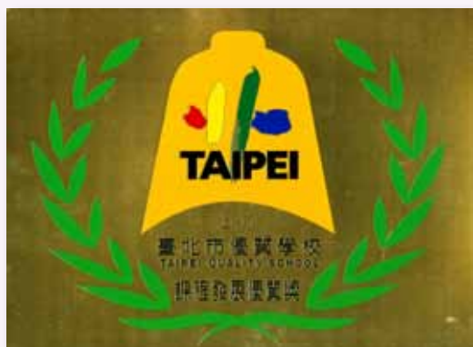
臺北市優質學校 - 課程發展優質獎

生命教育之研究」榮獲第 12 屆臺北市行動研究「優選獎」、「從低年級綜合活動領域中落實環境教育之研究」榮獲第 13 屆臺北市行動研究「佳作獎」；此外，2010 年本校的特色課程與教學榮獲 InnoSchool 全國學校經營創新優等獎，2011 年更榮獲本市優質學校課程發展優質獎，至 2013 年本校在課程計畫評鑑榮獲臺北市特優推薦，不僅證實教師於課程研發專業的豐碩成果更是最高的鼓舞與肯定。