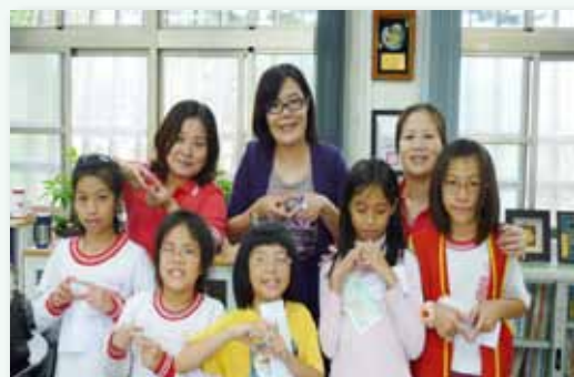
技嘉捐助家庭突遭變故助學金