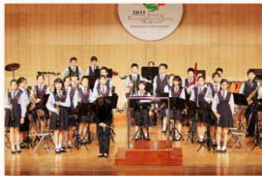
五項藝術競賽直笛團