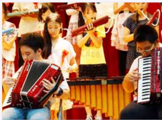
畢業音樂會，展現樂器演奏實力