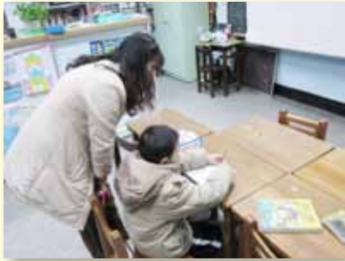
資源班教師個別化輔導