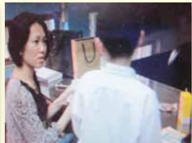
心理諮商師個案輔導