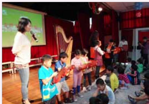
音樂家走入校園活動