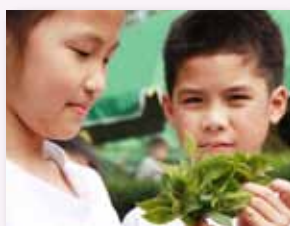
親手採摘一心二葉

讓孩子們從體驗茶鄉建築、茶藝之美、製茶過程及以茶藝知能，涵育孩子們的生活美學，並培養感恩情懷。