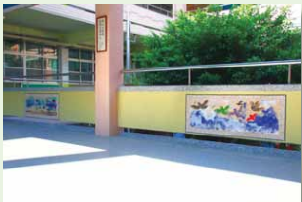
學生作品融入校園環境

學生是學校的主體，因此「學生第一」、「提供舞臺」、「發展特色」、「適性發展」成為我們教育理念的核心，學校的一切教育措施和教育作為，均以學生的興趣、能力、需要做考量，並重視「適性」的發展。而在實踐教與學多樣化，強調體驗學習，讓每個孩子都能成功的歷程中，我們特別強調「推展多元團隊成就多元明星」、「建立合宜輔導體制帶好每