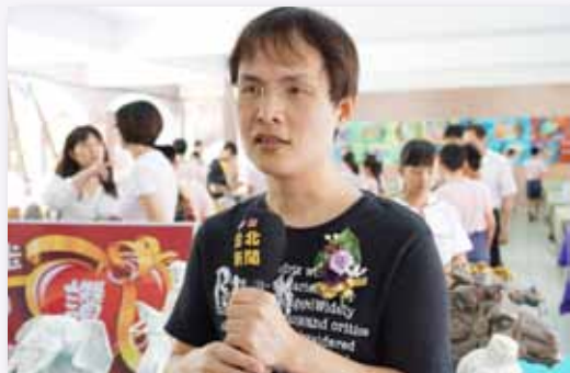
媒體朋友採訪本校畢業美展

分享學校良好的辦學成效，展現教師教學專業，呈現多元特色，善用網站媒介，定期出版「馨園」親職刊物、「修德園地」校刊，深獲家長和社區人士的支持與肯定。學校藝文教育特色與學生各項學習精彩展現，獲地方電視臺、平面媒體等報導，將精緻創意的教學活動傳揚，獲得各界的肯定。2012年榮獲臺北市教育局「教育行銷卓著獎」。