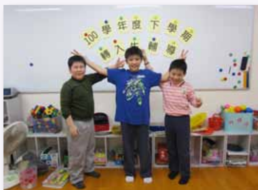
轉入生輔導，協助孩子認識新環境