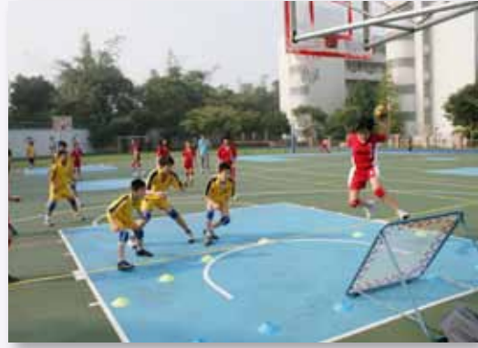
「君子球」巧固球校隊練習