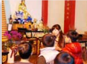
進行步道人文踏查