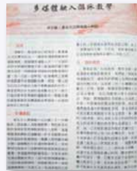
教師天地第 133 期報導游泳教學