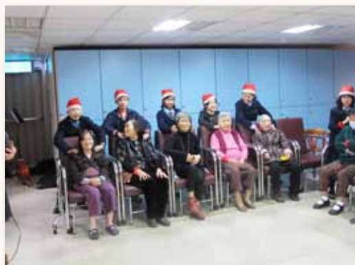
志工隊 - 社區服務探訪文山老人中心