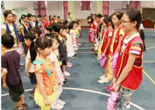
謙恭有禮興隆好兒童

課後照顧班、永齡希望小學、崇德社周末快樂學習營，強化弱勢族群子女教育活動。針對貧困、單親、失親、隔代教養…等弱勢家庭，結合社會資源，開辦攜手激勵班、夜光天使班，提供溫馨照護，同時配合家長需求，經常性辦理親職教育講座、多元文化活動，隨時提供相關教育資訊，提升弱勢族群親職教育知能。榮獲 99 年攜手激勵訪視績優學校、葉可嘉老師榮獲 99 年度攜手激勵學習潛能計畫「大手牽小手」績優教師獎。