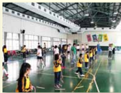
推廣校際跳繩教學