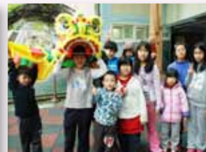
舞獅採青體驗年俗