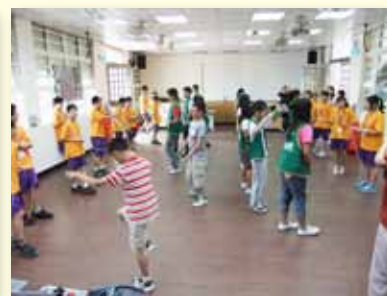
校際交流跳繩教學表演