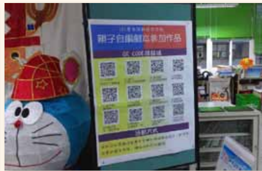
QR code 即時分享親子自編故事