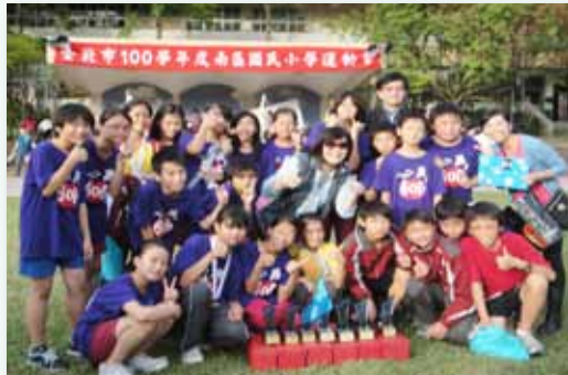
田徑隊 - 參加南區運動會