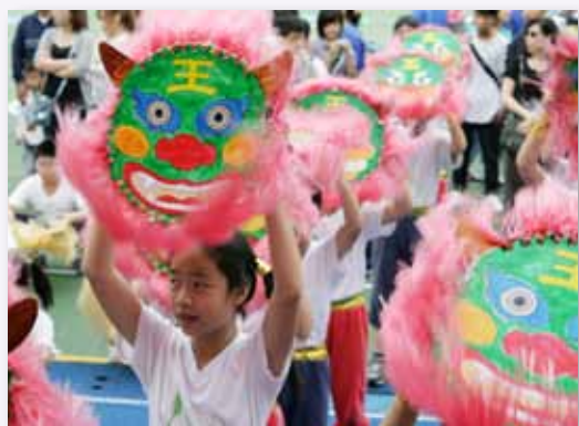
校慶重頭戲，各年級精彩表演

我們努力營造優質藝文學習情境，提供多元創新的教學活動，重視學生適性發展，涵養豐沛美力，深植文化傳承，共享努力成果。