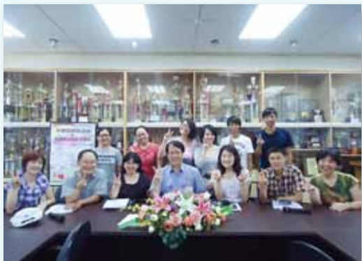
溫馨的教學輔導教師制度