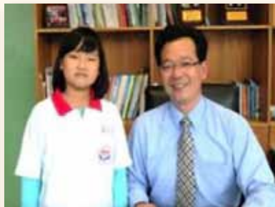
榮譽制度表揚學生優良事蹟