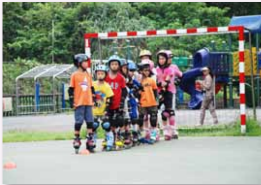
提供補助令弱勢孩子也可參加社團

除了學區本地孩子之外，我們採混合型大學區，接受臺北市各區之學生到本校就學，因此，家庭組成十分多元。一直以來我們積極的推動預防性輔導措施，營造溫馨、和諧的校園文化、提供機會發揮潛能、肯定並給予孩子更多的關懷與支持，在親師生的努力下，我們一直保持「零中輟」的紀錄。另外，我們的弱勢家庭（含單、繼親、隔代教養、身障生、新移民）約佔 40.22%，社經背景普遍需扶持，伴隨經濟與教養問題，為此，學校成立教育儲蓄戶專戶，並積極引進各項政府及社會資源，提供弱勢孩子各項獎助學金申請（如指南宮、集應廟之獎助學金）、安心就學補助申請、午餐補助、攜手激勵之外的向陽專案課後輔導、家長會提供的社團學習補助、駐區諮商心理師到校輔導等，以拓展其學習視野，確保每個孩子都能安心就學，期能全方位的關懷扶助每個需要協助的孩子。