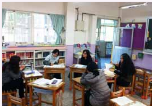
教師共同備課暨語文領域社群研討

為了促進校本課程之特色與創新，需透過持續的研討規劃，以整理各項自然人文資源；為掌握校本課程的傳統與精神，需要不斷的交流互動，並傳承種種課程教學設計。學校安排週五下午為級任共同空堂，由老師進行教學研習及社群活動，行政處室除共同參與規劃、討論，校園內逐漸形成教師專業學習社群，藉由協同合作、分享實務、省思對話、關注學習，提升教師專業成長，型塑學習型的校園文化。