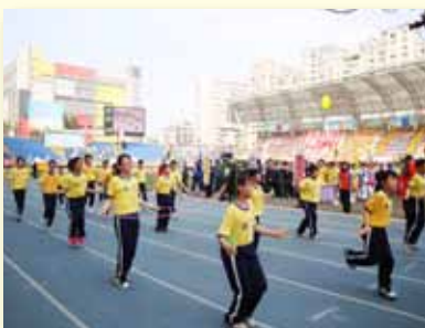
中小學運動會開幕表演