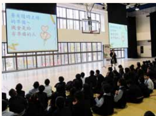
生命鬥士講座 - 愛的加減乘除