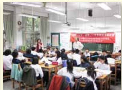
團體志工協助輔導