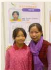
困境中努力不懈 榮獲教育關懷獎