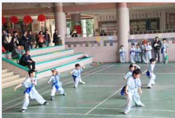
少林拳社團表演，深獲家長肯定

建構適性、多元的學習課程，透過教師專業的教學設計，孩子不必到才藝班學習各項才藝，在學校課堂即可體驗、發展藝文類與運動類的各項專長，包含有藝文類的直笛、書法、捏塑等，運動類的游泳、少林拳、田徑等。另開辦多元的課後社團及才藝班，學生就課堂體驗學習的才藝，選擇適性的社團，加強專長訓練。國樂團、直笛團、書法、少林拳、游泳等團隊對外比賽成績斐然，孩子們的學習不僅普遍發展，且優化學習有成效。