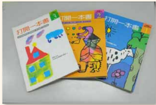
師生共讀記錄出版「打開一本書」

有別於一般學校閱讀的模式，興華國小的閱讀以打開一本書為基礎，設計校本閱讀課程。班級共讀以師生共同閱讀同一本素材後，經過學生的提問及教師的引導，針對素材的內容，師生透過討論、發表、傾聽，在彼此相互激盪的過程中，澄清學生的思想，以建立正確的價值觀及提升對閱讀素材提問問題的廣度與語文表達能力。