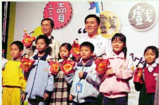
戲劇融入的閱讀推廣活動

美學大師蔣勳說過：「美，是一種無目的的快樂，很多人誤解了美的意義，以為美只存在於戲劇院、美術館，只存在於馬友友的音樂符號中。其實美存在於日常生活的接觸，當我們開啟每一絲感覺，會發現每一個生命存在的特徵和狀況都不可取代」。學校在「前瞻、關愛、成長」的教育願景引領下，透過九年一貫課程的精熟與學校本位課程的實施，發揮學校課程特色，開展吉林孩子潛能，讓美的生活存在校園的每個角落。在歷任校長的細心規畫與領導下，跟隨教育政策及教育思潮的轉變，從基礎教育的改變到學生多元智能的開展，逐步踏實向上堆積。藉由「藝文教育、深耕閱讀、e化教學」營造學校特色；透過拓展多元化專長學習活動，建置專長認證系統，培養孩子專長；積極建構學校豐富資源網絡，統合校內外學習與輔導資源，讓每一位孩子都能安心就學、健康成長。多年的深耕與努力，近年來陸續獲得外界的肯定，包括優質學校的「校園營造」、「學生學習」、「資源統整」、「行政管理」等獎項，黑光教學榮獲教育部「教學卓越金質獎」，申請臺北市教育 111 認證通過並完成換證等，充分展現「讓每個孩子適性發展、讓每位教師專注教學、讓每項特色展現成果」的經營績效。