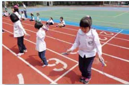
二年級班際跳繩比賽