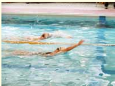
體育課程～規律游泳練習