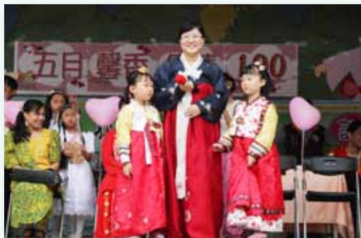
多元文化說媽媽的話

興隆位於教學資源豐沛的文山社區，除了配合課程教學善用社區學習資源外，我們也引進主婦聯盟、創價協會、巴巴文化…等外部教學資源，挹注學生學習，豐富學習內涵，同時也整合社區人力資源，健全志工組織，支援學校各項活動；邀請校內外具專長之教師、家長開設社團，有效提升學生學習效益。此外，近幾年我們更透過社區、民間公益團體，爭取清寒學生各項獎助學金，協助弱勢學童。並積極爭取教育局「校園優質化」經費，營造優質學習空間增進學習效益，同時也配合臺北市城中扶輪社「打造社區、連結世界」綠行動計畫，接受扶輪社捐贈自然生態池，除了優化校園環境外，更提供學生自然生態學習的最佳場域。