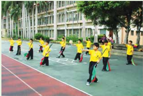
精湛武術強身體健