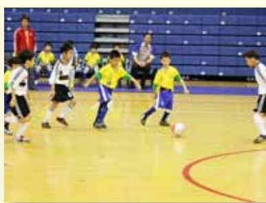
參加教育盃足球比賽