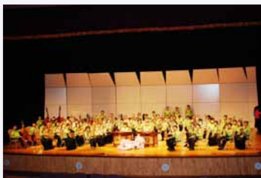
國樂團參加全國音樂比賽