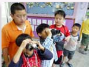
飛羽週家族望遠鏡教學