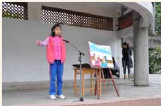
學生朝會小小說書人分享