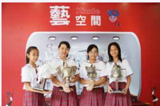
打造角落美學，展示孩子作品

以多元學習、體驗學習之活動經驗，提高學生學習動力，涵養學生心性，學會悅納自己，欣賞別人。創造學生高峰經驗，品味藝文及生活美學，開創精彩人生。我們每年辦理教學參觀日，邀請家長及社區人士進入校園，實地參與教學活動，和孩子們一起學習，共享學習成果。2012年榮獲臺北市優質學校「學生學習」獎項，2013年榮獲臺北教育111標竿學校認證。