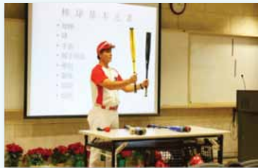
棒球賴敏男教練擔任週三進修講師