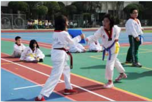
強而有力的跆拳道社團

所有的教育活動，皆以達成五育均衡的國民教育目標為施教者的重要職志，我們整合校內外資源，規劃多元教育活動，讓孩子除了基本學力的習得外，也能豐富學習內涵，拓展生活觸角，延伸學習廣度；辦理課外社團及校隊訓練，讓孩子擁有健康的身體、活潑的心靈，增進孩子運動和藝術技能，培養孩子各項專長，適性學習並提供展現舞臺，孩子的亮點供他人欣賞，正向的互動讓自信倍增，以達良好的學習成效。