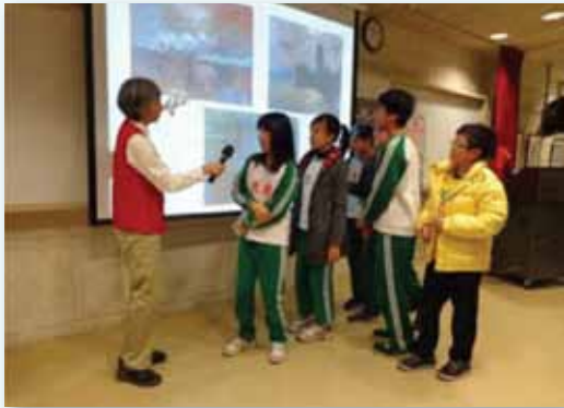
莫內印象藝術到校賞析