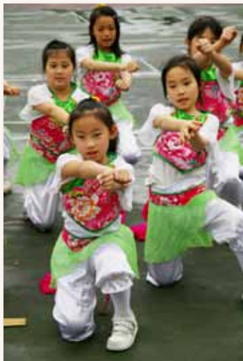
一年級學生舞蹈演出