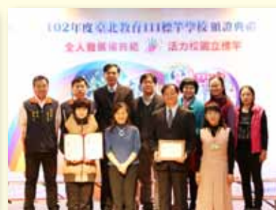
教育 111 標竿學校頒證