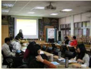
充實教師輔導知能