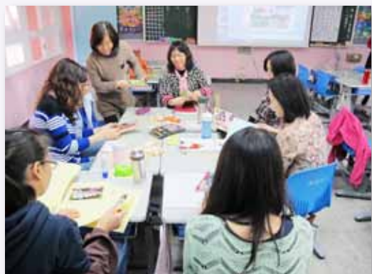
教師專業對話，精進課程教學