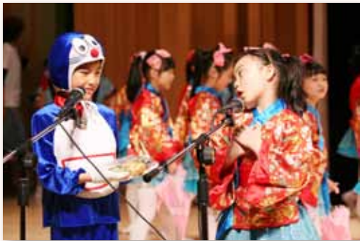
二年級孩子落落大方的主持