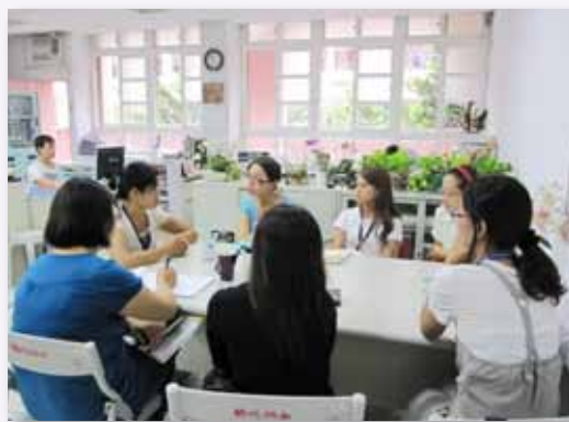
召開志工會議，關注學生身心發展