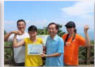
在二格山上領取登頂證書