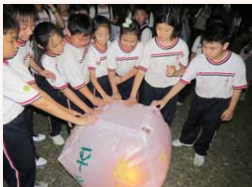
生活體驗營 - 放天燈

作繁忙、隔代教養或單親家庭結構弱勢學生，家庭對其課業與生活關注也顯得較少，學生的教育與照顧責任，相對依賴學校或是家中傭人、家教；因此整合學校資源，開發家長、校友及社會資源，規劃符合需求的課後學習課程、寒暑假學習營隊、安親班照顧，讓孩子有更全方位關照。