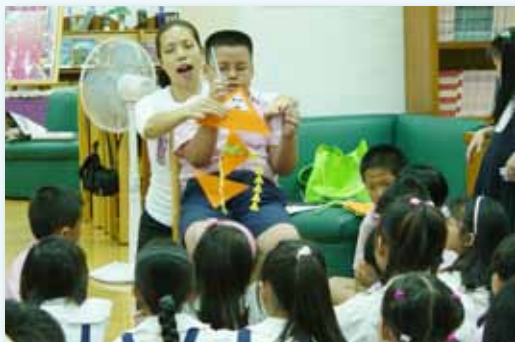
故事媽媽角色扮演說童話