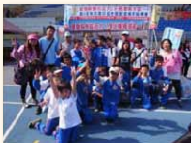
樂樂棒球隊榮獲冠軍 增強信心與興趣

提供學校特殊學生多面向之教育，除提供個別化教育計畫以及專業治療服務外，也全面性提升全校學生之特教知能；另外學校發展特色性課程，包含非洲鼓、打擊樂以及樂樂棒課程，期望透過多面向之學習，啟發學生不同之能力。