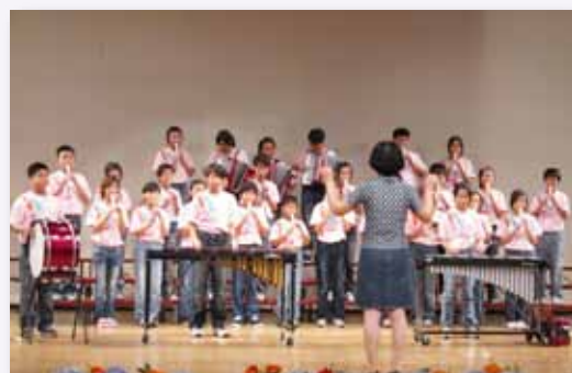
參加瑠公社區音樂會演出