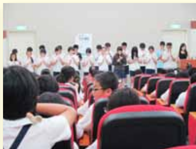
期末音樂學習成果發表