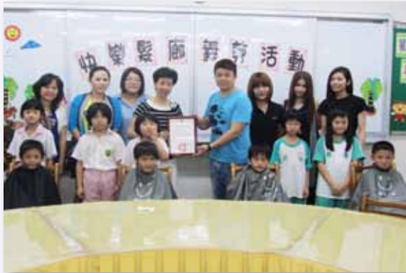
「快樂髮廊」義剪活動

改善、團體輔導、個案會議、飲食照顧、剪髮的容貌整理、夜光天使等學習資源與金援，評估學生的需求後，皆給予最適當的協助。