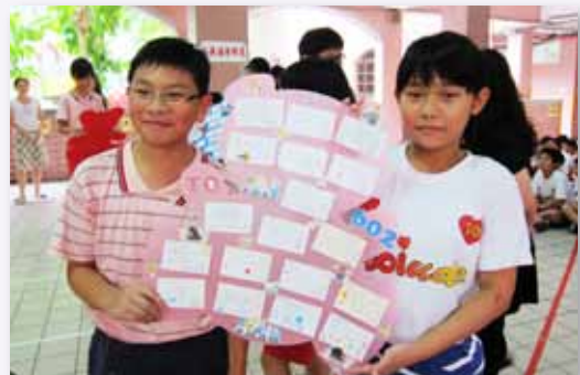
畢業前夕，畢業生與在校生互道珍重