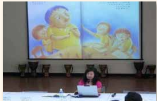
故事媽媽和家長分享如何親子共讀