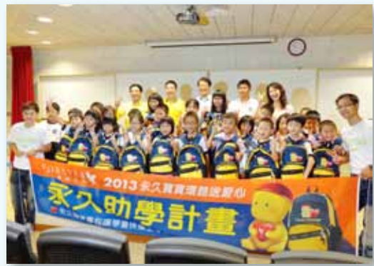
永久愛心書包助學計畫