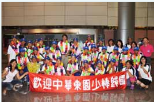
榮獲第七屆亞洲少棒錦標賽亞軍

成立棒球隊至今已 70 年的歷史，全校師生在棒球運動的發展上不遺餘力，深獲各界肯定與