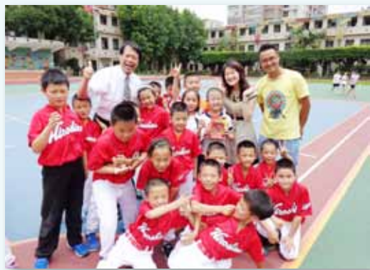
四川成都泡桐樹小學蒞校交流