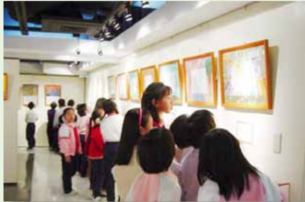
專業的藝廊提供作品展示

學校設校迄今即將邁入第 50 年，校舍建築與硬體設備逐漸老化不敷使用。在逐年汰舊換新的機會下，結合本校課程與願景，發揮藝文教育特色，邀請家長、教師、社區人士及專家學者共同參與規劃，因而打造別具特色的藝文校園藍圖，將藝文作品與校園建築融為一體，舉凡學校圍牆、外牆、泳池、無障礙電梯等處，皆能展現生活化的校園美學，發揮境教功能。