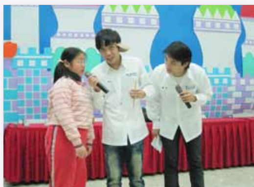
辦理友善校園反霸凌宣導講座