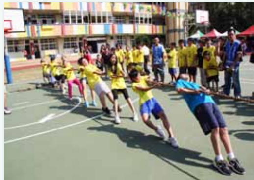
班際體育競賽－拔河總動員