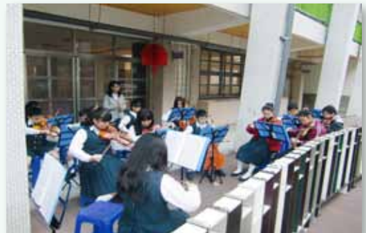
聖誕報佳音 - 傳遞幸福樂音