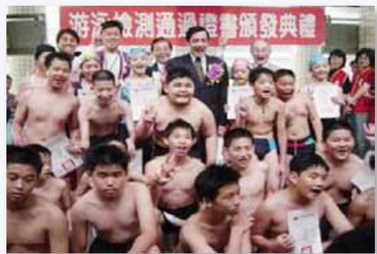
馬市長、教育局長蒞臨游泳檢測