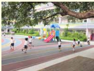
校園中跳繩的小朋友