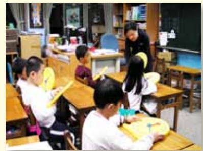
課後數學補救教學