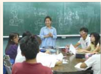
多樣性家長成長班 優化生活提昇品質