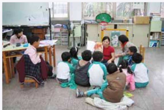
快樂成長班小團輔