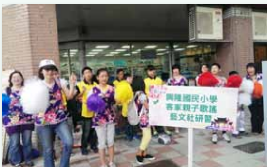
客家親子歌謠社踩街活動