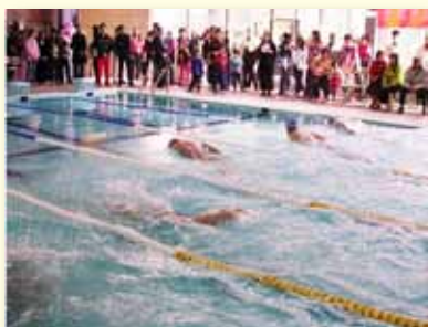
參加各項游泳競賽