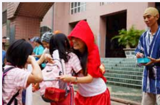
修德的每位學生都是我們的孩子