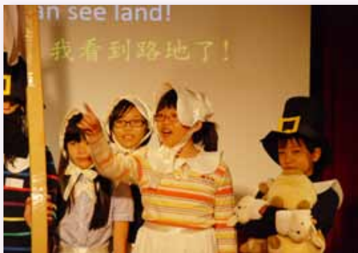
感恩節英文音樂劇表演

學校結合節慶活動，辦理各項才藝活動，如：敬師才藝表演、感恩節音樂英文感恩活動、歲末年俗闖關活動等，也透過參與育藝深遠藝術啟蒙方案、藝術家進入校園、畢業美展、多語文展演、作品展示等活動讓孩子們得以涵養藝文素養，表現自己的才能；除了藝文活動外，我們也辦理各項體育競賽活動，如：家族體育競賽、體育表演會、並參與教育盃五人制足球賽、樂樂棒球賽、健康操比賽、跳繩比賽、南區運動會、群組體育競賽活動等校際活動，讓孩子們透過校內外競賽活動的參與，來精進自我專長的學習動力，培養他山之石可以攻錯的奮發精神；此外，我們班級亦結合班親會辦理各項活動，如：草嶺龍門露營活動、假日親子河濱單車行、花東單車行、送愛心到原住民部落、愛心義賣、麥田見學等活動，來讓孩子們可以透過生活技能的訓練，培養生活自理能力外，也透過學習公益活動的規劃參與，培養孩子們推己及人，關懷他人的情操，更可透過體驗種植的過程，讓孩子們了解到「誰知盤中飧，粒粒皆辛苦」的道理，來培養愛物惜物的觀念。