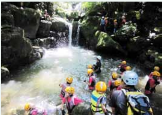
生命體驗美麗人生