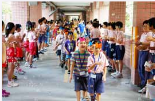
學長姊夾道歡迎我們小一新生到校

修德最美的風景是人情味，是家的味道。每每到校慶時刻，總有無數的畢業校友回娘家，與老同學敘敘舊或與昔日恩師互道感恩，回憶種種，每位修德人的嘴角總會泛起笑意。本校金燕校長常說：「修德的每位學生，都是我們的孩子」我們格外珍惜這份暖心師生情誼，打造溫馨的校園大家庭，這種師生間如同家人感覺，是我們未來最想延續下去的故事……。