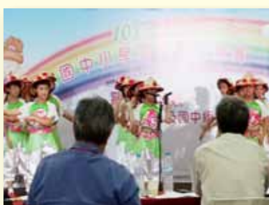
客家藝文競賽比賽實況