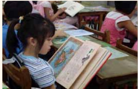
享受晨光閱讀時間