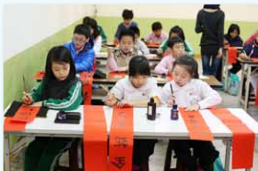
新春揮毫氣象萬千