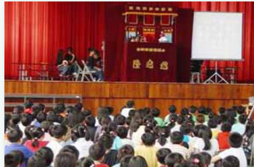
隆宛然掌中戲團 - 火焰山演出