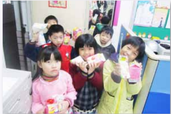
「亮點家族」愛心早餐