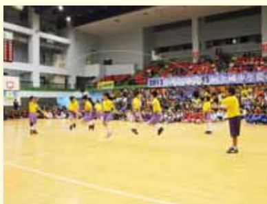
全國籃球賽開幕表演