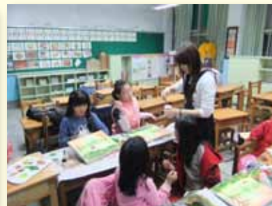
課後社團～美式休閒油畫