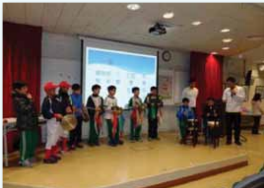
延樂軒樂團的展演學習

東園位屬臺北市社經背景較弱勢地區，孩子的學習刺激常僅由學校提供，家長們忙於生計，無心也無力給予孩子不同的體驗學習。有鑒於此，本校辦理將多樣性的課程引進校園，例如延樂軒北管樂團、臺北室內樂坊的展演、莫內印象展到校賞析、文山劇場的非洲鼓體驗、結合環保教育的洋蔥染布製作、安全教育的腳踏車騎乘教學、防災教育的知能實作，參與公共藝術計畫「雲豹」彩繪、及各項健康成長營養知能的認知宣導，孩子透過校內外資源，實際參與豐富有趣教育活動，讓生活與現代社會接軌，也獲得與臺北市其他區學童相同的學習資源。