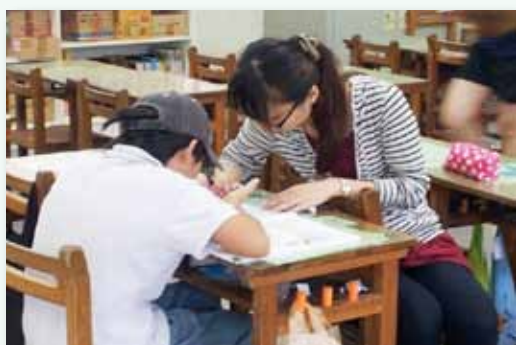
永齡姐姐課後補救