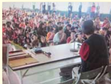
生命鬥士激勵輔導學生

資源班教師發揮教育大愛，對於瀕臨中輟學生，視如己出，關懷生活、課業、健康等，親自帶領參加各項活動，增進學生之信心與活力。結合教育局駐區社工、新北市高風險家庭通報系統，社區福利機構（勵馨基金會、新北市兒童人權協會、西門町夢想之家、六合學苑）及家長會力量不定期介入性輔導的實施，期待以點、線、面方式，張開輔導網，減少再輟因子。