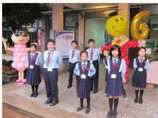
志工隊 - 接待來賓