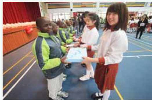
馬拉威圓通小學國際交流會