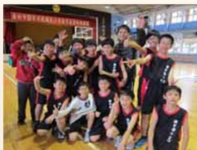
學生適性發展 建立信心與興趣