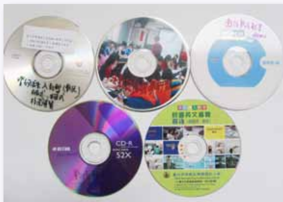
教師自製教學光碟

課程架構完整，無論是「水中蛟龍」特色課程、藝文領域課程、體育課程，整體規劃一至六年級縱向課程發展，由專業教師擔任教學，確實且有效教學，以確保不同專長的學生，皆能有發揮的空間、發展的機會。「水中蛟龍」方案在現有的體育課程架構下，從一年級開始落實學生游泳基本能力，達成每個畢業學生通過 50 公尺二式的高標準，在在挑戰我們的課程設計與教學。在不斷的對話下，修改調整課程，形成唯有結合現代科技設備始能有效達成的共識。因此，發展游泳教學光碟，縮短學生嘗試錯誤的時間；並進行游泳能力檢測，以確保學生游泳基本能力的落實。