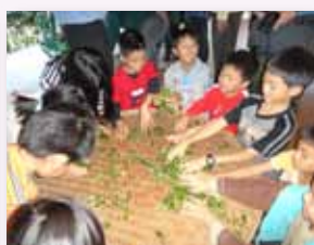
學習簡易採茶技巧