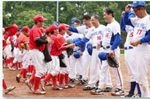
2013年兒童節與行政院老棒隊友誼賽