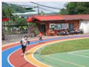
跑步 - 大隊接力

我們強化藝文與健體課程，依孩子們的興趣與學校特色課程來規劃專長認證項目，如：體育類別的跳繩、扯鈴、籃球、游泳和跑步，藝術類別的直笛、歌唱和書法等，將其融入領域課程實施，以發展體育技能及藝術人文的素養，精進孩子們的表現能力。