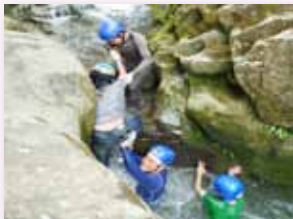
家族進行溪流體驗

透過完成溪流體驗活動，了解溪流活動安全事項，以家族提攜合作方式，進行實作溪流體驗，觀察溪畔景物，認識底棲生物，並進行定期水質檢測，實踐護溪行動，畢業前前進長江潭，以關懷溪流生命，培養學童體驗實踐的機會。