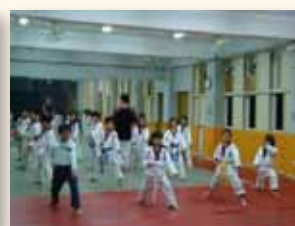
虎虎生風話跆拳道