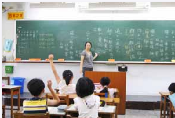
攜手激勵班孩子們踴躍發言