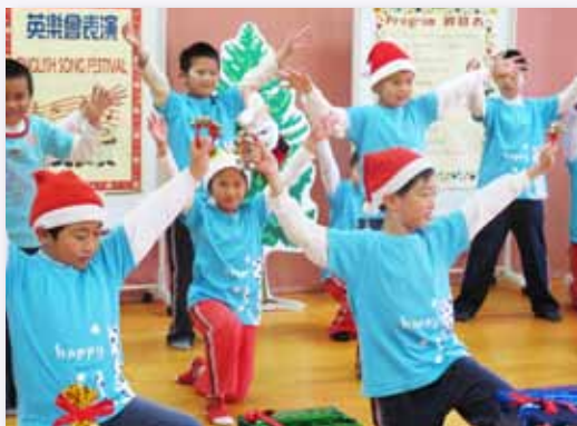
結合英語歌曲舞蹈的英樂會