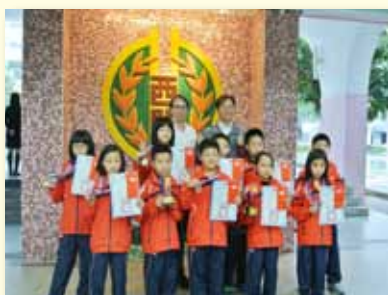
泳隊各項競賽屢獲佳績