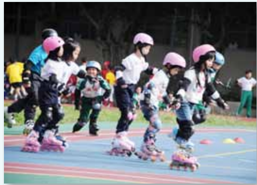
活力十足的直排輪社團