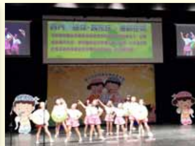
參加「嗨客小歌手」比賽