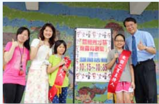
活潑多元的學生課間秀才藝