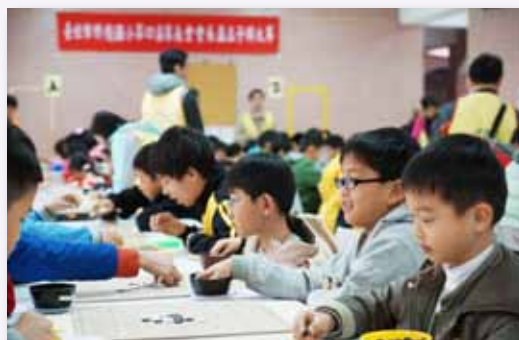
每年辦理五子棋大賽，寓教於樂