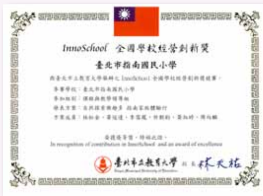
InnoSchool 全國學校經營創新獎