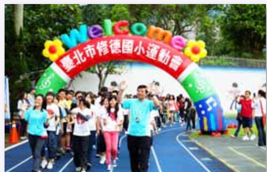
每逢校慶，總有許多校友回到這個家