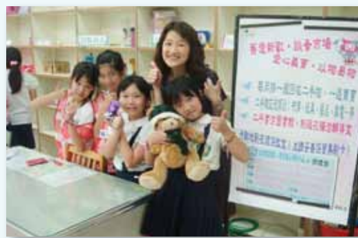
結合環境教育的東園好環保