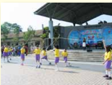
跳繩表演～展現學習成果