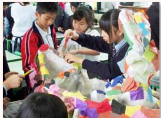
與蔡繼有小學共同創作