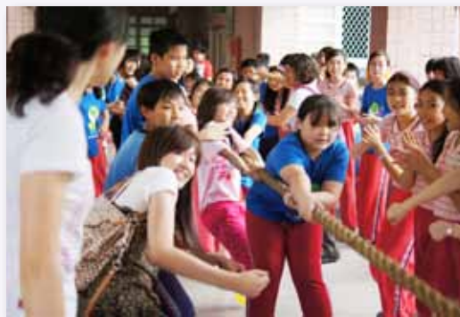
薪火相傳，五六年級拔河比賽