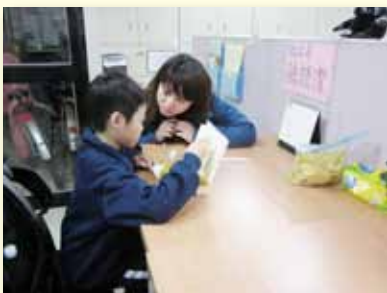
萬華區社工協助輔導