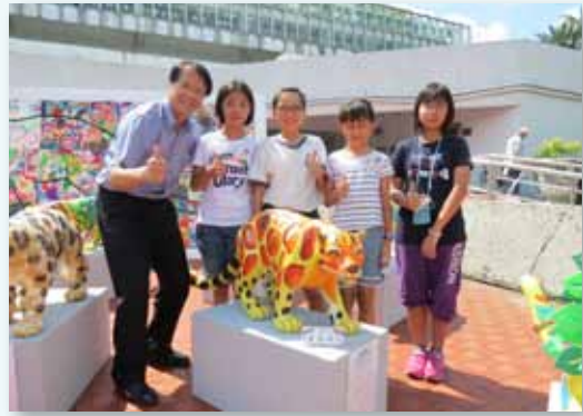
公共藝術計畫「雲豹」製作