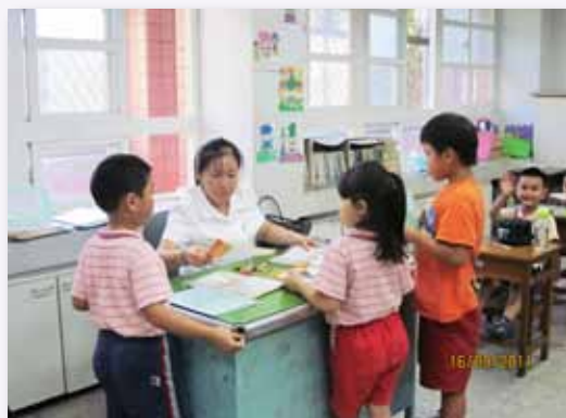
安心就學，辦理課後照顧到 7 點

我們遍尋學校資源、政府資源，主動協助申請，充分扶助弱勢家庭，發揮資源效益，照顧每一位需要協助的孩子與家庭。除內部資源外，我們並不以為足，積極接觸社區、社會公益團體，有效持續引進外部支援及社會資源，更全面關照低社經背景學生，並且機會教育，指導學生飲水思源，「吃果子要記得拜樹頭」，將來要成為能夠幫助他人的支柱。我們努力爭取家長夥伴認同合作，學校本身的力量有限，透過家長的參與，善的力量會如同漣漪般持續擴散，愛心爸媽無私的照顧我們修德的學子，一幕幕都成為修德最美的風景。