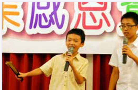
感恩餐會，師生同樂，學生大秀才藝