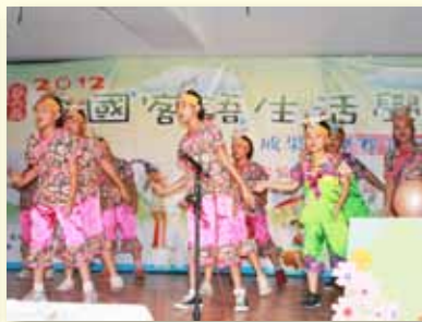
全國客語歌謠成果發表