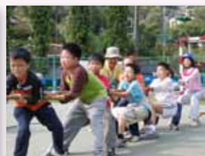
家族體育競賽活動