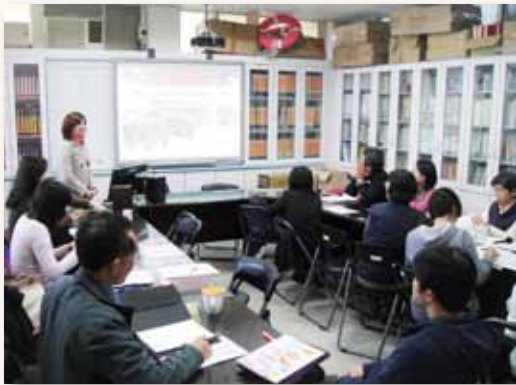
他校分享靜心國語文教學