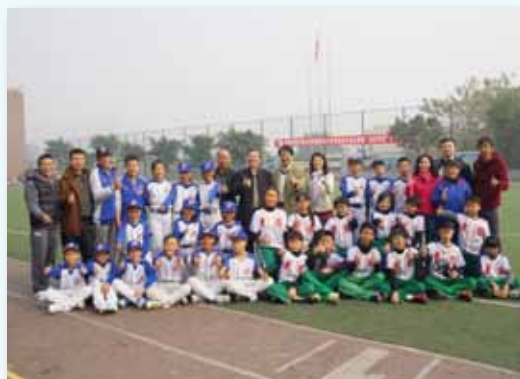
四川成都樂樂棒球交流賽