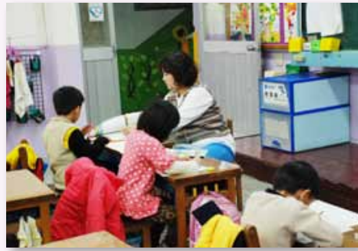
攜手激勵 - 進行課後輔導