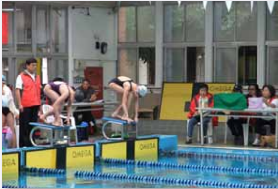
參加中小學聯合運動會