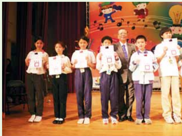
發展特色培育優秀學生

學校以發展「喜閱吉林」為本位特色課程，落實閱讀融入各領域教學活動，期以閱讀力提升人文素養。另實施全校性深度閱讀教學，逐年增置共讀巡迴書箱，每年級每班學生每學期至少可共讀 10 冊書籍以上。另因應數位學習時代來臨，92 學年度起，創設「吉林 e 作家」線上投稿系統，每月定期徵文，提供學生展現藝文學習成果的平臺，培養學生主動學習的態度。