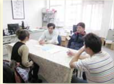
駐區社工師專業會談