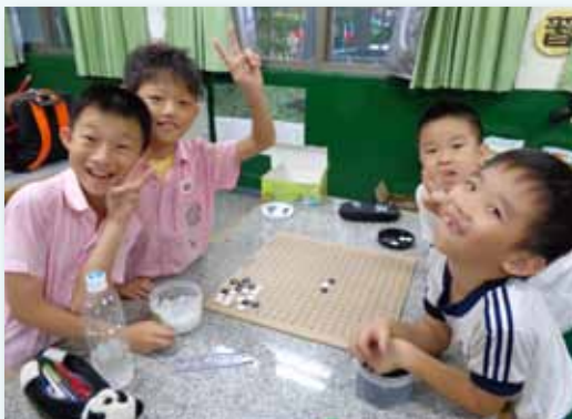
課外社團益智動腦的圍棋社

為了培養每位學生在體育運動與藝術方面的興趣與專長，配合持續發展的體育與藝術專長課程之階段目標，並實踐教育「111」的認證指標，融入課程與教學，透過學年領域教學研究會、課程發展委員會的凝聚共識集思廣益，編擬「東園學習護照」，將游泳、籃球、飛盤、田徑、直笛、演唱及美術創作等，列入健康與體育、藝術與人文領域課程中，並落實棒球校本課程，分年級進行教學。開設多種課外社團及才藝班，提供學生豐富學習場域，落實專長學習，並透過多元認證的鼓勵方式，激發孩子主動學習動力，自信展現羽翼漸豐的能力。