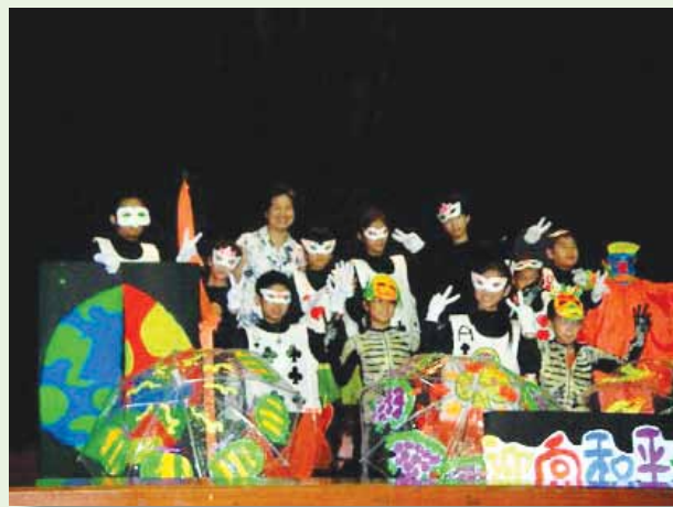
黑光劇團名聞遐邇