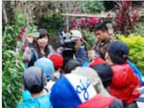
進行步道自然探索

透過探索步道山岳、社區人文，學習閱讀社區地圖，合作進行步道探查，並進行體力和知能自我挑戰，來深化學童環境知能，並培養愛護環境的行動力。