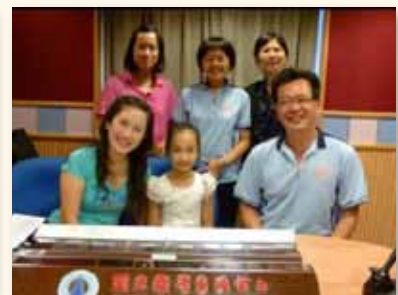
師生受邀參加教育廣播電台錄音 分享閱讀喜樂