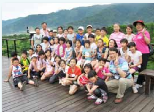
台東美和國小校際交流