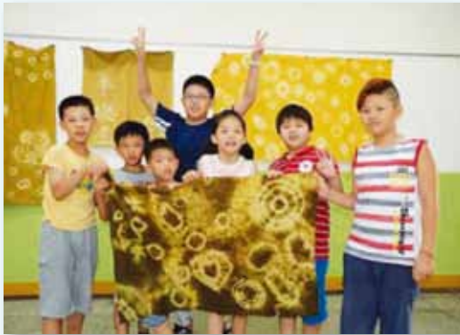
結合環境教育洋蔥染布製作