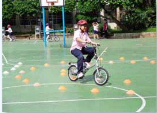
腳踏車騎乘安全訓練