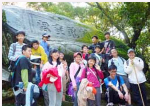
草嶺－龍門露營活動