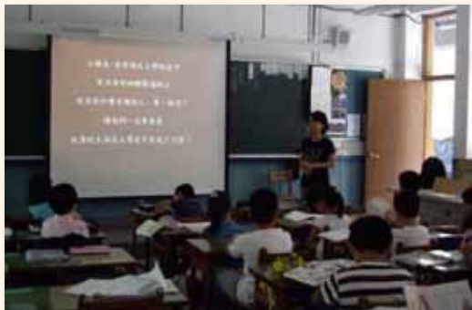
故事媽媽入班說故事

學校的閱讀要深耕，除了老師、圖館志工外，還有一群默默奉獻時間、心力與智慧的故事媽媽們。她們在校園的各個角落，傳遞品格、生命與正面的價值觀，擔負起潛移默化的任務。學期中為小朋友說故事，引導孩子開展多元智能，以詩歌、圖畫、表演等創作方式，與心對話、學習感恩、人際互動。興華的故事媽媽與學校共同努力，開啟了孩子們另一扇窗，豐富孩子學習內涵！