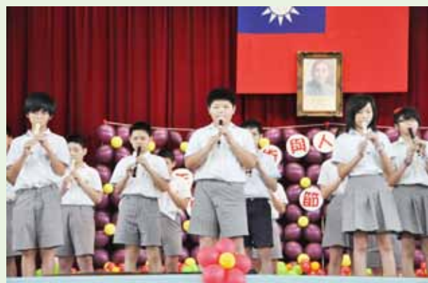
展現專長的才藝發表會

教育 111 在我們學校已經展現成效，也普獲學生家長們的肯定與鼓勵，相信在這個良好的基礎上，加上團隊成員的努力，必能時時精進，再創學校最大價值，將涓滴資源細流匯成江河，提供孩子們一個適性發展的優質學習樂園，邁向優質學校的理想目標。