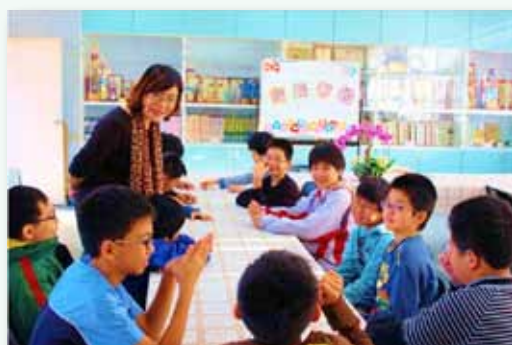
貼近距離與校長有約