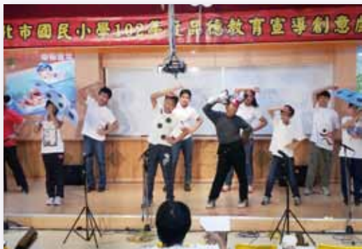
品德教育戲劇演出，培養未來公民

有鑑於教學時數有限，而需要讓孩子知道的事卻越來越多，我們必須持續橫向整合各項課程，讓國語、數學、社會等各領域不只是傳統知識上的傳授，能更系統化培養讓孩子能真正帶著走的能力，面對多變的未來。各學年間強化縱向的連結合作，發揮協同教學的功效，讓大孩子也能帶著學弟妹一起來學習，形塑學習共同體校園氛圍。