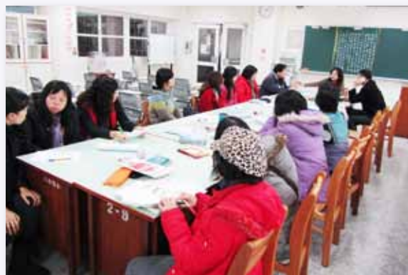
中輟校外資源輔導會議