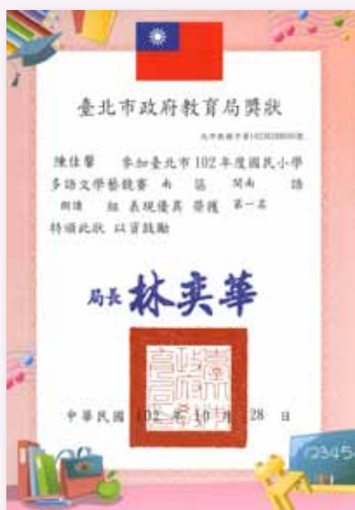
臺北市閩南語朗讀第一名

不僅弱勢孩子得到全面關照扶助，我們的孩子在各項校外表現亦有卓越傑出的多元展現，例如：參加臺北市 101 及 102 學年度多語文競賽分別獲得臺北市閩南語朗讀第一名、原住民卑南語朗讀第一名，國語朗讀、卑南語歌唱、英語演說、閩南語朗讀、閩南語演說、閩南語歌唱、卑南語歌唱等比賽獲得優等之肯定；而卑南語朗讀更獲全國賽第二名；除了校外的多語文競賽外，我們的孩子在臺北市音樂比賽，亦榮獲直笛獨奏第二名，充分展現學生多元能力之優異表現。