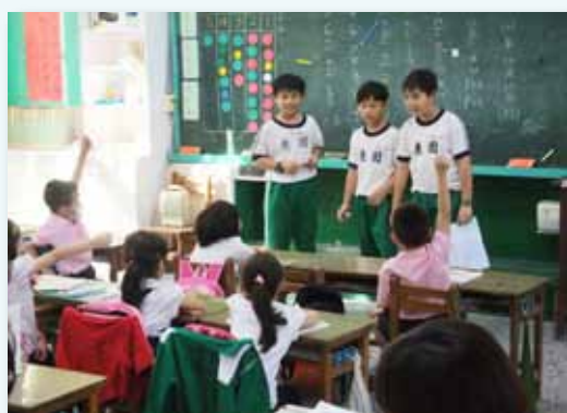
高年級到低年級童話同話

三到六年級的校際交流至台東、澎湖等地，也實際與當地孩子入班學習，感受不同的教室風景，能與同年齡的孩子對話互動，童言童語的真摯情意，縮短文化的差異拉近彼此距離。交流結束後，孩子總是收穫滿行囊也成長許多，不僅提升自我照顧能力，亦能更加珍惜周遭的人與情。