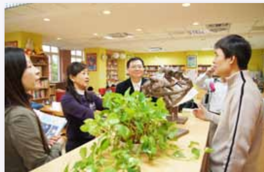
教育局林局長蒞校參觀藝術校園