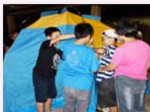
家族一起學習求生知能

一到六年級混合編組，發展家族課程、生活智能，完成各項闖關體驗活動，進行家族薪傳及感恩，以落實學童合作學習，並培養領導與自主學習的能力。