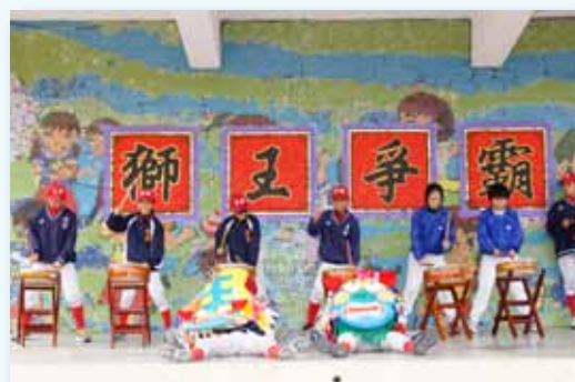
歡喜熱鬧的獅王爭霸賽