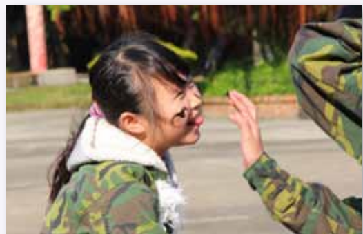
健康快樂成長，共度修德美好時光