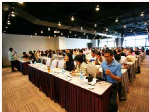
教師團體動力營 - 經驗傳承