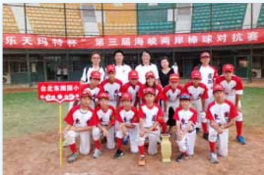
102 年榮獲海峽兩岸棒球對抗賽冠軍