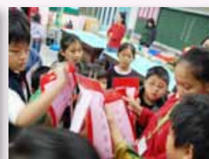
家族腦力激盪拼詩圖