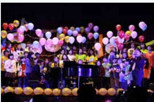
感恩音樂會 Any dream will do