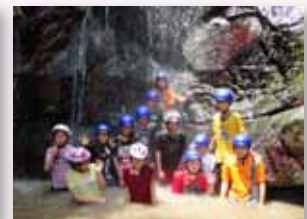
畢業前長江潭再體驗