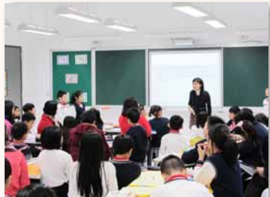
弘立書院 - 語文觀摩