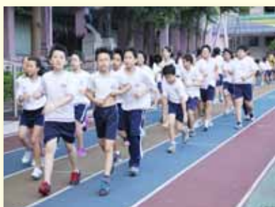
晨間運動～羚羊跑步活動