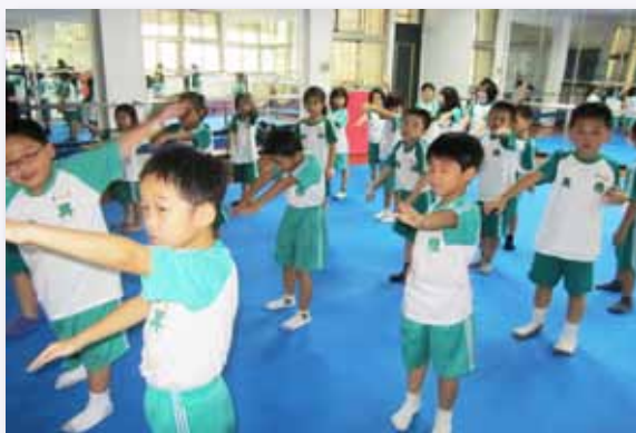
低年級游泳教學 - 划手