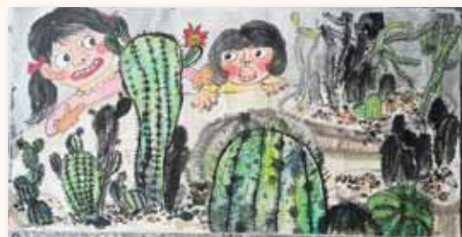
全國學生美展中年級水墨優選一名