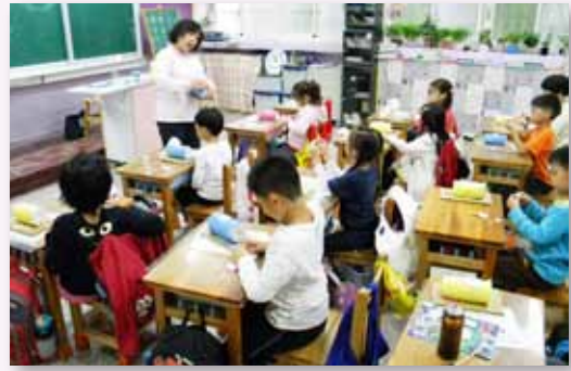
低年級課後班紙黏土創作