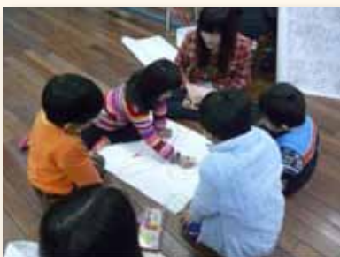
團輔課程激發學生潛能 適應學校生活