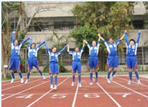
修建的操場讓我們伸展跳躍

安全溫暖的環境，是孩子樂於向學的基本要件，融合親師生的觀點，打造良好學習情境，使其在學習過程中充分獲得保障。百年的建築有其文化歷史，但透過時代變遷，物換星移後，仍須積極改造以符應現代教學需求，讓學校的每一處都可學習，操場的整建、生態菜園的萌芽、替代禮堂「樂育堂」的落成、樓梯圖書角的規劃等，透過正式課程的施教與潛在課程之薰陶，豐富孩子的視覺感官學習刺激，創造溫馨關懷的校園氣氛，讓學校展現新風貌。