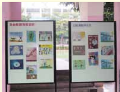
學習成果~主題海報展