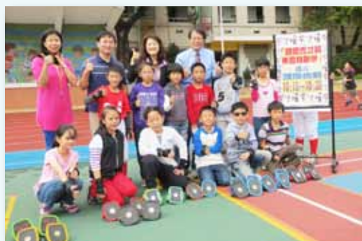
課間秀才藝飄移板表演

東園國小位於萬華的「加納地區」，經過百年時間孕育無數學子，在地的商家多為我們的校友，對於東園的發展與進步付出相當多的關懷。舉凡交通導護、圖書志工、故事爸爸媽媽、校園綠美化、保健醫護、大型活動維護等義務協助的志工，都是東園社區人士的投入；學校慶典中，常出現的舞獅團，更是東園校友對母校的回饋，對社區愛護的展現；東園棒球隊悠久的歷史，孕育許多棒球好手，已是爺爺或伯父級的學長也常給予小學弟們指導與支持，改善棒球的訓練環境，讓孩子學習更安心，比賽的實力得以完全發揮。學校社區共榮共好，展現彼此合作的良善關係。