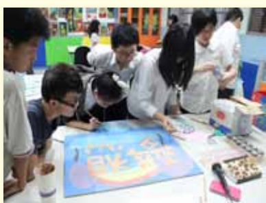
藝文課程～分組彩繪瓷磚

我們以「在正式課程中學習為主軸，輔以課後社團、團隊深化與精進，並提供多元機會展現，予以肯定，進而能從展演、競賽中獲得表揚與激勵」的方式培養學生的專長能力，因此，我們落實體育和藝文領域的課程與教學，提升體適能，培養藝術素養，使學生普遍參與，同時開辦不同類型的課後社團、運動團隊、學藝活動等，兼重學生課外的學習，提供選擇和嘗試的機會，探索自我潛能，鼓勵長期從事有興趣的活動，發展認知領域以外的各類專長。