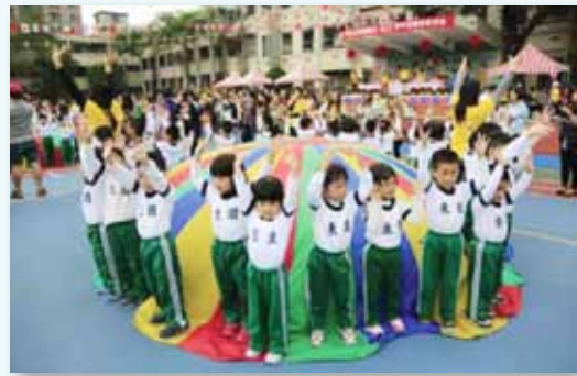
體育表演會活潑可愛