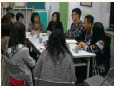
進行社區聯繫會議 共同商討輔導策略