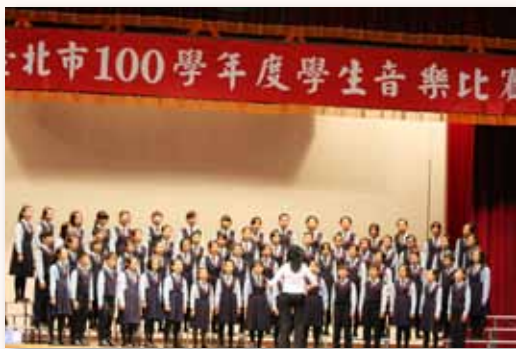
五項藝術競賽合唱團