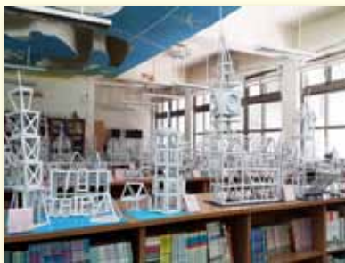
學習成果~紙角鋼作品展