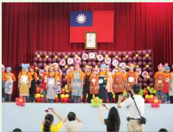
學習才藝發表展現活力