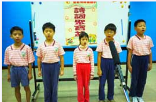
詩詞聚寶盆活動，體驗古文之美