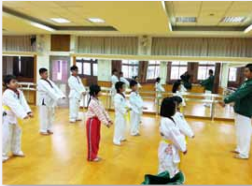
虎虎生風的跆拳道課外社團

孩子。我們知道，孩子們並非能力不足，有時候只是缺少一點點的支持，只要給予適當的機會，他們在舞臺上一樣的耀眼。協助孩子們建立自信，參與團體演出，同時建立豐富知能、正確技能、良好表現與自信態度，培養每位學生都能具備藝術或運動專長。