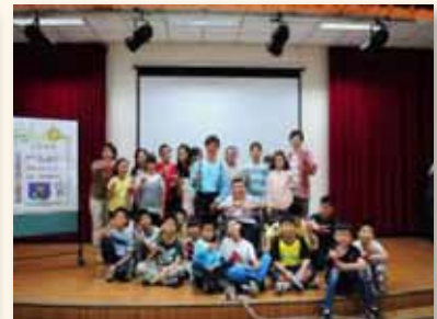
落實各項教育宣導達到型塑品格成效