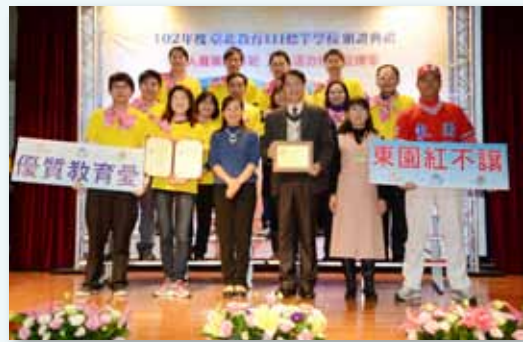
102 年榮獲臺北教育 111 標竿學校認證