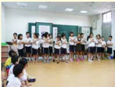
學年才藝表演會歌唱秀

規劃各項學藝競賽、才藝表演、節日展演、藝文展覽、學習成果展等活動，提供孩子各種展現學習成果和表現自我的舞臺，勉勵學生把握參加各類校內外競賽、展覽與表演的機會，勇於參與，從過程中學習自我激勵，累積經驗，逐步厚植實力，就能享受進步和自我突破的成就感，漸進邁向達成自我實現的康莊大道，在人生過程中享有優質的休閒樂趣，並能從中獲得終身學習的樂趣。