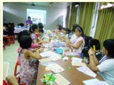
夏令營～自製唸謠手工書