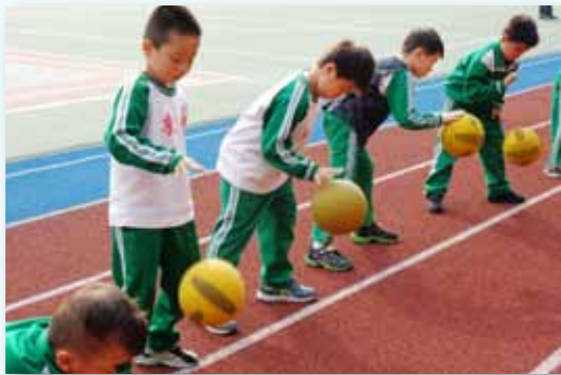
一年級班際拍皮球比賽

配合體育課程的安排，分年級進行班際體育競賽，也結合東園學習護照進行，一年級為拍皮球比賽、二年級為跳繩比賽、三年級為躲避球比賽、四年級為飛盤擲遠、五年級為樂樂棒球比賽、六年級為籃球三對三比賽；孩子在學習體育課程的同時，能設定學習目標，刺激學習動力。每天進行班級跑步運動，並以「超越巔峰登山好手」為藍圖，按年級以台灣的高山為主題，讓孩子每月跑完該座山的高度，按月挑戰，增進跑步活動的趣味化及挑戰性，體適能檢測時也發現孩子的心肺耐力確實提升；每週課間活動定期的健康操施作，讓孩子在室內課程後有活動筋骨，大聲吶喊宣洩體能的機會。