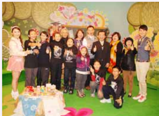
民視「特色校園我最讚」節目錄影

我們以學生為主體的體驗學習特色課程，屢獲媒體報導肯定，如：2012 年麥田見學成果發表獲得聯合報等 19 個媒體報導；2013 年我們的特色課程獲蘋果日報採訪報導外，民視「特色校園我最讚」節目亦主動邀約採訪製作節目，此外，我們結合環保局水巡守計畫的溪流課程，亦受聯合報、自由時報等新聞媒體採訪報導，在在肯定我們利用指南自然環境中的素材如「溪流玩石、登山步道、蟲鳴鳥叫、招蜂引蝶、寺廟藝術、茶飲文化」所展現出來的特色課程。