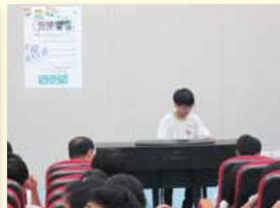
才藝發表~鋼琴演奏