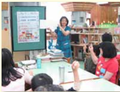
學習型家庭親子共讀

積極爭取各項經費辦理學生展能活動，提供學生學習舞臺，以安心就學溫馨輔導方案補助弱勢學生就學；設置教育儲蓄戶專戶，透過教育部專案網站募集愛心捐款，提供弱勢學生生活所需；傑出校友並提供弱勢展能專案經費，補助未符合教育部「攜手班」資格學生參與課後學業補救；爭取臺北市家庭教育中心專案經費，辦理「學習型家庭方案」包括：親子共讀、親子共學、家庭分享日、親職講座及親子旅遊等活動；辦理各項體育及藝文營隊，包含足球營、籃球營、書法營等，鼓勵弱勢學童參加；爭取「世界和平會」經費贊助，辦理弱勢學童營養早餐方案。