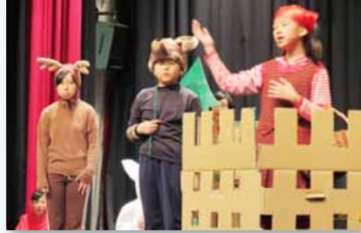
兒童節音樂劇展演