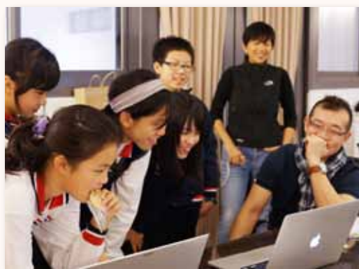
網界博覽會 - 人物訪談