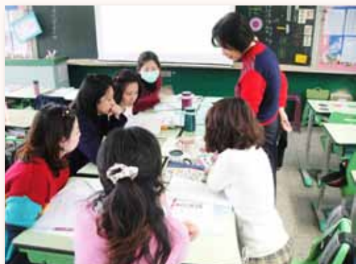
教師專業成長會議