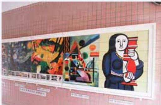
學生仿藝術大師作品的集體創作

教育部將 103 年定為我國美感教育年，開始推動「美感教育第一期五年計畫」，讓藝術教育資源整併，透過教育部推廣至各級學校，將美感種子播種至各級學校與社會，將美感意念傳遞至每位學生、教師及國民心中，進而建造一個美感普及的美力社會。一向重視藝文教育的我們，除了持續推動美感教育各項課程，將逐次加入人文經典，例如詩歌朗誦、古典音樂、畫作欣賞等，建置「藝術大師」系列課程，藉由夙昔藝術典範，深化孩子藝術鑑賞層次，開啟美育視界，豐富文化素養生活。