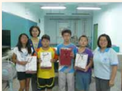
提供弱勢學生餐點服務及 寒暑假餐券