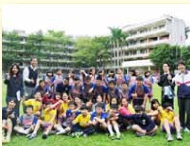
中正盃民俗錦標賽頒獎