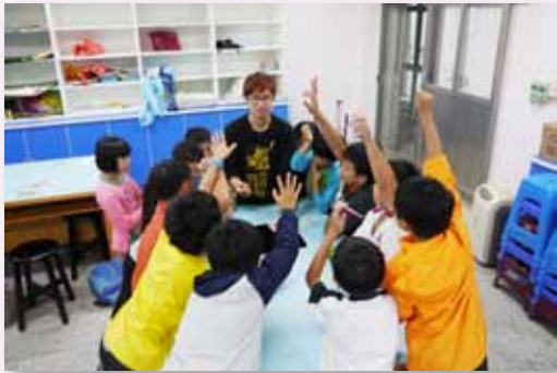
魔術社上課熱烈討論的情形