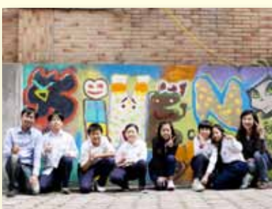
藝文專題研究～塗鴉創作