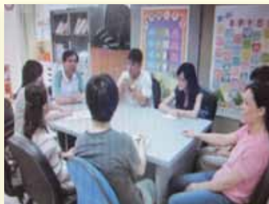
辦理認輔會議輔導學生