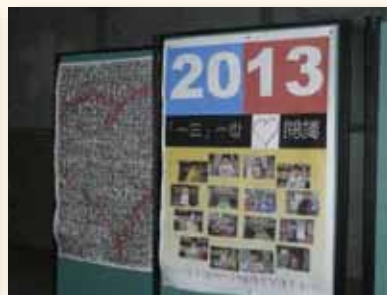
一生一世愛閱讀書香活動