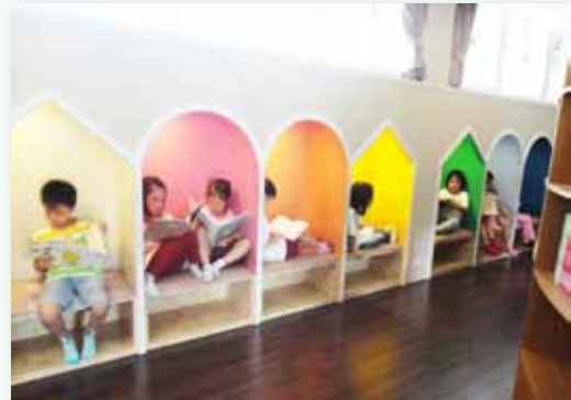
學童親書愛書培養閱讀習慣