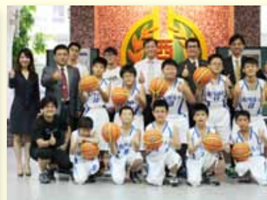
運動團隊～籃球隊獲贈球