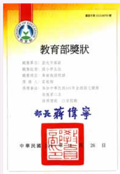
全國卑南語朗讀第二名