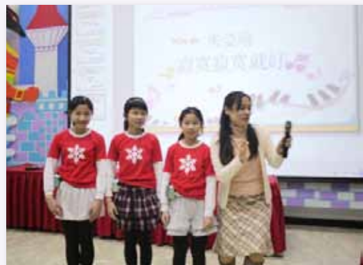
修德星光大道，學生也能成為大明星