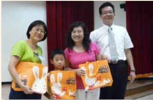
新生閱讀起步走鼓勵親子共讀