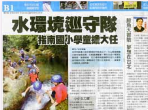
中國時報 - 水環境巡守隊報導