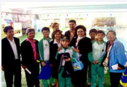
泰國參訪團參觀游泳教學