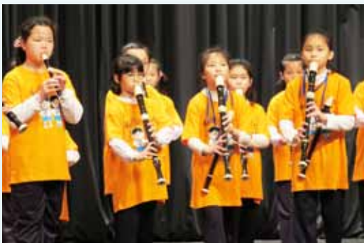
優雅精緻的直笛團