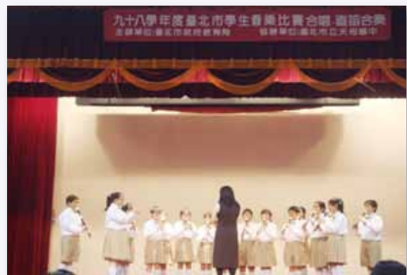
直笛團參加臺北市音樂比賽