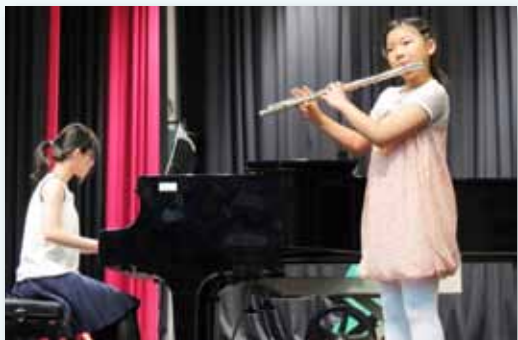
兒童才藝長笛演奏