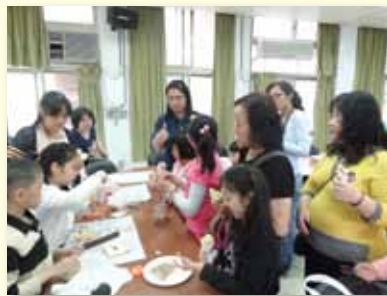
學習型家庭分享日