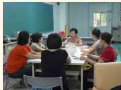
新移民親職讀書會相互支持共同學習