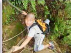
五年級猴山嶽攀爬