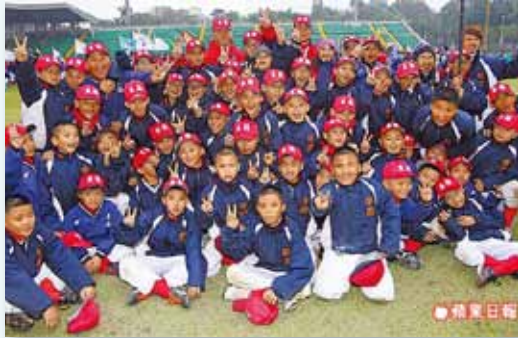
2013年諸羅山盃參賽獲媒體報導