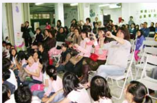
家長參觀教學日，參與孩子成長