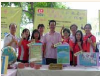
參與臺北市親子閱讀闖關活動

學校特色課程「閱讀」曾榮獲教育部教學卓越獎銀質獎，並將閱讀教學成果匯集成冊，由遠流出版社出版「打開一本書」共 3 冊，不僅建構了深度閱讀的基石，提供全國深度閱讀教學指南，更