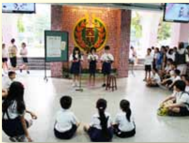
西門街頭藝人~直笛合奏