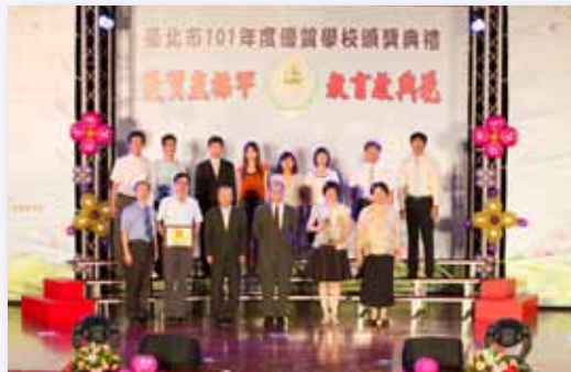
屢獲北市優質學校獎項，深受肯定