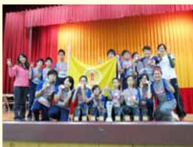
101 年西區運動會頒獎