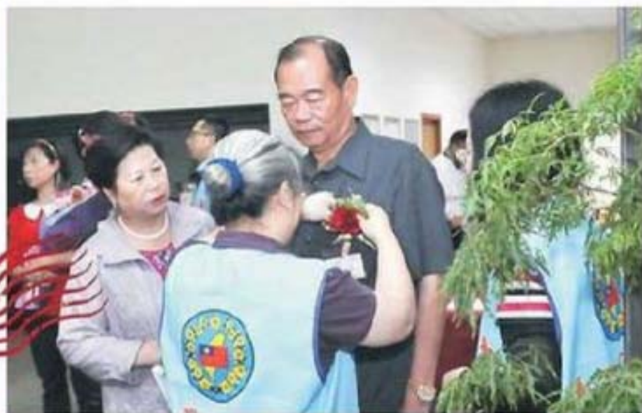
縣市芳草人物代表報到情況