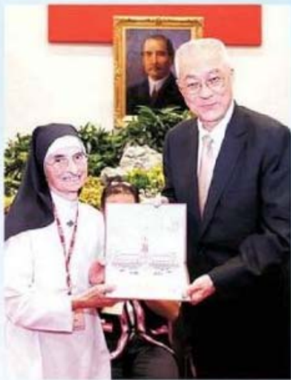
吳副總統(右)致贈紀念品，由新竹縣尖石鄉趙秀容修女(左)代表接受。

最後，吳副總統亦對臺灣省政府工作同仁戮力辦理此項敦風勵俗，非常具有意義活動，表達肯定與嘉勉之意。