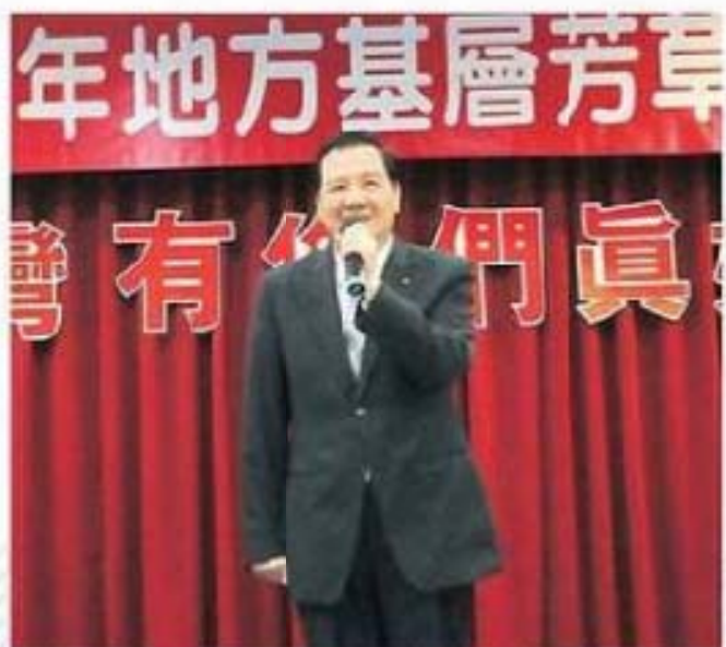
新竹市許明財市長蒞臨致詞