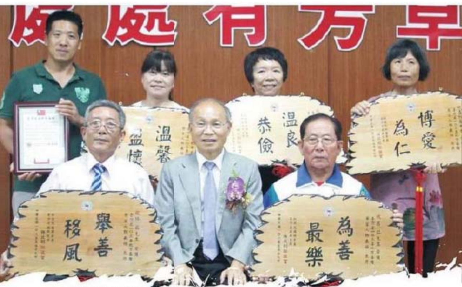
103年地方基層芳草人物