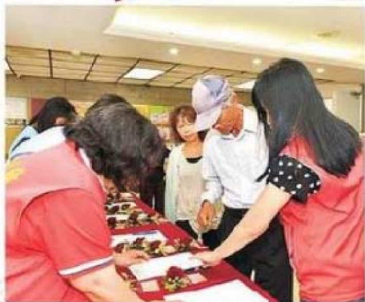
芳草人物代表陸續蒞臨報到