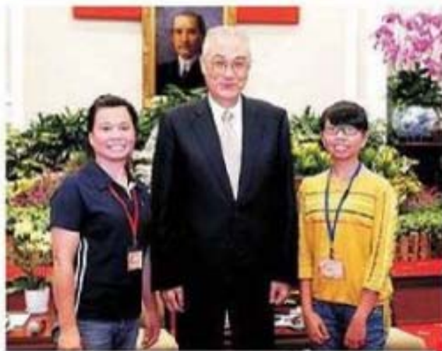
吳副總統接見澎湖縣湖西鄉陳麗妃女士及女兒 合影留念