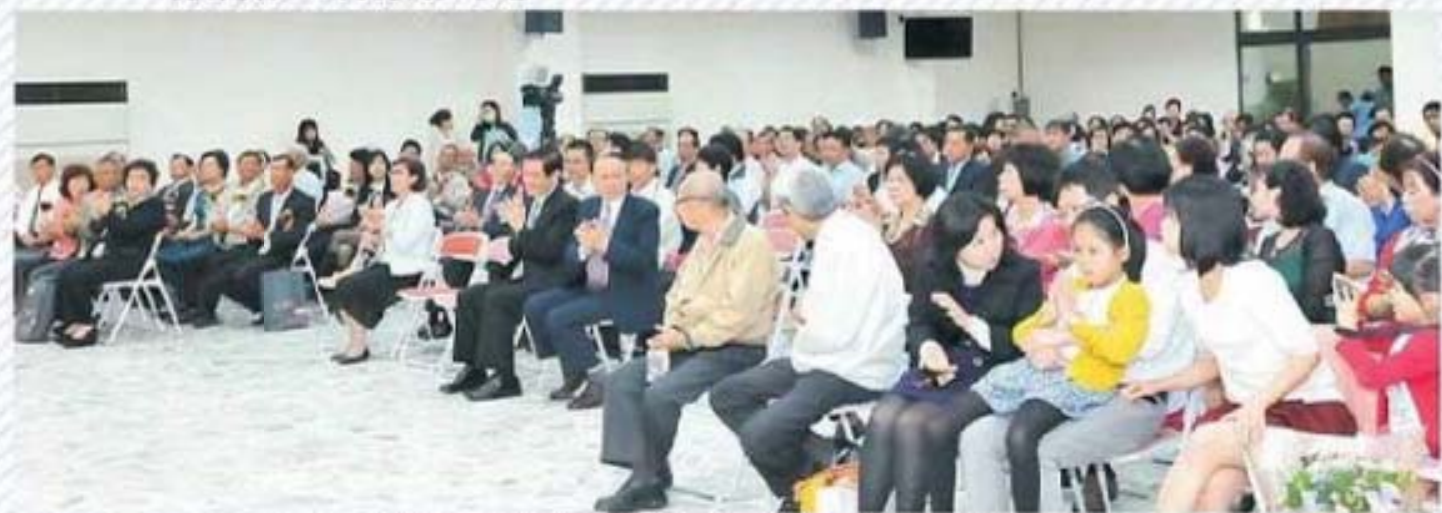
芳草人物代表及親友參加表揚活動踴躍出席情況