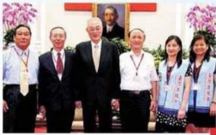
吳副總統慰勉省府工作同仁辛勞，與簡俊雄副秘書長（左2）、廖登枝組長（右3）、賴國隆科長（左1）、劉致蘭科長（右2）、林秀貴科員（右1）合影留念。