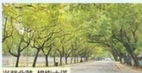
光榮北路 樟樹大道

樟樹(Camphor Tree - 學名Cinnamomum camphora (L.) Presl.)