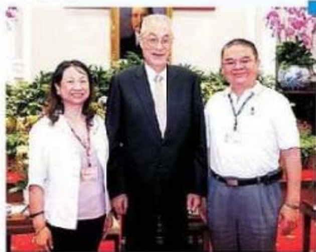
吳副總統接見嘉義縣朴子市余芳珠女士賢伉儷 合影留念