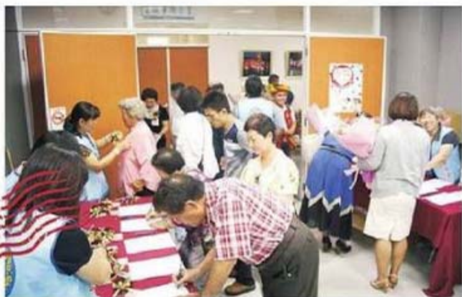
芳草人物代表報到熱烈情況