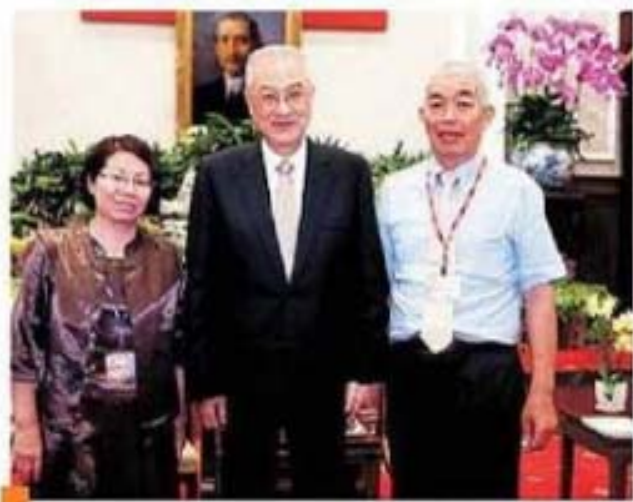
吳副總統接見嘉義市東區盧朝南先生賢伉儷 合影留念