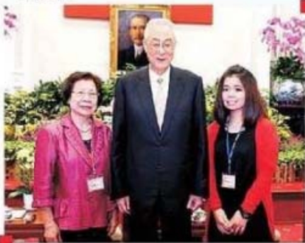
吳副總統接見臺東縣臺東市莊麗馨女士及孫女 合影留念