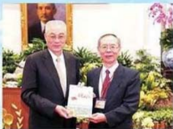
吳副總統(左)接受臺灣省政府編印之「102年臺灣省196位基層臺灣人善行義舉事蹟及座右銘專輯」，由省府簡俊浚副秘書長(右)代表敬呈。

社會就能和順，而在與人相處上，人我和敬，自然就能夠社會和諧，達到世界和平的目標。此外，慈濟證嚴上人也曾說過心田要多播善的種子，因種善因將能得善果，期藉由所有獲表揚者的善行功德，匯成一股清流，拋磚引玉，做為改善社會風氣的動力。