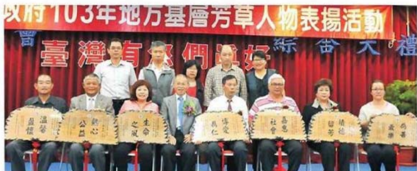
臺灣省政府林政則主席與基隆市七位芳草人物代表及親友合影