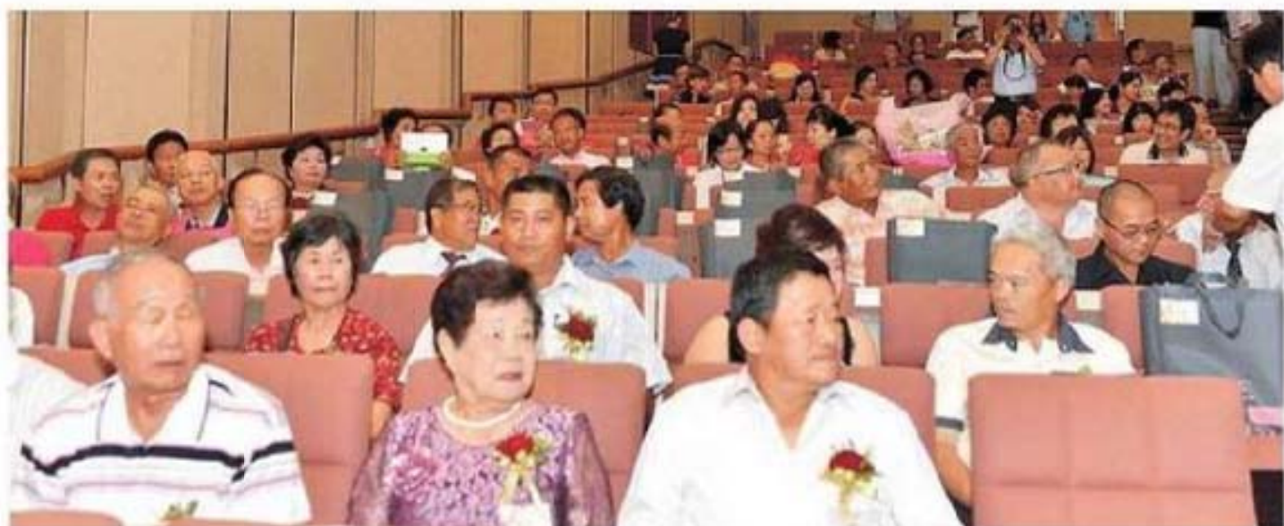
芳草人物代表及親友踴躍參加坐滿會議廳