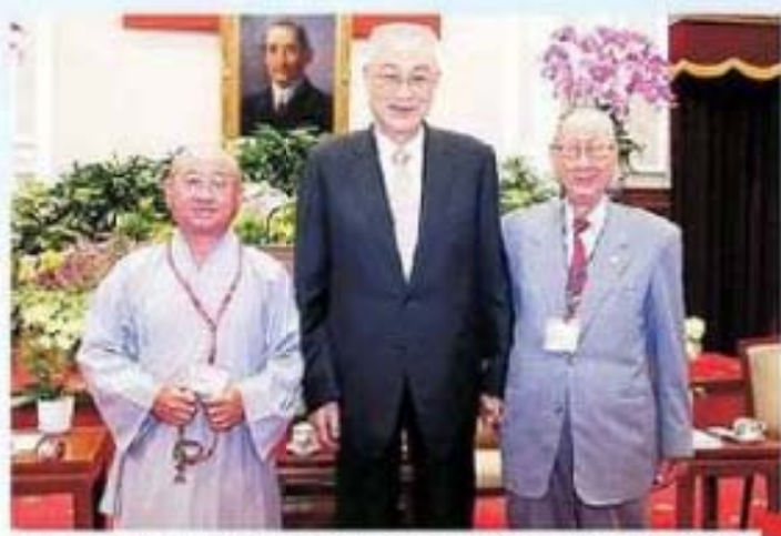
吳副總統接見花蓮縣富里鄉釋傳開師傳及其父合影留念