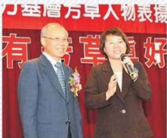
嘉義市黃敏惠市長蒞臨致詞表示，肯定芳草人物代表不求名，不求利，以服務為目的事蹟，令人欽佩