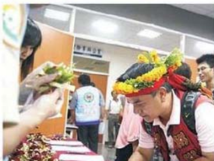
原住民芳草人物代表穿著傳統服裝參加表揚更有不同氣氛