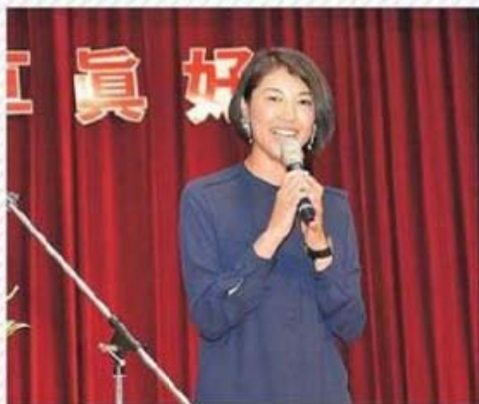
南投市許淑華市長代表所有鄉鎮市長對 省政府辦理芳草人物表揚活動予以讚許