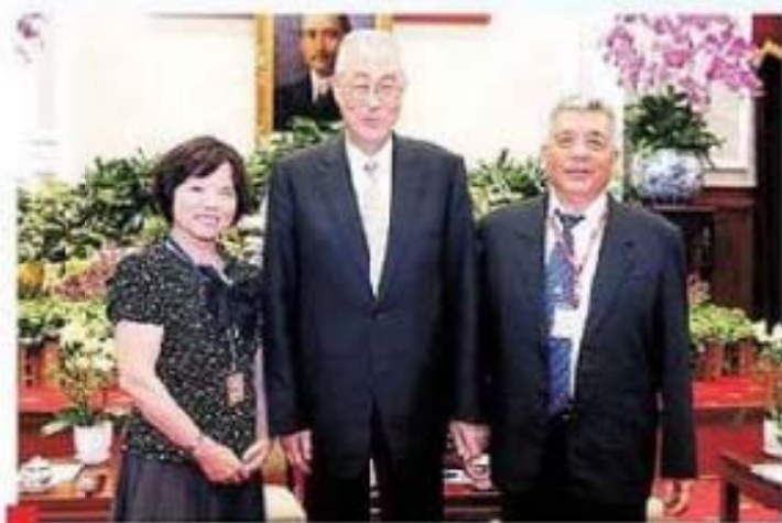
吳副總統接見南投縣竹山鎮楊非武先生與李友合影留念