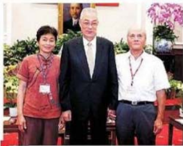
吳副總統接見新竹市東區呂芳添先生賢伉儷 合影留念