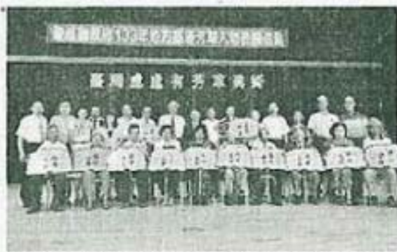
南投縣基層芳草人物全體受獎人與林政則主席（後排右8）、南投縣代理縣長陳志清（後排左8）合影。

化縣新聞記者公會常務理事、中華文化經濟生技交流協會榮譽理事）及各電視臺、廣播、平面媒體記者、貴賓均踴躍參加前來道賀。 馬總統曾表示：「行善可以不高調，但是揚善不能低調」，唯有進行善者的事蹟廣為周知，方能引起社會大眾效法，達到轉移風化的功能。總統稱讚各位代表的善行義舉：「不是大人物，但做大事情！」每位都是最佳代表人選，也印證「臺灣最美麗的風景是人」。 林主席表示：臺灣省政府為彰顯基層優良公益事蹟，讓好人出頭，希望藉由此活動表彰在社會角落默默行善的義舉，並將芳草人物代表的善行公諸報端，留傳後世，讓社會大眾鼓掌稱頌及後世子孫學習效法，藉以匯成一股清流改變社會風氣，使我們的社會充滿愛心和感恩氛圍，所有代表們奉獻社會公益成就，可謂功德圓滿，足資表揚。