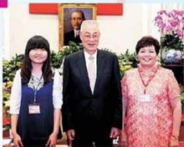
吳副總統接見南投縣尚友市黃李濟女士及孫女 合影留念