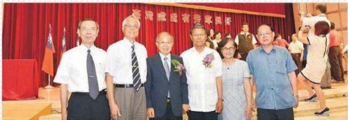
臺灣省政府林政則主席與林源朗國策顧問夫婦(右3)、陳志清代理縣長(左2)、省府簡俊淦副秘書長(左1)、鄭培富秘書長(右1)合影。