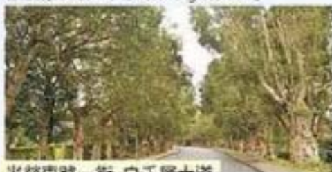
光榮東路一街 白千層大道

白千層(Pine-tree - 學名Melaleuca leucadendra Linn.)