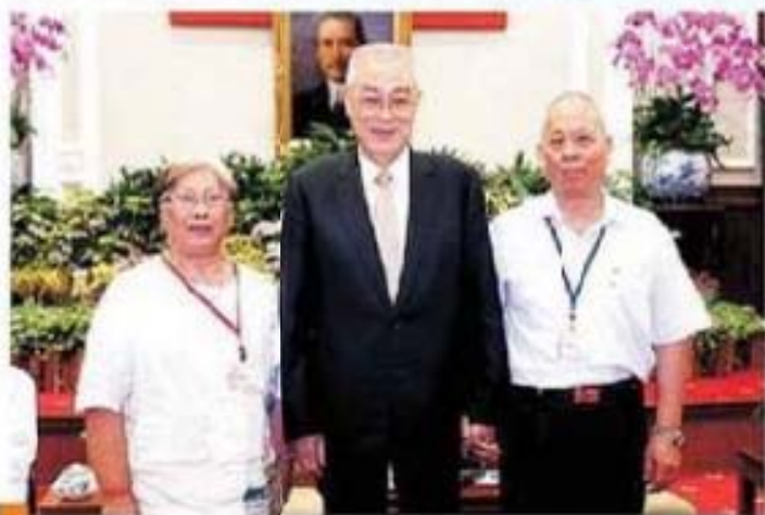
吳副總統接見屏東縣枋山鄉董燕美女士及其弟合影留念