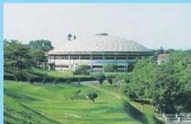
中興體育館(小巨蛋) Zhongxing Stadium(Mini Dome)