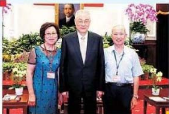
吳副總統接見宜蘭縣礁溪鄉林麗珠女士賢伉儷合影留念