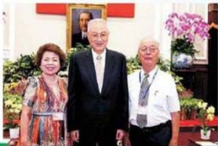
吳副總統接見苗栗縣三灣鄉陳靜珠女士賢伉儷合影留念