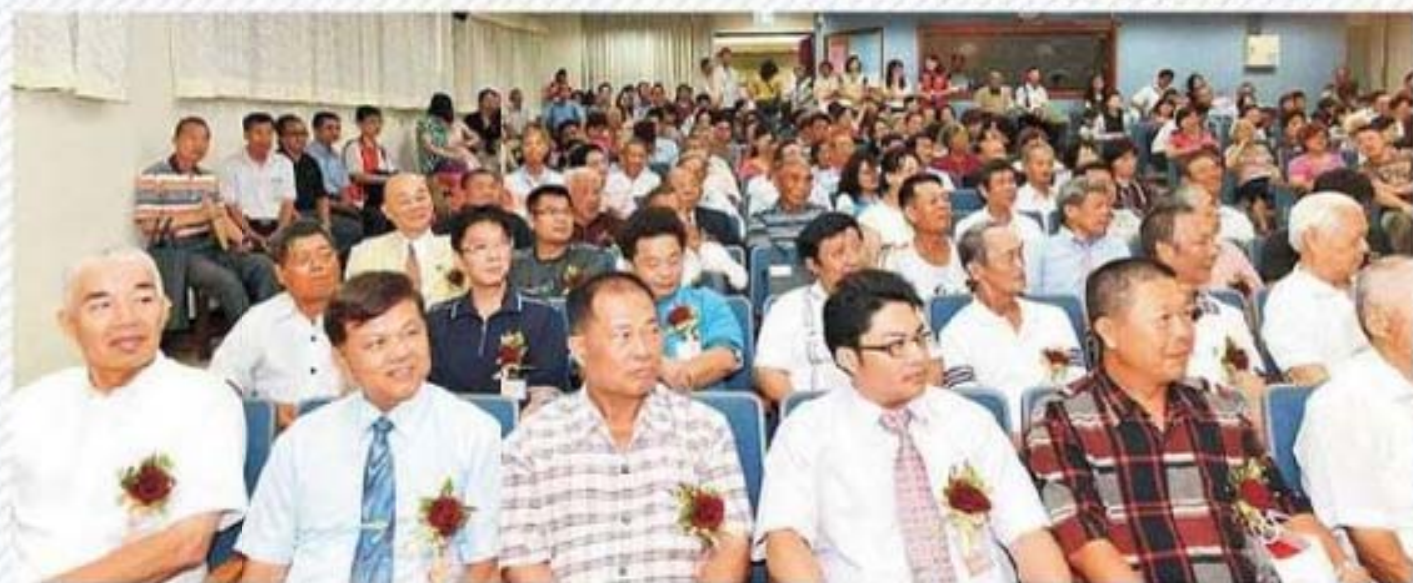
表揚場所坐滿蒞臨代表及親友，氣氛熱絡