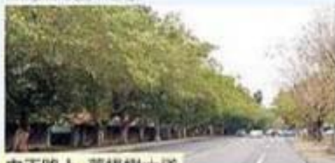
中正路上 菩提樹大道

樟樹(Camphor Tree - 學名Cinnamomum camphora (L.) Presl.)