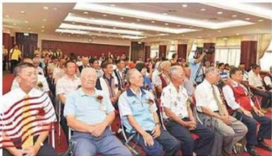
表揚場所坐滿蒞臨代表及親友