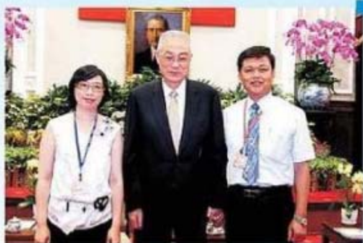
吳副總統接見嘉義市西區魏正城先生賢伉儷合影留念