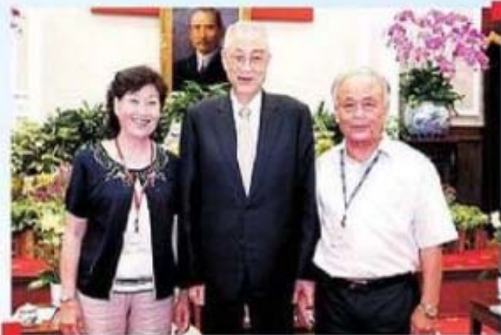
吳副總統接見雲林縣東勢鄉吳陳秋御女士賢伉儷合影留念