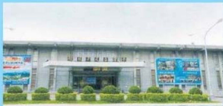
臺灣省政府資料館 Taiwan Provincial Administration Information Hall