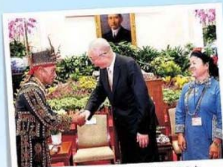
吳副總統(中)向屏東縣三地門鄉字草人物代表杜蘭胞先生(左一)致意。