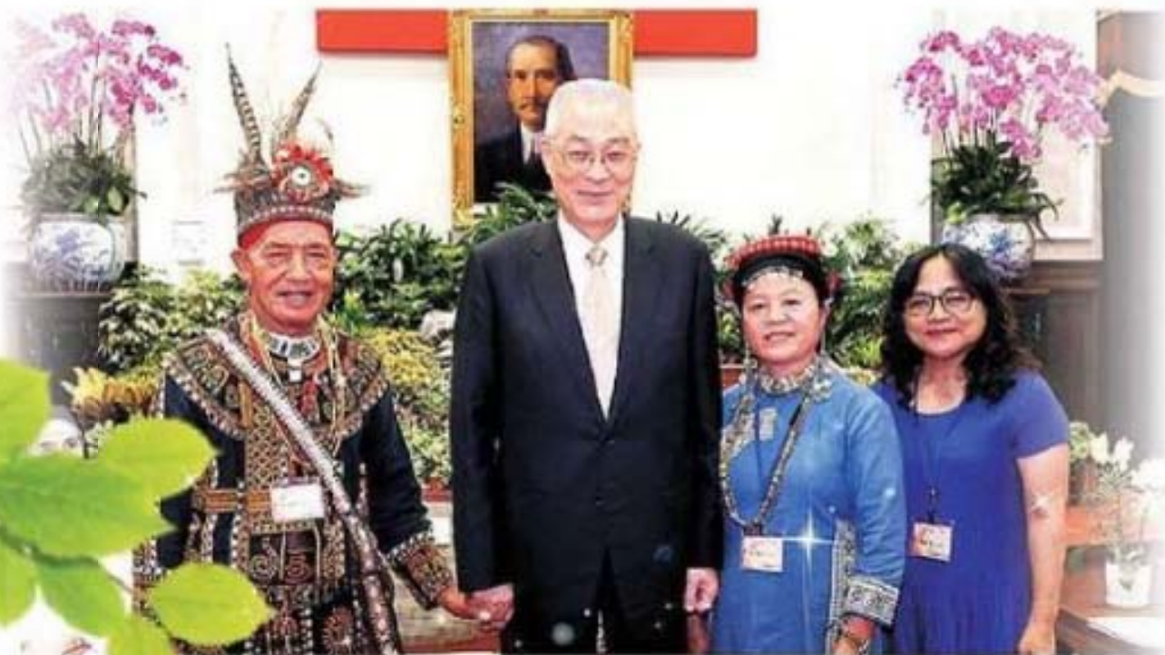
▼吳副總統接見屏東縣三地門鄉社前胞先生及其女暨梅美花村幹事合影留念