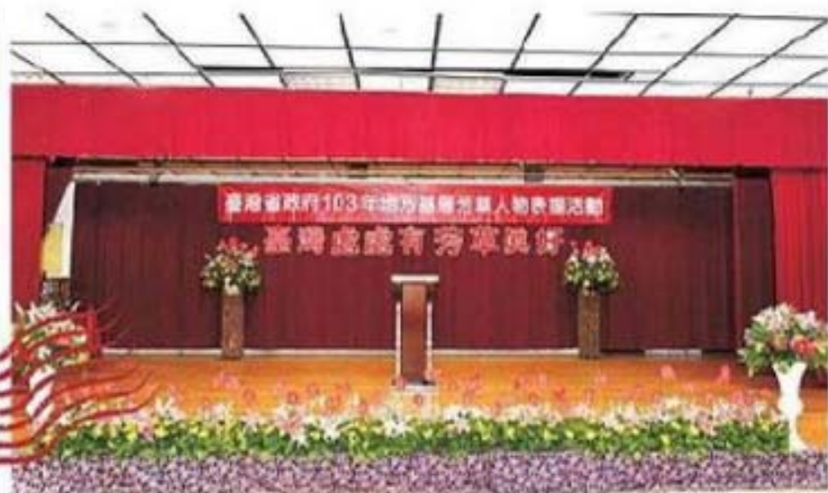
嘉義市文化局演講廳頒獎會場繁花點綴飄逸花香 呈現美麗與溫馨