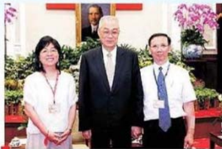
吳副總統接見花蓮縣玉里鎮傅胡娟女士賢伉儷合影留念