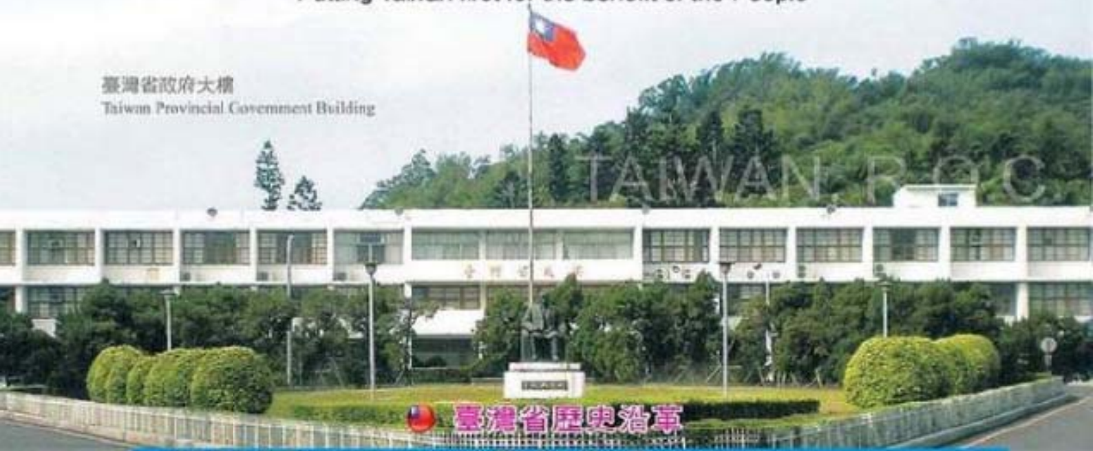
臺灣省政府大樓 Taiwan Provincial Government Building

Putting Taiwan first for the benefit of the People