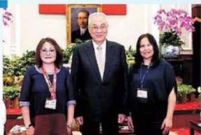
吳副總統接見桃園縣復興鄉馬利溪、西濱女士及表妹合影留念