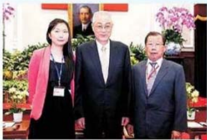
吳副總統接見宜蘭縣宜蘭市林載立先生及女兒合影留念