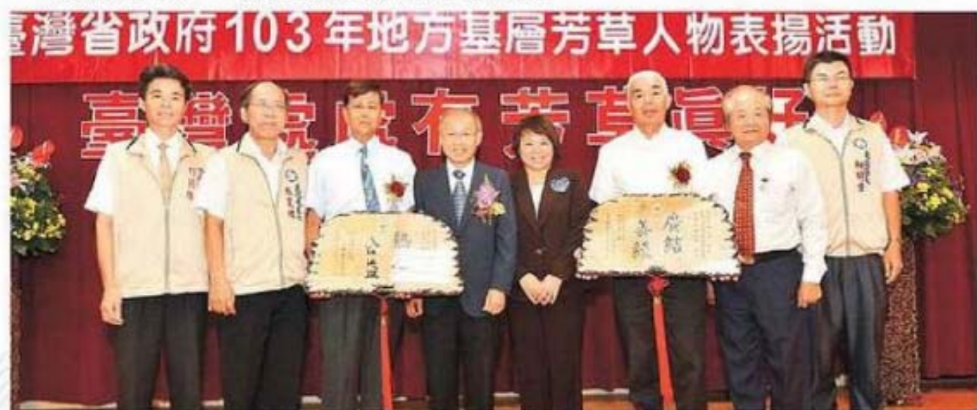
臺灣省政府林政則主席與嘉義市2位芳草人物代表合影。右4為嘉義市黃敏惠市長、右2為嘉義市李錫津副市長、左2為嘉義市政府民政處張寬煜處長、左1為柯國振區長右1為柳明宏區長