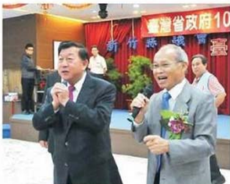
新竹縣邱鏡淳縣長親臨表揚會場 向芳草人物代表致意