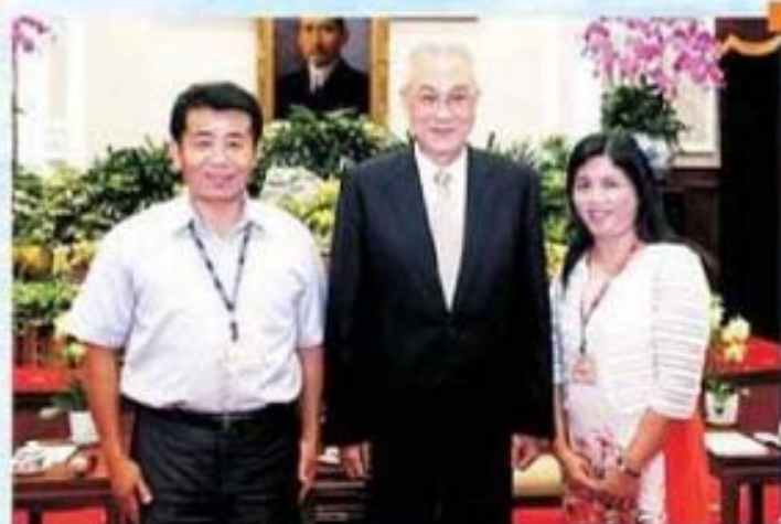
吳副總統接見彰化縣福興鄉陳永聰賢伉儷合影留念