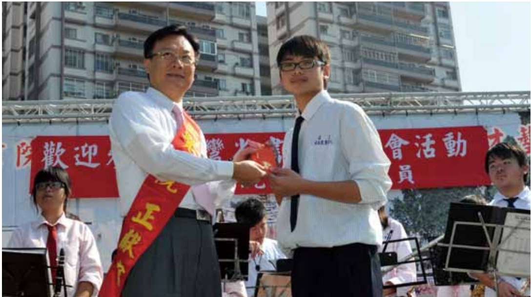
一向關心文化、重視教育的彰化縣長卓伯源，親自頒贈國立崇實高工學生獎學金。