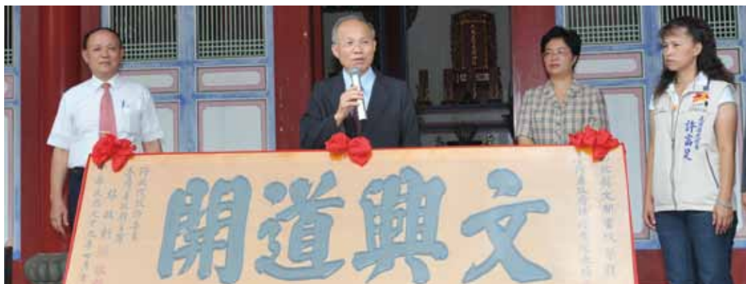
臺灣省政府辦理績優書院表揚，行政院政務委員兼臺灣省政府主席林政則親至文開書院頒贈「文興道開」匾額，並致詞勉勵，由左依序為省府廖登枝組長、林政則主席、鹿港鎮長兼文開書院負責人王惠美（現任立法委員）、鹿港鎮民代表許富足。