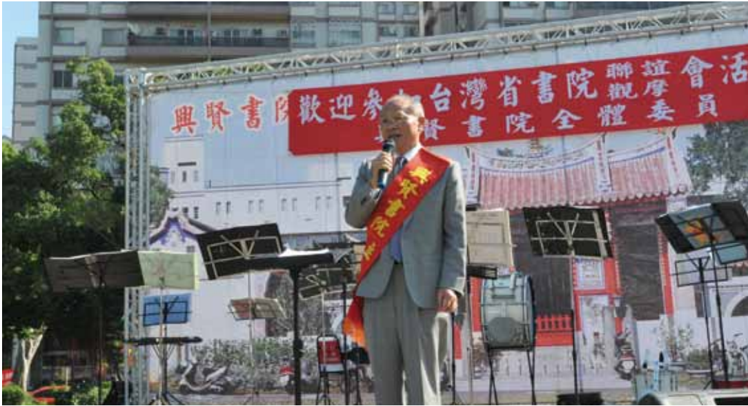
民國 100 年臺灣省書院聯誼觀摩會中，行政院政務委員兼臺灣省政府主席林政則致詞勉勵各書院推動傳統文化之精神。