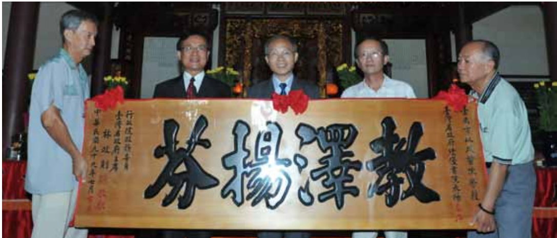
臺灣省政府辦理績優書院表揚，行政院政務委員兼臺灣省政府主席林政則親至以成書院頒贈「教澤揚芬」匾額，左 2 為臺南市長許添財、右 2 為以成書院石榮峰理事長。