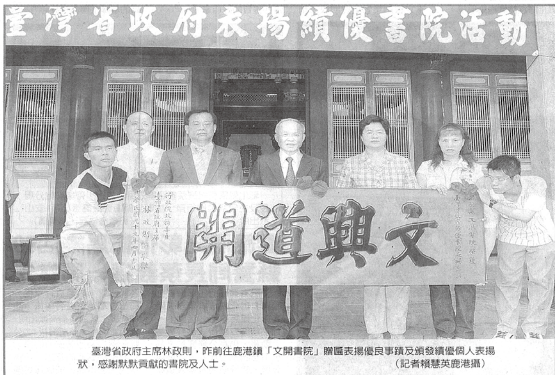
臺灣省政府主席林政則，昨前往鹿港鎮「文開書院」贈匾表揚優良事蹟及頒發績優個人表揚狀，感謝默默貢獻的書院及人士。

民國64年遭回祿之災，修復後民國74年經指定為國家三級古蹟，為鹿港文化搖籃。林主席之前擔任新竹市長期間政績斐然，因此被延攬擔任省主席，非常感謝林主席的關心文教，與厚愛文開書院及卓伯源縣長的大力支持，讓文開書院有此殊榮獲頒匾額表揚肯定。