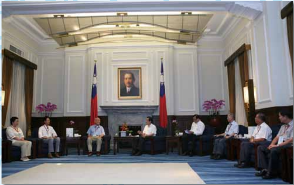
民國 99 年（西元 2010 年）六所績優書院代表 及個人晉見馬英九總統