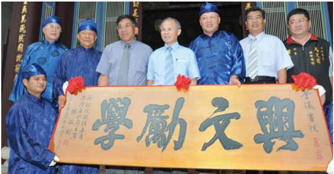
南投縣登瀛書院獲頒贈「興文勵學」匾額。