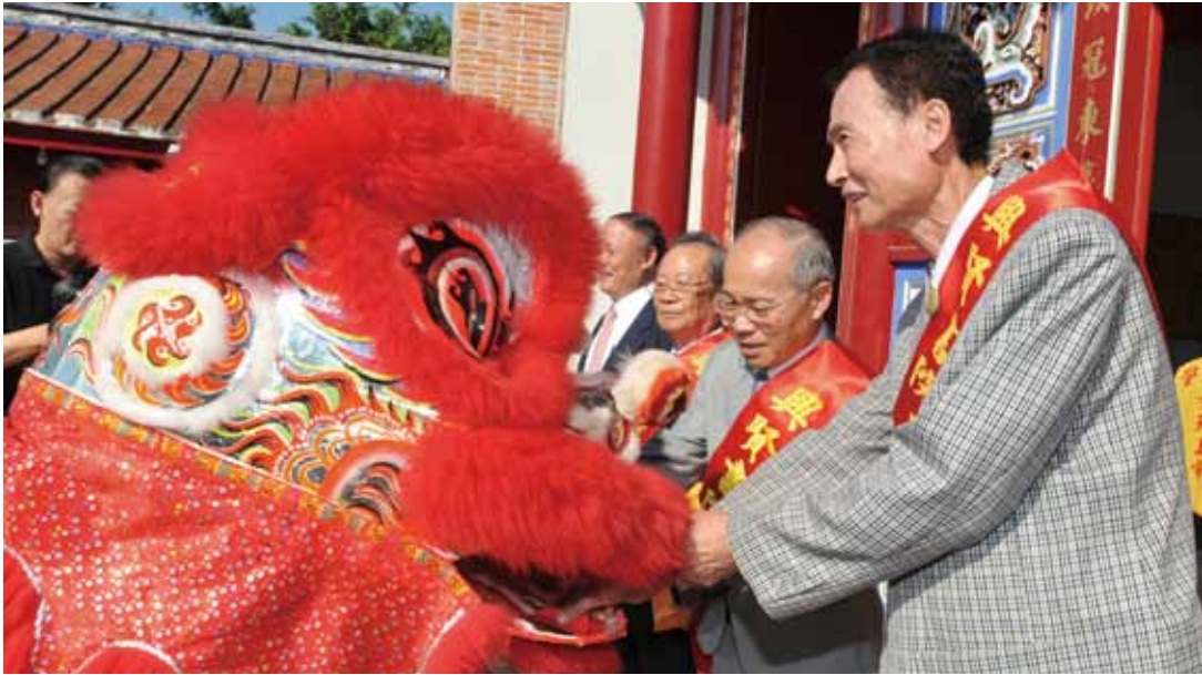
彰化縣興賢書院承辦民國 100 年臺灣省書院聯誼觀摩活動，舞獅暖場表演