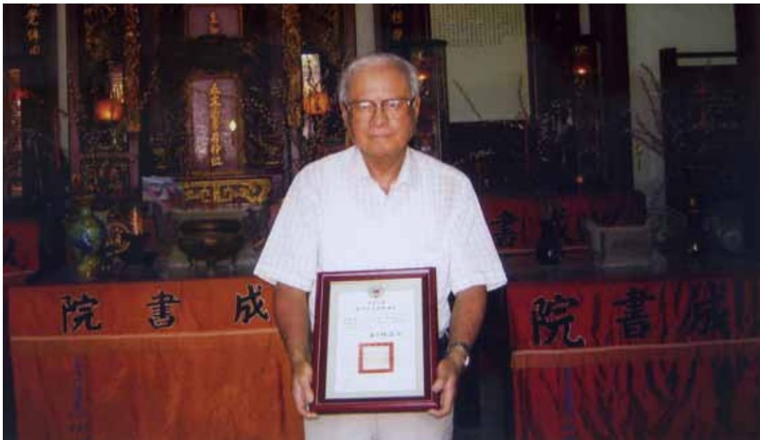
以成書院宋鑒堉禮長獲頒績優個人表揚狀

其父於民國38年加入書院為禮生，先生承繼父志於民國68年加入書院。民國83年起擔任書院之禮長一職，克盡職責，教導後進，為祭孔禮儀之傳承，仍戮力不懈。先生溫文儒雅，與人無爭，為書院禮樂生之典範，父子二人為書院奉獻60餘年，足堪表揚。