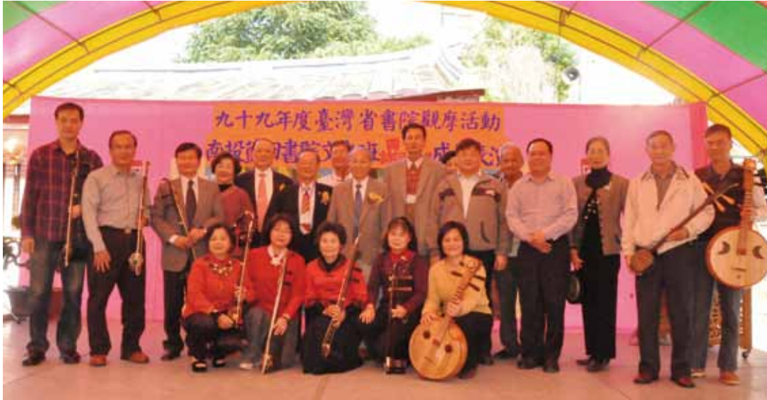
南投藍田書院文史研習班－國樂班精湛表演後合影