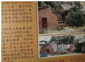
明志書院整修前的舊照