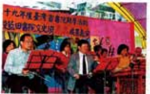
藍田書院文史班透過閱讀展現學習成果。 （記者謝介浩攝）

南投：首屆台灣省書院觀摩聯誼活動27日在南投市藍田書院舉行，由台灣省主席林政則主持，縣長李朝卿、南投市長許淑華等人也與會；林政則、李朝卿說，「農村再生條例」規範的內容，並非僅止於農村軟硬體建設與發展，詩詞歌賦等傳統文化的推動也是重要的一環，希望各書院踴躍提計畫爭取經費，共同朝「生活即文化、文化即生活」目標邁進，創造更優質的農村環境。 （記者謝介浩攝）