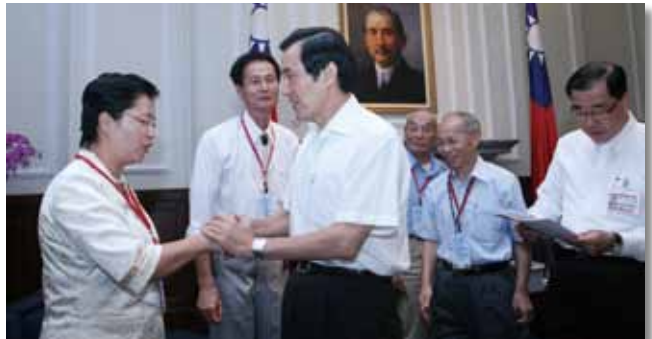
績優書院代表及個人—鹿港鎮長王惠美（左 1，現任立法委員）、彰化縣興賢書院黃達雄主任委員（左 2）接受馬英九總統接見勳勉（99.8.26）