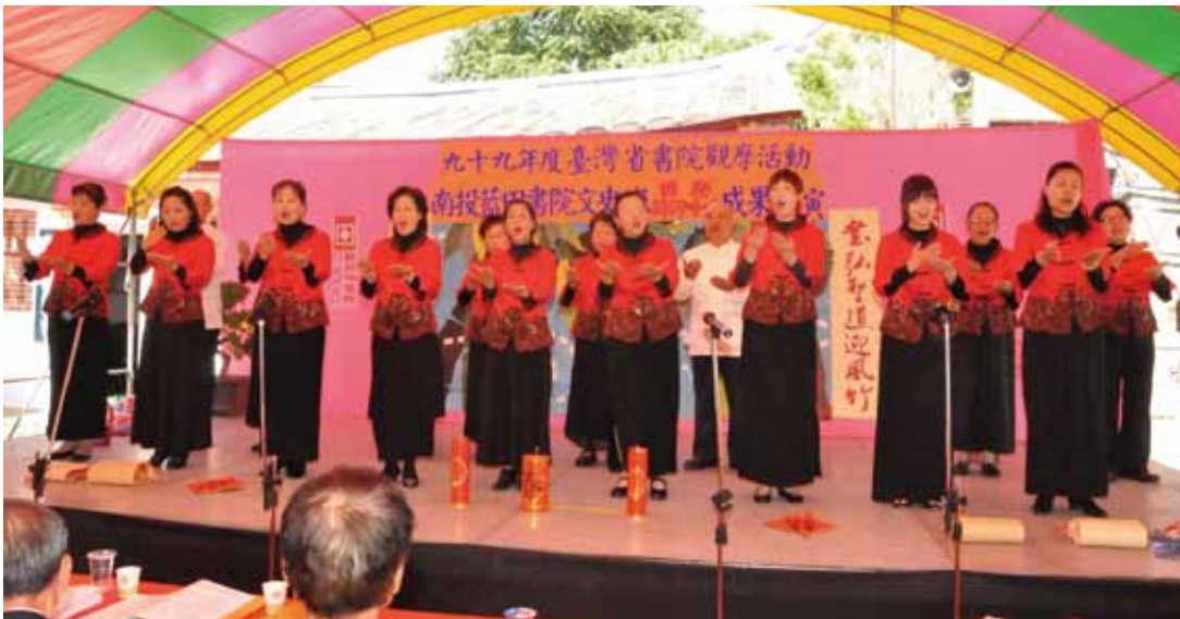
民國 99 年臺灣省書院觀摩會中，南投藍田書院文史研習班－詩詞吟唱班演出成功，獲掌聲不斷