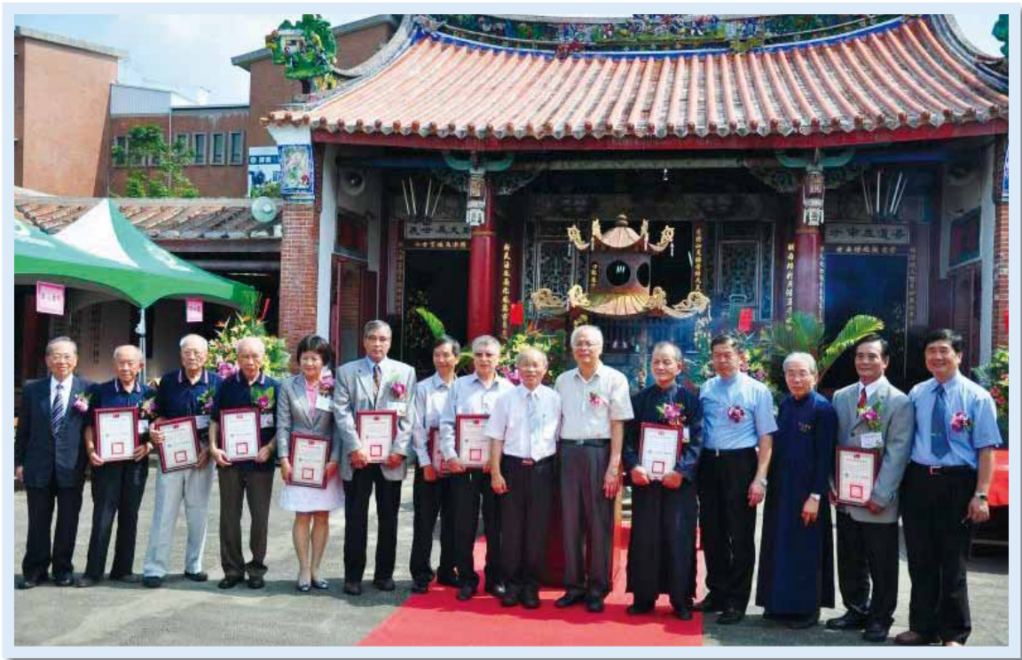
行政院政務委員兼臺灣省政府主席林政則（右 7）及南投縣陳志清代理縣長（右 6）與績優書院個人合影，左 1 為中華民國書院聯誼會歐禮足會長，右 4 為集集鎮長嚴鴻邦，右 3 為明新書院陳榮文主任委員，右 1 為彰化縣文化局陳允勇副局長