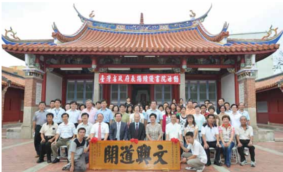
彰化縣文開書院全體志工同仁與出席貴賓在院前合影。