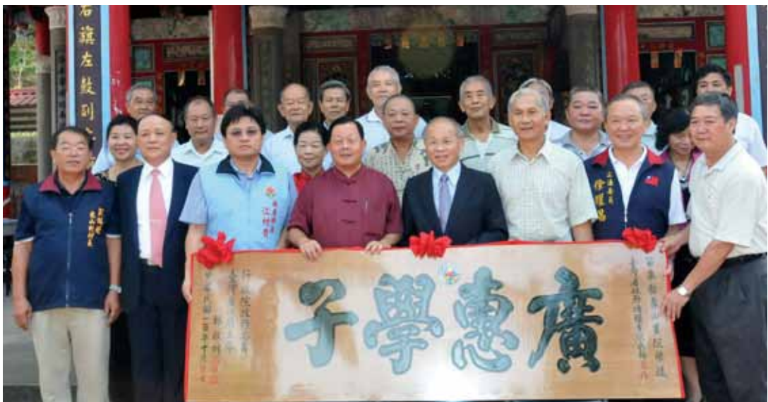
臺灣省政府主席以「廣惠學子」匾額，表揚象山書院的諸多文教貢獻，造福地方。