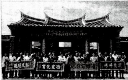
台、閩省主席與金門縣長、議長分別獻上大紅匾額祝賀，並與朱育合影。

發揚，也期盼透過活動能昇平福壽智慧的美譽，恢復清水祖師的傳統，並提供一處新的觀光文化景點，帶動地區觀光旅遊活動。 金門縣燕南書院暨太文巖寺魁星佛誕獻匾活動，亦已於上午十時二十分在古區山區的燕南書院舉行，繼而後敬開祭典活動也依序展開，分別由行政