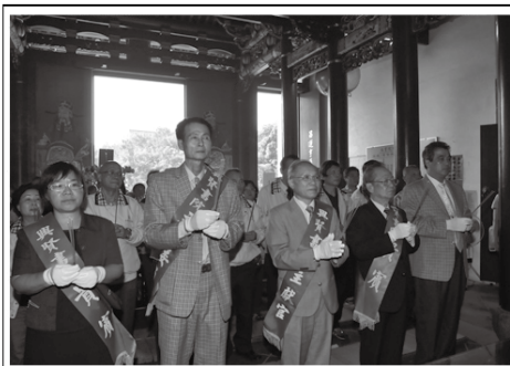
落實文化紮根，省府於興賢書院舉辦績優書院觀摩。