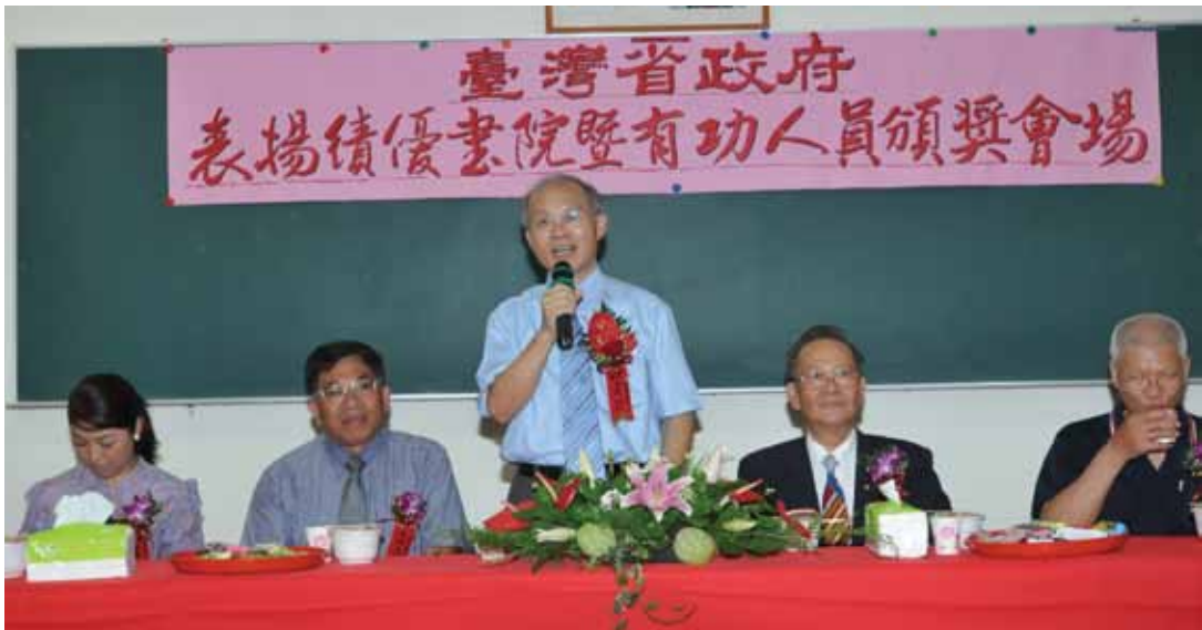
臺灣省政府辦理績優書院表揚，行政院政務委員兼臺灣省政府主席林政則親赴藍田書院贈匾並致詞祝賀，左起依序為南投市長許淑華、南投縣政府秘書長陳正昇、林政則主席、藍田書院主任委員歐禮足、吳應讓副主委