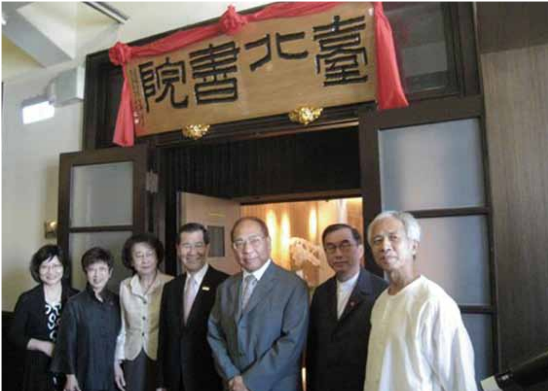
副總統蕭萬長等藝文人士為臺北書院揭牌。

【記者陳小凌/臺北報導】臺北市又多了一處深具禪意的人文空間！臺北市中山堂內的「臺北書院」今日舉行揭牌儀式。首任山長林谷芳表示，臺北書院未來將兼顧修行、學問、藝術、生活四個面向，提供大家一個體驗台灣文化生活美學的空間。