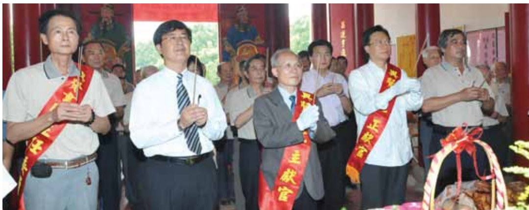
臺灣省政府辦理績優書院表揚，行政院政務委員兼臺灣省政府主席林政則親赴興賢書院上香參拜，前排由左依序為：興賢書院主委黃達雄、彰化縣文化局陳允勇代理局長、林政則主席、彰化縣長卓伯源、員林鎮民代表會林錦泉主席。