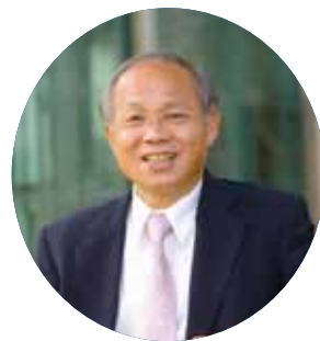
行政院政務委員 林政則 臺灣省政府主席

Minister Without Portfolio, Excutive Yuan and concurrently the Governor of Taiwan Province Lin, Junq-Tzer