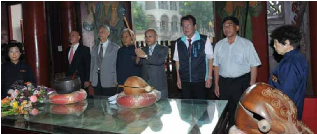
臺灣省政府辦理績優書院表揚，行政院政務委員兼臺灣省政府主席林政則親赴明新書院上香參拜，由左依序為：臺灣省政府廖登枝組長、臺灣省諮議員陳啟吉、明新書院陳榮文主任委員、林政則主席、臺灣省諮議員李宏裕、南投縣政府秘書長陳正昇。