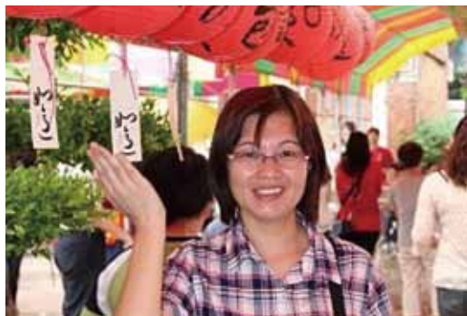
南投市簡姓民眾在光明燈掛上自己的祈福卡，祈許新願

【記者鄭富瑞/南投報導】南投市漳興國小龍吟國樂團學童悠揚的國樂演奏中，數百位南投學子和家長冒著小雨到藍田書院，向文昌帝君祈福求智慧，也接受南投市長許淑華、藍田書院主委歐禮足及所有貴賓的祝福，祈福者擲筊求得福袋、智慧水，領到狀元糕和金榜餅，再把寫上自己心願的祈福卡掛在光明隧道的光明燈上，祈求神明加持開智慧，25日上午的祈福開智慧活動功德圓滿。