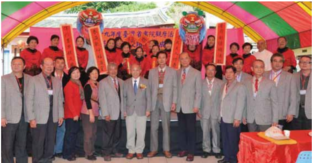
南投藍田書院詩詞吟唱班傑出演後合影之二