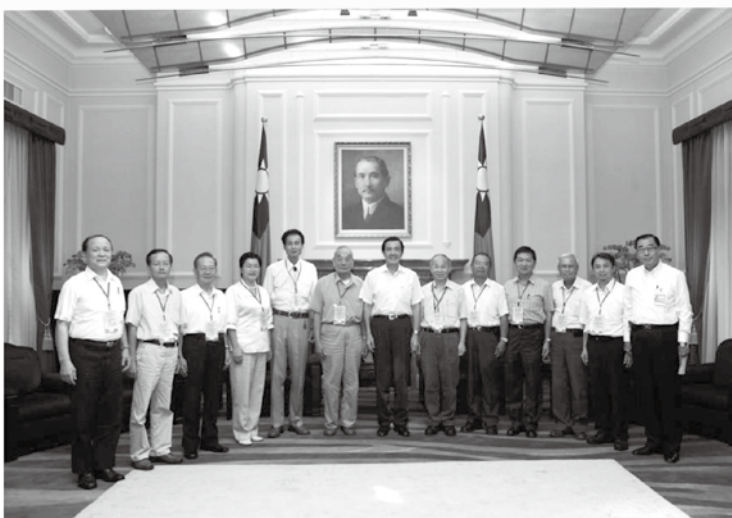
馬總統接見暨表揚績優書院及個人並與全體合影。

目的即在彰顯及肯定該等團體及個人默默付出之貢獻，未來本府將繼續辦理其它文化類別之表揚活動，使我國文化紮根工作更落實於基層，及喚起國人從事文化工作之原動力。