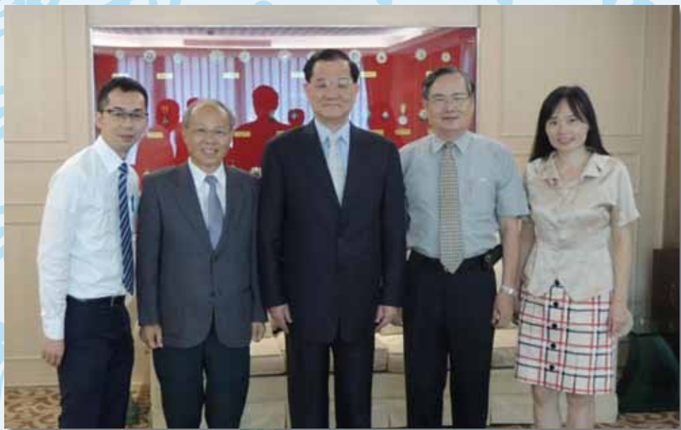
連前副總統（中）與省府林政則主席（左二）、 陳耀宗組長（右二）、林麗玲科長（右一）、邱 一峰專員（左一）合影