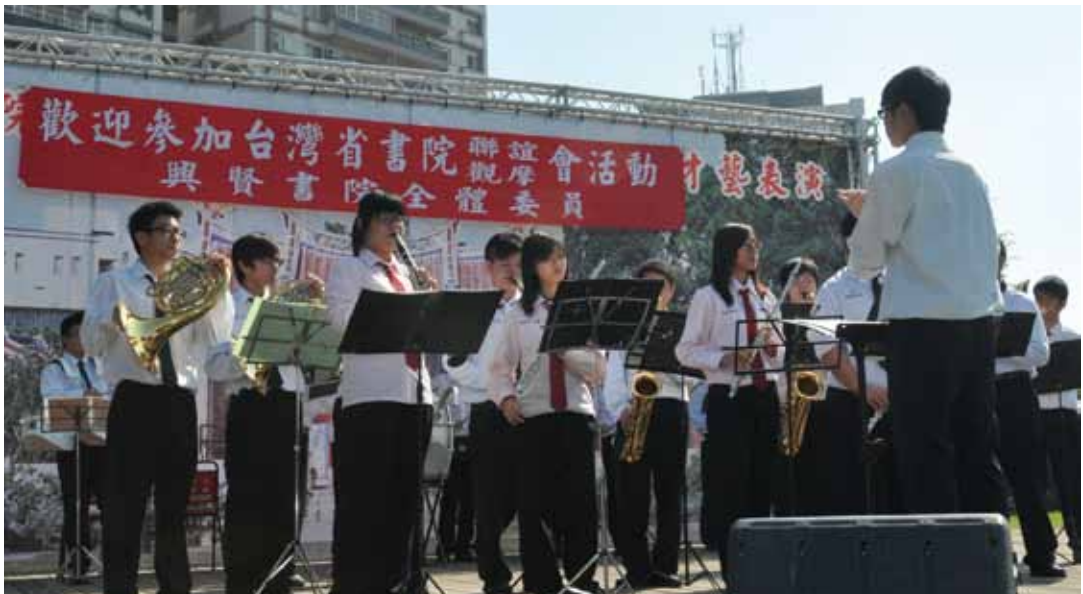
民國 100 年臺灣省書院聯誼觀摩會，邀請彰化縣大慶商工樂隊精彩表演