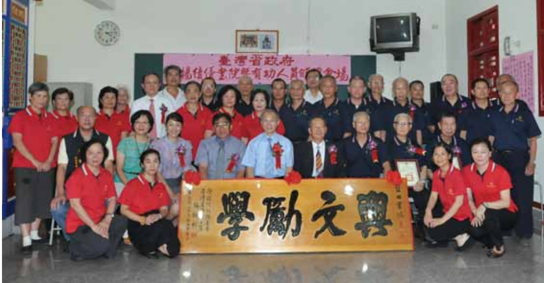
臺灣省政府主席以「興文勵學」匾額，向藍田書院表示敬謝，並與出席貴賓合影。