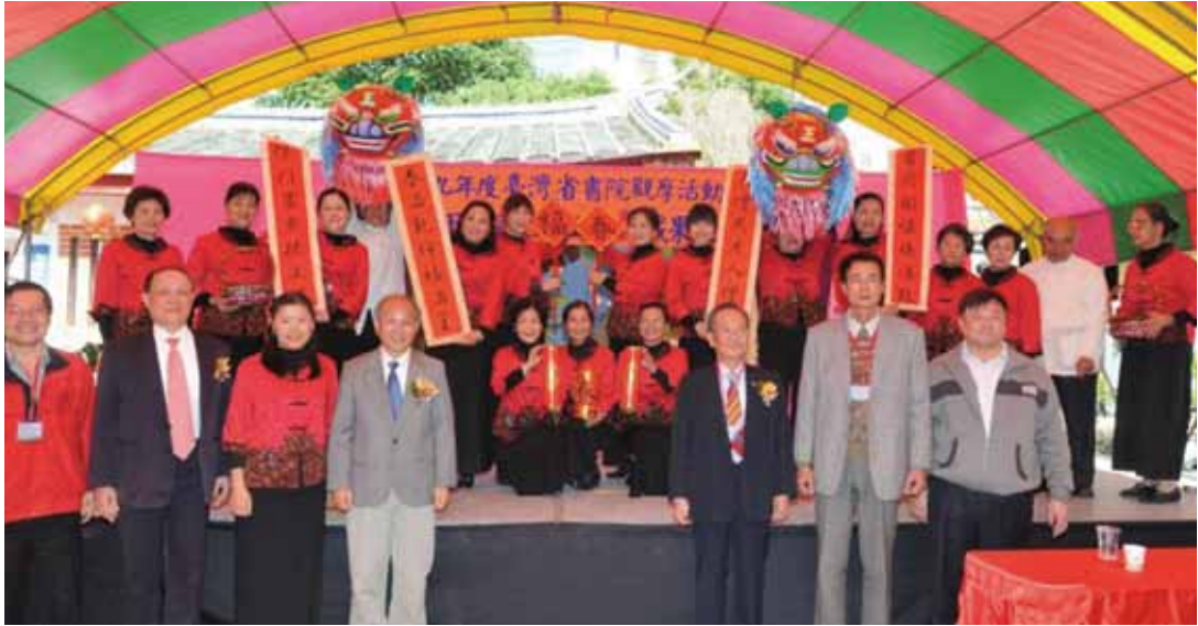
南投藍田書院詩詞吟唱班傑出演後合影之一