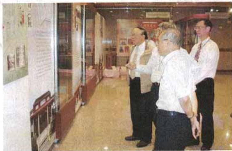
↑省府林政則主席參觀臺灣書院史料文物特展情形。

林政則主席表示，書院不僅是一個教育機構，同時還是一個文化組織，更是從事文化研究創造與傳播的主體。書院已成為地方文化教育的中心，舉凡在培養地方人才、獎勵文風、傳遞文化上，都具有積極、正面的作用。