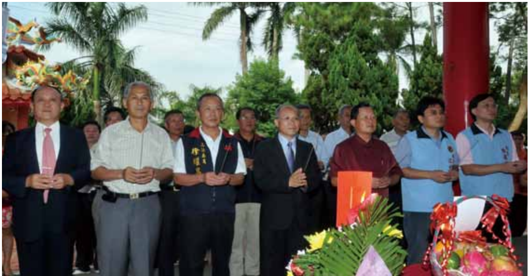
臺灣省政府辦理績優書院表揚，行政院政務委員兼臺灣省政府主席林政則親赴象山書院上香參拜，前排由左依序為：省府廖登枝組長、象山書院邱玉麟主任委員、立法委員徐耀昌、林政則主席、苗栗縣長劉政鴻、頭屋鄉長江村貴及苗栗縣文化觀光局陳星宇局長。