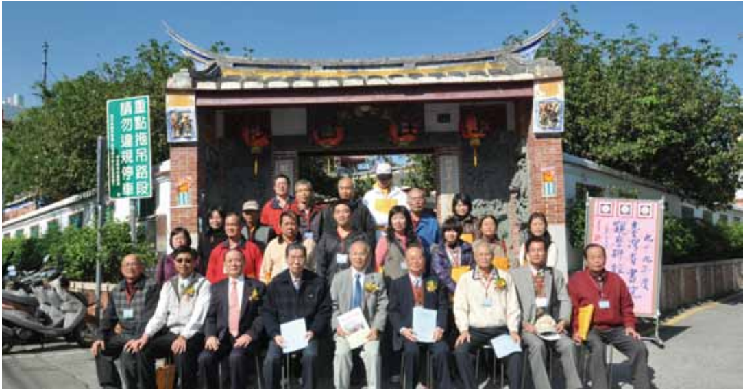
民國 99 年臺灣省書院觀摩聯誼會後，各書院代表及與會貴賓合影