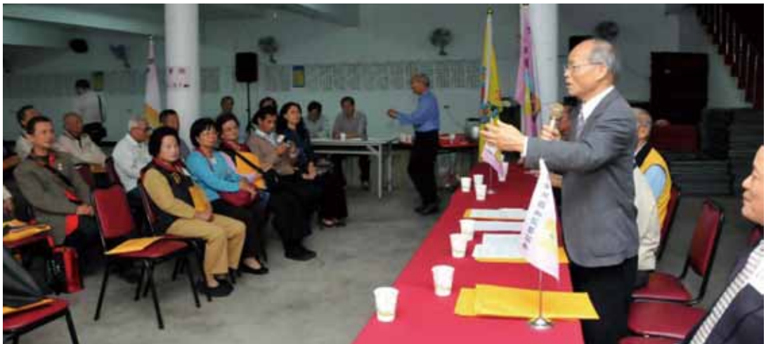
民國 101 年中華民國書院聯誼觀摩會在苗栗頭屋鄉象山書院舉行