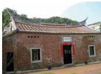
明志書院（歷史建築）