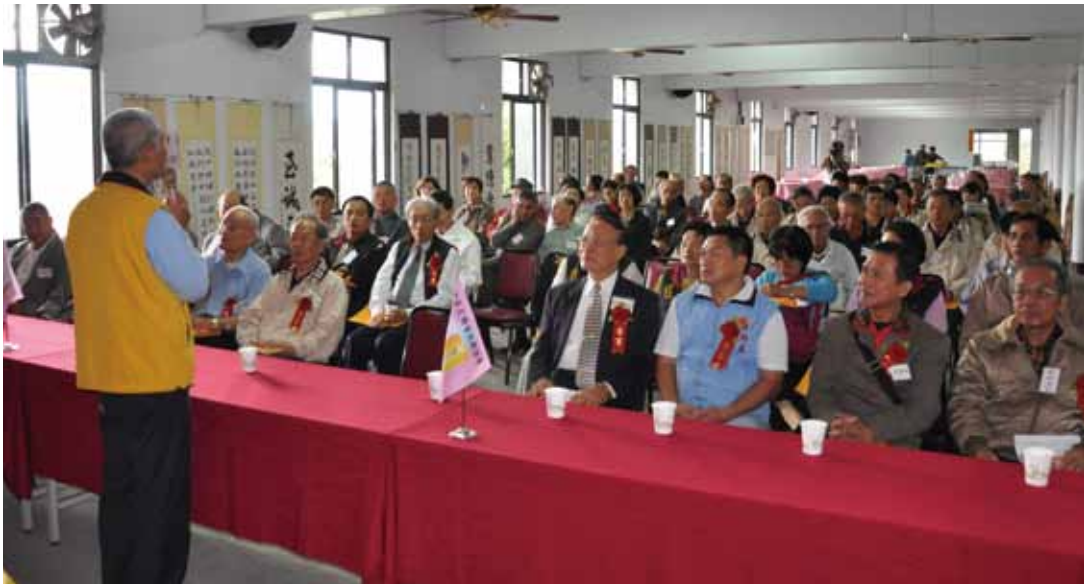
民國 101 年中華民國書院聯誼觀摩會，來自各地書院代表及貴賓齊聚一堂，熱烈交流