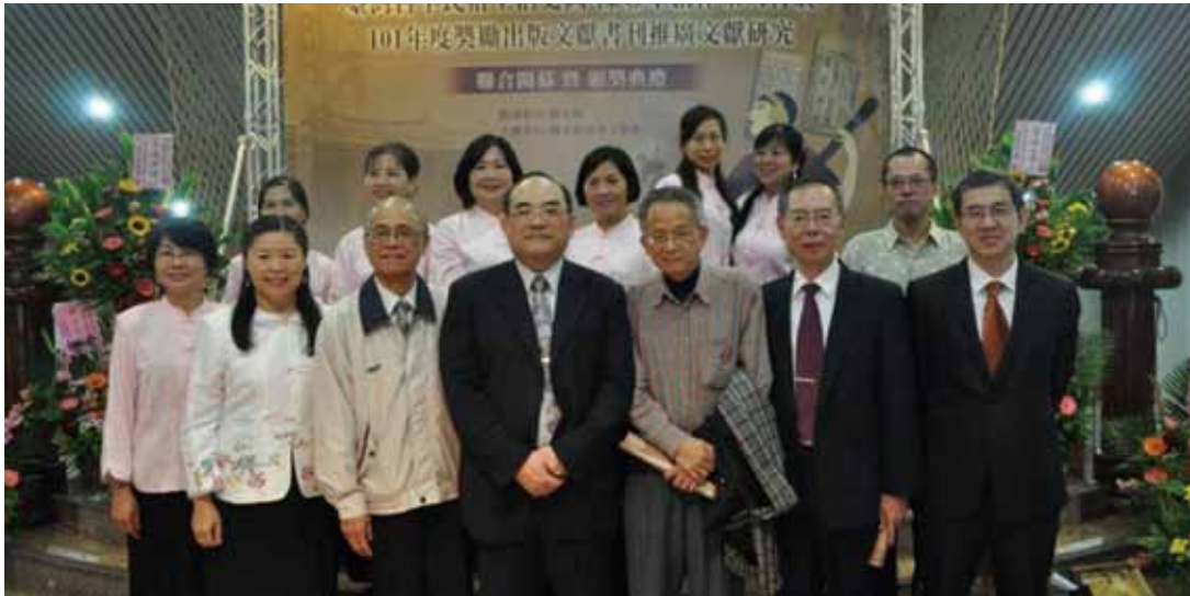
省府簡俊淦副秘書長（前右 2）、臺灣文獻館張鴻銘館長（前中）與表演者合影

【記者洪德/南投報導】國史館臺灣文獻館 11 月 22 日 下午 2 時，於該館文物大樓舉行「臺灣書院史料文物特展」、「臺灣古早民俗生活史圖-陳豐章創作系列特展」聯合開幕暨「101 年度獎勵出版文獻書刊推廣文獻研究頒獎典禮」，由該館館長張鴻銘主持，臺灣省政府簡俊淦副秘書長特別代表林政則主席祝賀此次展出圓滿成功。