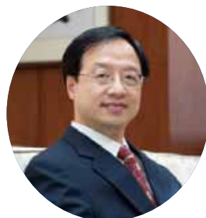
行政院江宜樺院長 Executive Yuan Premier Jiang Yi-Hua