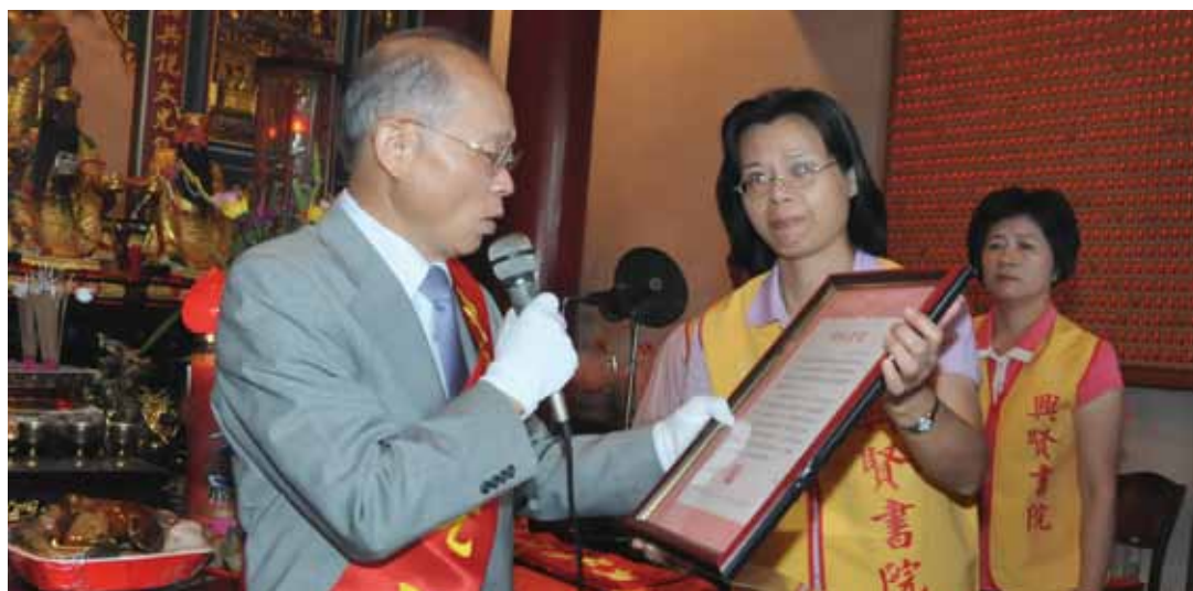
民國 100 年臺灣省書院聯誼觀摩會中，行政院政務委員兼臺灣省政府主席林政則宣讀馬英九總統賀電。