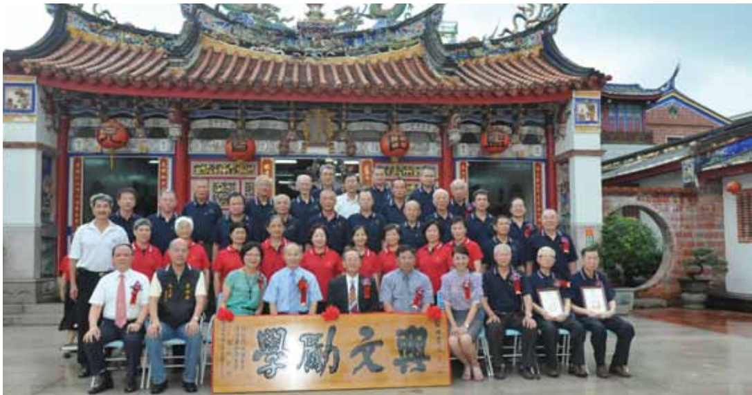
南投縣藍田書院志工與出席貴賓在院前合影。