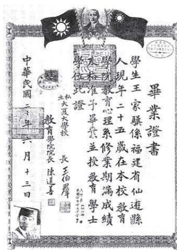
■ 上海大夏大學教育學士學位證書

以北平不寧為由，要求兒子南返，因此僅在匯文中學讀了一年後便休學。南遷至上海後，適值上海大夏大學招生，王老校長便參加考試，考進該校的大學預科（當時學制為中學四年，預科二年，大學四年）。念了一年後便直升大學部就讀，王老校長並用暑假將所需學分修完後，於1931年6月13日獲得上海大夏大學教育學士學位，畢業後離開上海回到福建服務桑梓，先後擔任福建小學校長、中學各處主任、師範學校教師、督學、地方教育幹部等十餘個基層教育職務。在擔任福建省行政幹部訓練團講師時，王老校長負責教導區