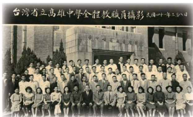
■ 1976年王校長參加畢業歡送會

長的教育、治校理念、辦學特色及其對雄中影響與社會國家的貢獻，敘述一二，以為紀念。