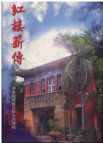
■ 《紅樓薪傳：王家驥校長百齡嵩壽專輯》封面

今王老校長於西元 2010 年 11 月 1 日以一百零五歲高齡，安然過世，因而失去了一位愛護我們的老校長，我們大家都哀痛不已，但他平凡的一生，卻創造不平凡的成就，他的為人處世是教育界的典範，他的身教、言教更人人學習的榜樣，也是社會國家的典範。在這高唱教育變革的年代中，如果我們每一教育工作者，都能如王老校長一樣，擁有「精神富貴，老師不死」之愛的教育的實踐者，把時間與心力完全投入，時時為教育，處處為學生，則我們臺灣教育的願景必將是光明寬廣。