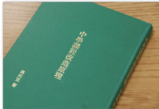
▲ 中學課程改造原理 (圖：攝於國立臺灣師範大學圖書館)

延長國民教育年限之後，必須劃分國中學區，使國小畢業生可以在本學區內的國中就讀，以免遠道通學，舟車勞頓之苦。同時要發揮社會中心教育的精神，使地方人士以全力支援本學區內的國民中學，來發展本學區內的國民中學。