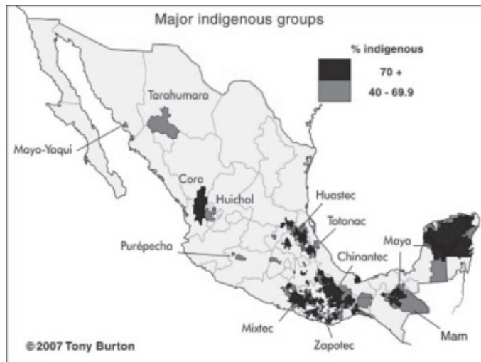
圖1 墨西哥原住民分布圖。

墨西哥是一個多元文化的國家，但原住民仍處於社會的底層，原住民處於極度的貧窮之中，表現出低落的就學率，而且在空間地理上居住在廣袤土地上的孤立部落中（圖1）。原住民無疑是墨西哥人口中最易受害的族群，約600萬人口壓縮在原住民的名稱之下，代表著卻是極大的文化與語言差異：他們使用85種不同的語言與方言，雖然大部分（52%）的原住民使用Nahuatl 語(2,563,000人)、Maya語（1,490,000人）、Mixteco語（764,000人）或Zapoteca語（785,000人），但有些語言（Cucapa語（250人）、Kiliwa語（30人）、Kumiai語（300人））卻已在滅絕的邊緣中掙扎了(Santibañez,et. al., 2005)。