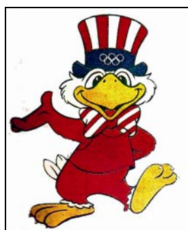
圖 1：洛杉磯奧運吉祥物山姆

如同奧運標誌的使用權，未經主辦單位的委託許可，任何機構或個人均不得為商業目的，以及潛在的商業目的，使用吉祥物，為的是保護主辦單位、贊助廠商的利益目的。根據「奧林匹克標誌保護條例」的規定，為商業目的使用吉祥物，是指以營利為目的 (第 29 屆奧林匹克運動會組織委員會網站)。