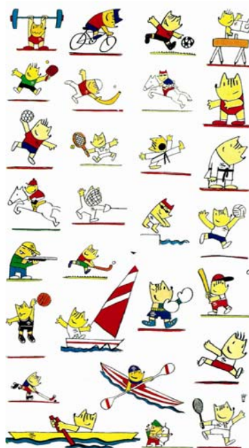
圖 4：巴塞隆納奧運吉祥物科比