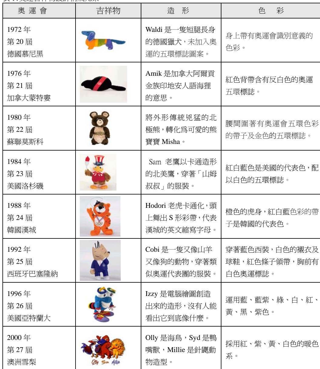
表 1: 奧運吉祥物設計構成元素

1980 年第 22 屆蘇聯莫斯科奧運吉祥物，將外形兇猛的北極熊傳統印象，轉化為可愛的熊寶寶 Misha，首次正式以「擬人化」的方式，作為奧運吉祥物構成元素。1984 年美國洛杉磯奧運會名叫山姆 (Sam) 的吉祥物，是首次加入電影卡通的構成元素，並且將吉祥物使用在各個單項運動的造形上 (如籃球、游泳、自行車等)。