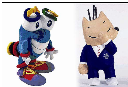
圖 2：亞特蘭大依奇與巴塞隆納科比屬創新造形