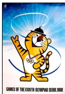
圖 5：漢城奧運吉祥物