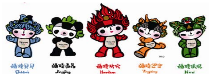
圖 7:北京奧運吉祥物五福娃

2008 年富有中國傳統藝術的表現方式，與 2004 年具有希臘式幽默趣味的相比較，在繪畫表現截然不同，「福娃」趨向於保守的平面圖案表現；「雅典娜和費沃斯」卻偏向於活潑的流利線條表現。