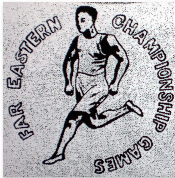
1915年第二屆遠東運動會在上海舉行，當時大會標誌(Logo)。

辦理比賽的工作人員仍仰仗洋學校外國人，但學生選手在這次比賽表現傑出，中國隊在田賽、徑賽、游泳、足球、排球都得到冠軍，最後「總錦標」由中國獲得，菲律賓第二、日本第三。