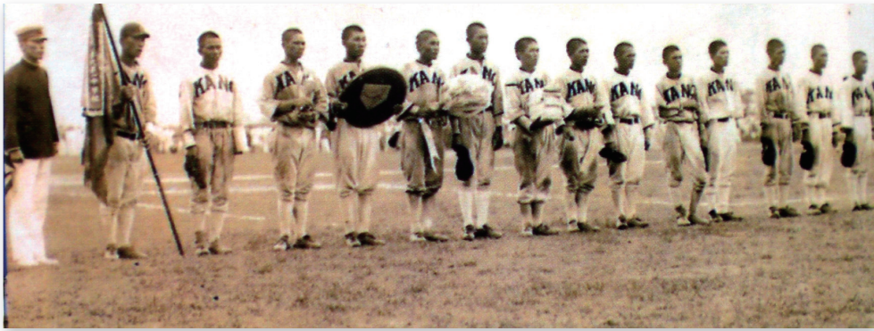
1921年嘉義農校棒球隊在日本甲子園全日高校棒球賽得到亞軍，震驚全日。

嘉義農校在第一場3：0贏了神奈川商工，第二場19：7大贏札幌商校，第三場10：2又打敗小倉工校晉級到決賽。最後0：4輸給中京商業得到亞軍。日本的高校有630支棒球隊，每隊都有