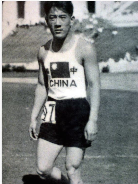
1932年第一位參加奧運的中國選手劉長春，當時他是東北大學學生運動員。