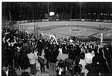
◀ 運動看臺上觀眾熱情的支持，鼓舞運動員的士氣。

平凡生活中所需的「意義」感受。運動正不斷擴大「觀賞」的社會與文化意義而成為大眾閒