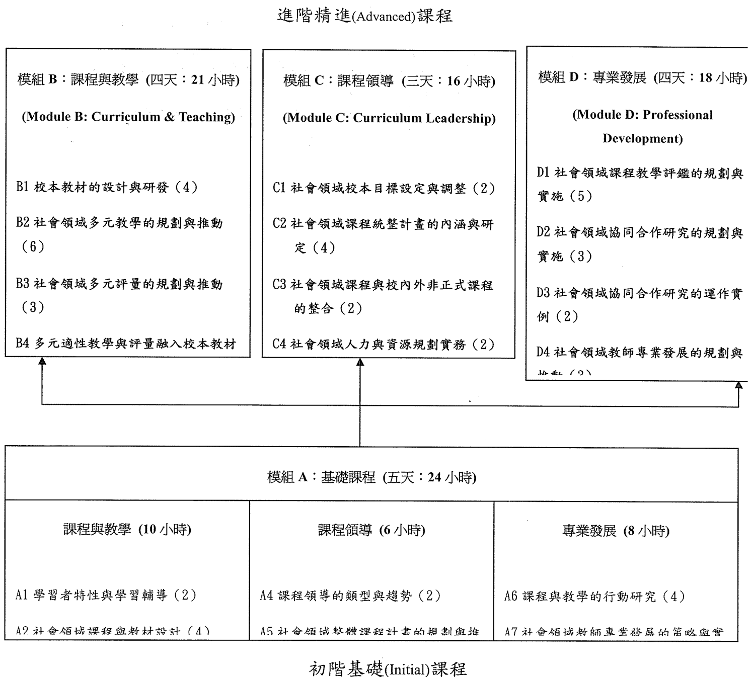
圖 4-1 社會學習領域課程與教學領導人才專業發展課程架構