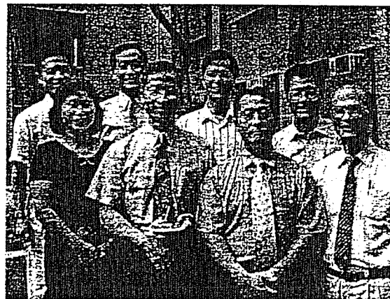
專家演講座談—活動照片 2