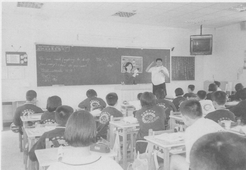
實習老師帶活動