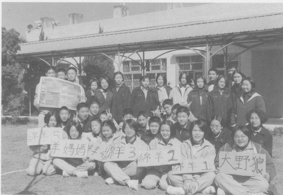
舉辦英語聯歡會，會後合影（石岡國中提供）