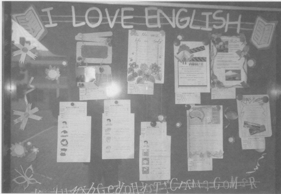
英語公告欄，定期更新學生作品