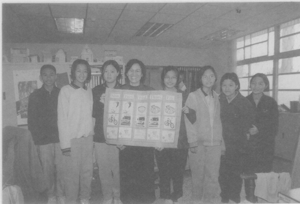
師生合作學習，營造良好氣氛