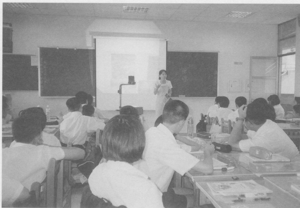
地理科蔡老師協同教學，介紹墾丁的地形、地質及植物