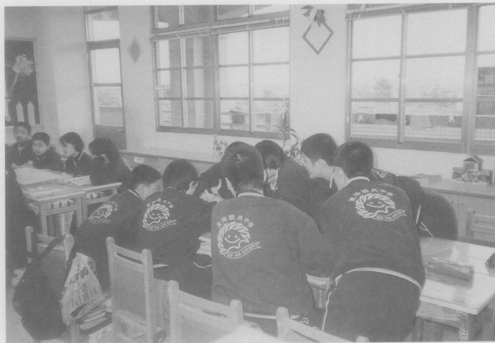
分組合作學習