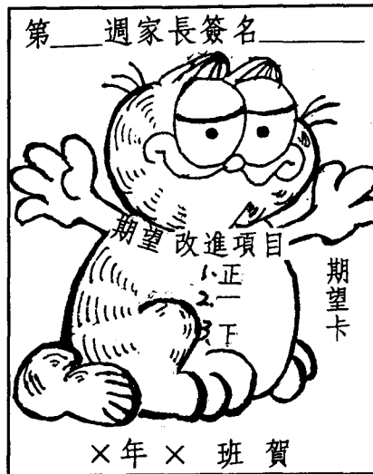
圖三 個人表現期望卡