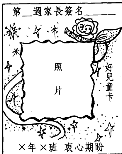
圖二 個人表現榮譽卡