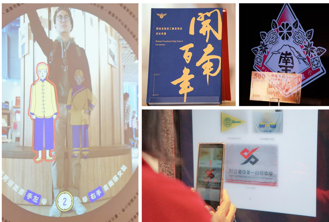
除了老校文物外，還有互動式擴增實境、解謎遊戲、浮空投影等多樣設施供民