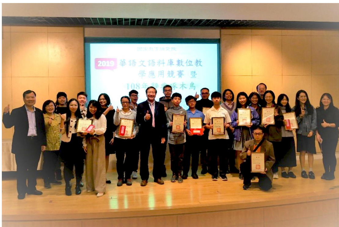
全體得獎者及貴賓合影